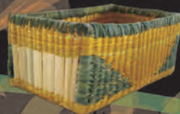
PANERA Materiales: Caña Brava Tejido 1:1, 2:1