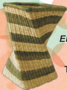
FLOTERO ENTORCHADO Materiales: Caña Brava Tejido 1:1, 2:1