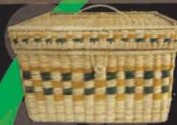
PAÑALERA Materiales: Caña Brava Tejido 1:1, 2:1