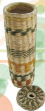
CONTENEDOR CILINDRO Materiales: Caña Brava Tejido 1:1, 2:1