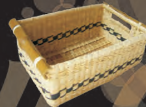
PANERA Materiales: Caña Brava y Bambú Tejido 1:1, 2:1