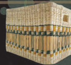
REVISTERO Materiales: Caña Brava Tejido 1:1, 2:1