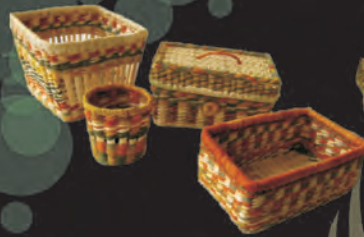
CANASTOS VARIOS Materiales: Caña Brava Tejido 1:1, 2:1