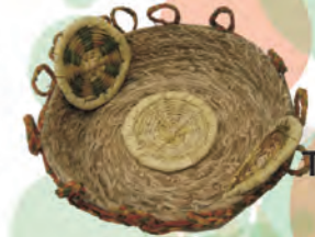
FLOTERO Materiales: Caña Brava Tejido 1:1, 2:1