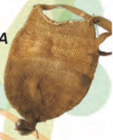
MOCHILA TEJIDA Materiales: Fique Tejido 5 Agujas