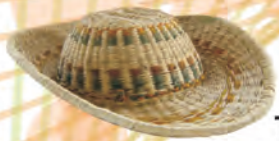
SOMBRERO Materiales: Caña Brava Tejido 1:1, 2:1