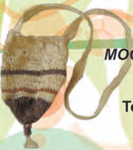
MOCHILA TEJIDA Materiales: Fique Tejido 5 Agujas