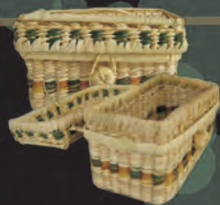
CANASTO RECTANGULAR Materiales: Caña Brava Tejido 1:1, 2:1