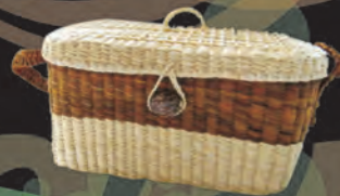
BOLSO PLAYERO Materiales: Caña Brava Tejido 1:1, 2:1