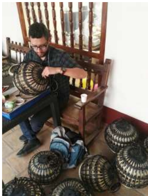
Ensamble de productos de iluminación para laboratorio Bogotá Noviembre de 2017 Lugar: Oficinas ADC

Por otro lado el diseñador líder Samuel López me solicitó un apoyo en el ensamble de diferentes productos de iluminación de gran relevancia para la feria, dentro de las labores realizadas estuvieron la compra de materiales para los sistemas eléctricos, ensamble de los mismos y arreglo de piezas que pudieran venir defectuosas o que debían ser elaboradas.