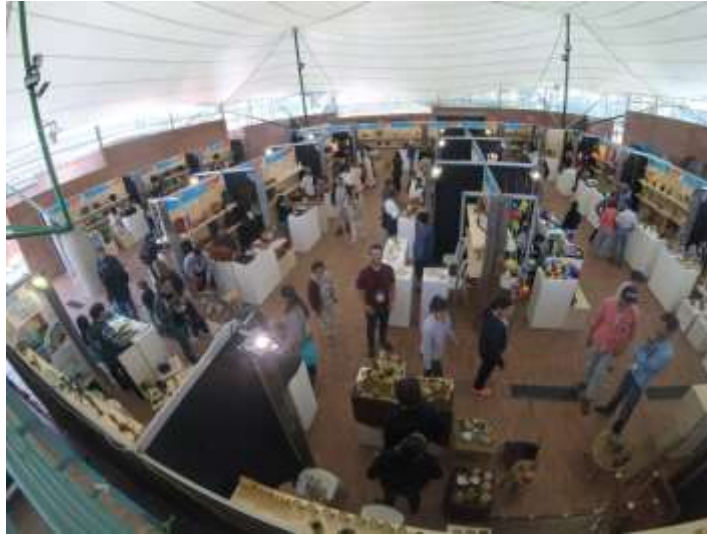
Panorámica de la feria Bogotá Artesanal Domingo 22 de Octubre de 2017

Domingo 22 de Octubre, el último día de la feria tuvo una alta afluencia de público en comparación de los dos anteriores días, y aunque las ventas fueron satisfactorias estas fueron menores al día sábado, sin embargo en términos generales, la primera edición de Bogotá Artesanal termina no solo con éxito, sino que se convierte en símbolo de la renovación de la plaza de los artesanos.