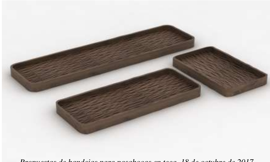
Propuestas de bandejas para pasabocas en teca 18 de octubre de 2017