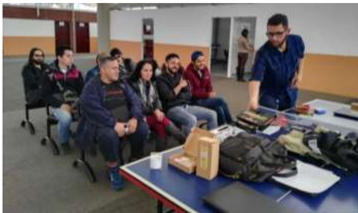
Revisión de producto a los artesanos del grupo de formación 3 de Octubre de 2017

En octubre 3 se realiza una revisión de producto a los artesanos del grupo de formación, donde se analizan los objetos que presentaron fallas en la convocatoria de septiembre, paralelo a esta revisión se hace una charla sobre producto artesanal y caracterización de los oficios.