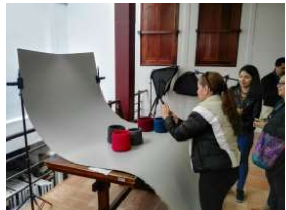
Sesión fotográfica de productos para Laboratorio Bogotá 17 Noviembre de 2017 Lugar: Salón de Telares - ADC