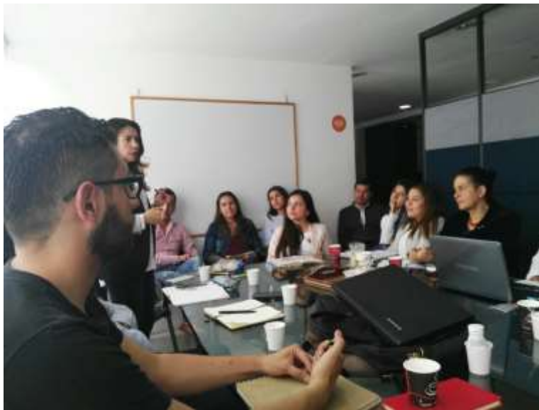
Reunión de caracterización de oficios y definición de conceptos de diseño para la artesanía 22 de Septiembre de 2017 Lugar: Oficinas ADC calle 74

El Viernes 22 de septiembre se lleva a cabo una reunión en las oficinas de ADC, en la cual se conversa sobre conceptos de diseño para la artesanía y caracterización de oficios además de hacer una breve socialización con algunos de los miembros de los equipos de diseño de otras regiones, donde Artesanías de Colombia tiene presencia.