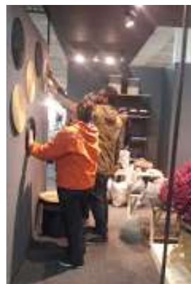
Montaje de stands y exhibición feria expoartesanas 2017 5 de Diciembre de 2017