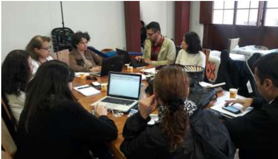
Comité final de diseño stand proyecto alcaldía 27 Noviembre de 2017 Lugar: Salón de Telares - ADC