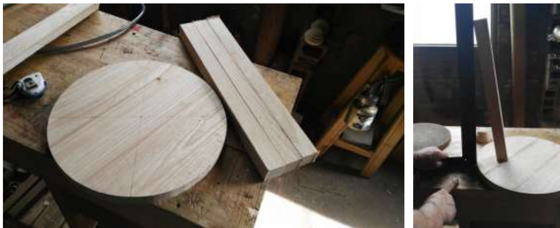
Predimensionado de prototipo mesa auxiliar 2 de Octubre de 2017

El 2 de octubre, se lleva a cabo la segunda visita al taller del Artesano Alberto Melo, donde se procede a la elaboración del prototipo de la mesa auxiliar en esta asesoría se revisan las dimensiones y ensambles que se van a emplear en la construcción del producto, se discute sobre el tipo de acabado a realizar y tiempos de entrega.