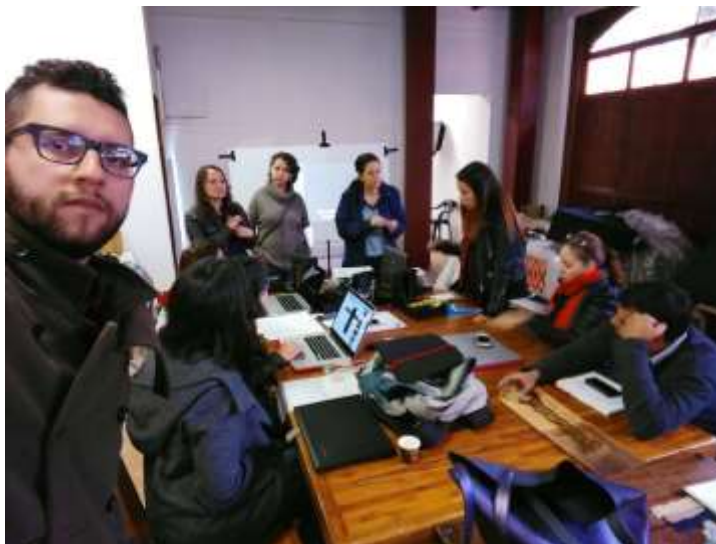
Comité de diseño stand proyecto alcaldía

A su vez el viernes 17 de noviembre se realizó un comité de diseño para el Stand del proyecto alcaldía, en dicha reunión se revisaron los productos que no se vieron en los anteriores comités de producto, dentro de los productos con más presencia en la revisión fueron los pertenecientes al oficio de la tejeduría (Cojines, mantas, etc).