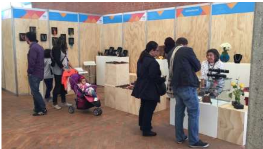
Área donde se había establecido el showroom en la Feria Bogotá Artesanal 21 de Octubre de 2017 Lugar: Plaza de los artesanos – Plaza8

Las ventas fueron tan altas, que el showroom que se instaló para muestra de diferentes productos de los artesanos, tuvo que ser desmontado debido a que todo el producto que estaba en dicha área fue adquirido por los visitantes.