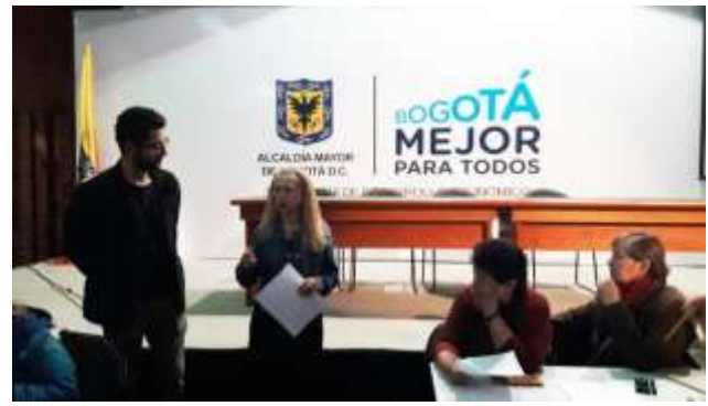
Charla sobre metodología de diseño por referentes y taller de creatividad Lugar: Auditorio Plaza de los Artesanos

La charla se basó en la presentación de diseño por referentes realizada por la subgerencia de desarrollo de Artesanías de Colombia, en dicho documento se registran temas como referente geográfico, cultural, ancestral, formal y de la técnica acompañados de los diferentes criterios que se deben tomar en cuenta para seleccionar y trabajar con un referente.