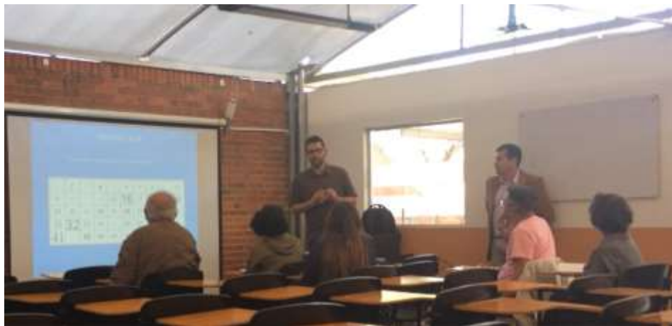
Segunda charla sobre seguridad industrial(Método de las 5 “s”)

Por otro lado se realizó una segunda charla de seguridad industrial en la plaza 4 de la plaza de los artesanos, al igual que la primera charla realizada en el auditorio, se presentó el método de las 5 “s” donde hubo una muy buena interacción entre nosotros los expositores y los artesanos presentes ( VER ANEXO 1 AUDIOVISUALES ).