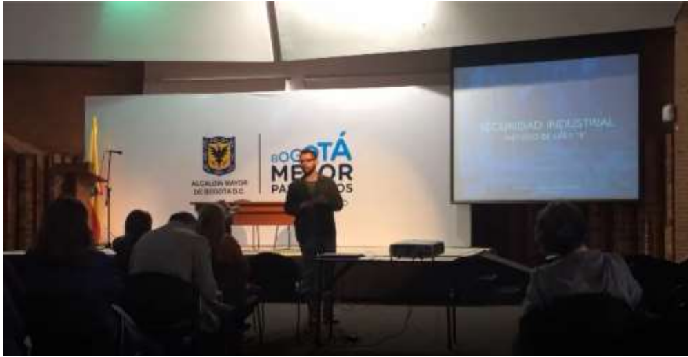
Charla sobre seguridad industrial (Método de las 5 "s") 22 de Noviembre de 2017

Lugar: Auditorio plaza de los artesanos