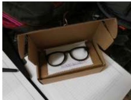
Desarrollo de empaque para gafas en cartón microcorrugado

Se sugirió para este producto la realización de diferentes pruebas de resistencia (golpes, abrasión, torsión, humedad, etc) para garantizar la durabilidad y confiabilidad del producto, fue necesario tocar el tema del empaque pues este fue otra de las falencias que se evidenciaron con respecto al producto, en la actividad desarrollamos un empaque provisional en cartón microcorrugado.