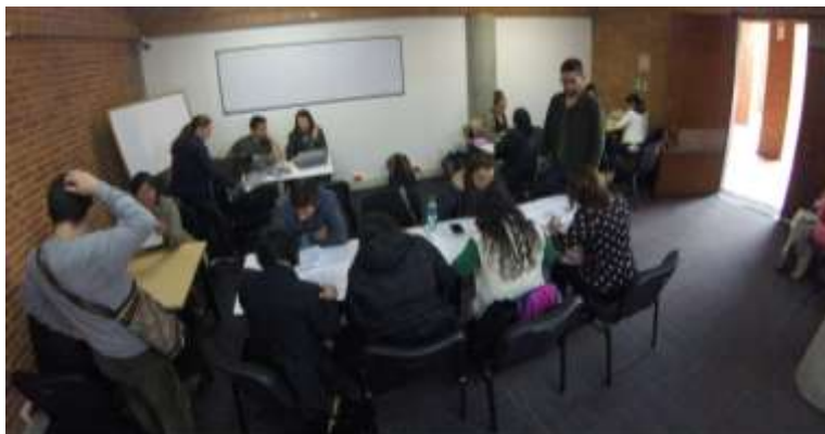
Evaluación de unidades productivas y selección de artesanos para participación en la feria Bogotá Artesanal 12 de Octubre de 2017

El jueves 12 de octubre se realiza una jornada de convocatoria y evaluación de nuevas unidades productivas que desean vincularse al proyecto además de aquellas que no pudieron asistir a la evaluación del día 4 de Octubre.