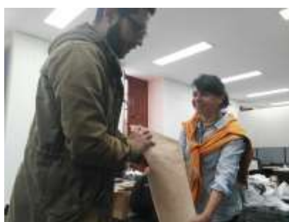
Entrega de materiales a unidades productivas diciembre 18 de 2017 Lugar: Oficinas de Artesanías de Colombia

Expoartesanías da por terminada su edición 2017 con un balance muy positivo en lo que a ventas refiere, el stand del proyecto alcaldía realizó ventas por un total de 51.584.700 millones de pesos, mientras que el stand de laboratorio Bogotá registro ventas diarias de más de 2 millones de pesos agotando casi su stock de productos.