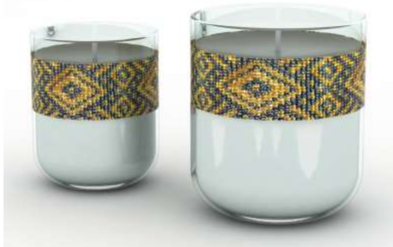
Propuesta de Portavelas en vidrio y chaquiras para feria de Diciembre Render: Manuel Alejandro Posada Ospina Diseño: Samuel López, Lizett Pardo y Manuel Alejandro Posada Ospina

En convenio con el Museo del Vidrio de Bogotá se hace una propuesta de souvenir para la feria de diciembre, la cual consiste en un portavelas de vidrio soplado adornado con un tejido en chaquiras doradas, plateadas y grises, la propuesta de diseño es realizada por los miembros del equipo de diseño de Bogotá Samuel López, Lizett Pardo y Manuel Alejandro Posada Ospina.