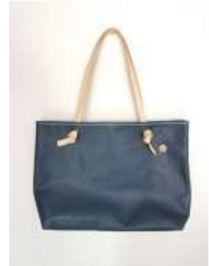
Desarrollo y mejoras en detalles de bolsos Noviembre de 2017