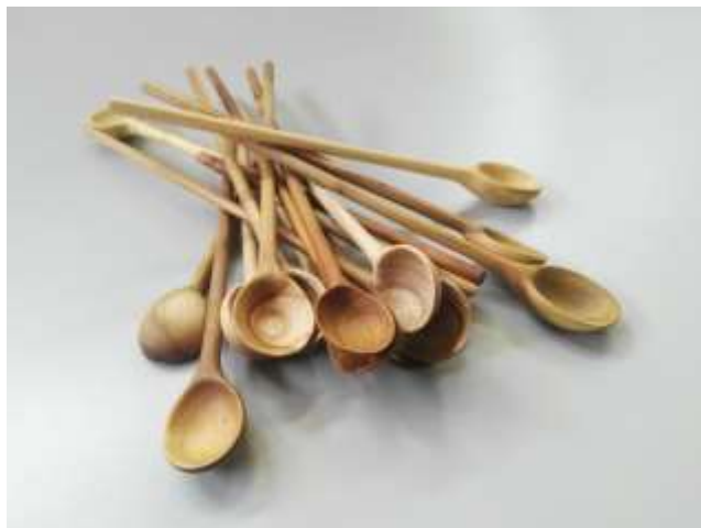
Bandejas para pasabocas en Moho y cucharas en teca para laboratorio Bogotá