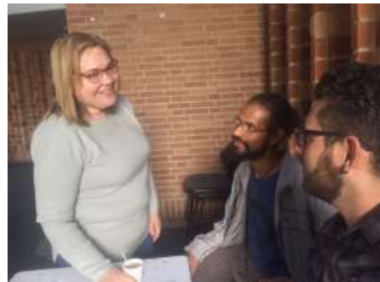
Asesorías con artesanos 17 de octubre de 2017 Lugar: Plaza de Los Artesanos – Auditorio