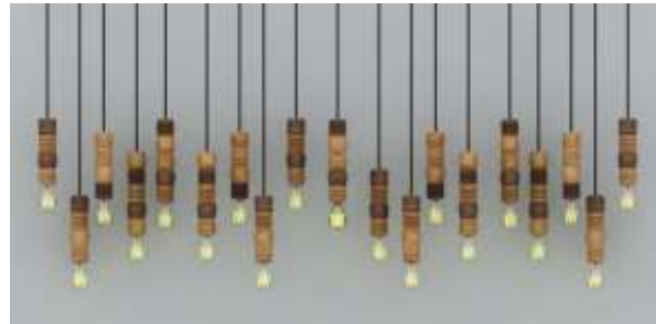
Propuestas de producto "tipi" y primer diseño de lámparas colgantes 27 de Septiembre de 2017 Render y Diseño: Manuel Alejandro Posada Ospina Lugar: Estudio Manuel Alejandro Posada Ospina