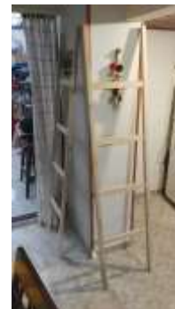
Escaleras para exhibición de producto stand laboratorio Bogotá Expoartesanías 2017

Noviembre de 2017 Lugar: Taller Manuel Alejandro Posada