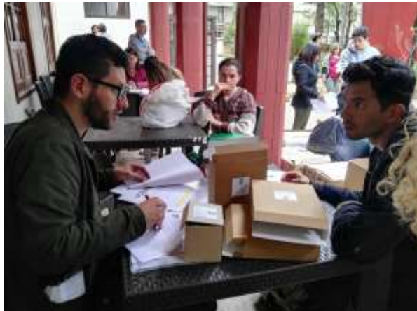
Recepción de producto para el stand de proyecto alcaldía 4 de Diciembre de 2017