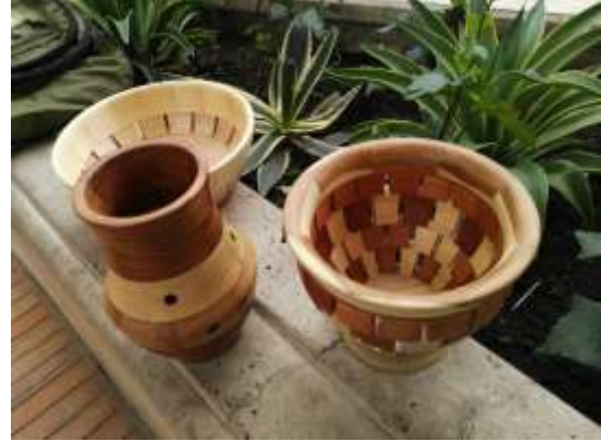
Asesoría Puntual con el artesano Edgar Díaz y algunas de sus piezas.