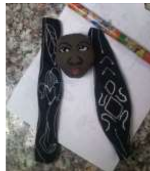
Muestras presentadas por los artesanos en la jornada de asesorías del 12 de Octubre de 2017

Lugar: Plaza de los artesanos – Salon Kogui