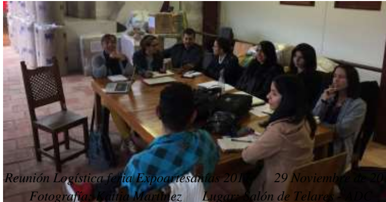
Reunión Logística feria Expoartesanas 2017 - 29 Noviembre de 2017 Lugar: Salón de Telares

Por otro lado se realizó una segunda charla de seguridad industrial en la plaza 4 de la plaza de los artesanos, al igual que la primera charla realizada en el auditorio, se presentó el método de las 5 “s” donde hubo una muy buena interacción entre nosotros los expositores y los artesanos presentes ( VER ANEXO 1 AUDIOVISUALES ).