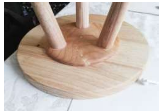
Prototipos de Centro de mesa y mesa auxiliar