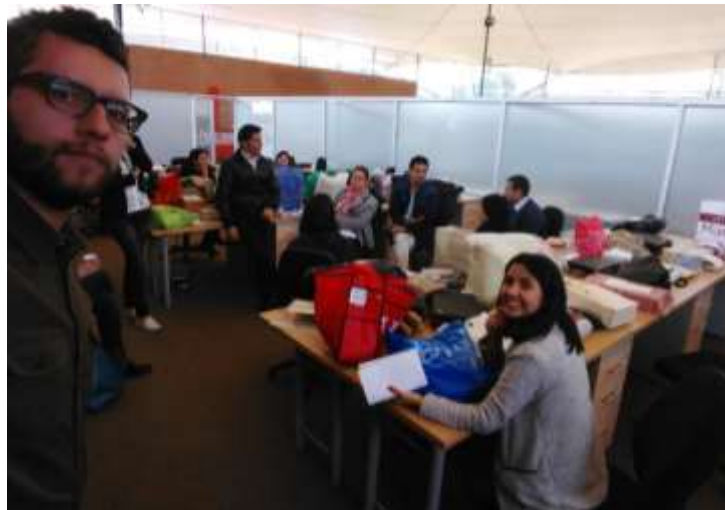
Evaluación y selección de artesanos para participación en la feria Bogotá Artesanal 4 de Octubre de 2017 Lugar: Plaza de los artesanos – Plaza 7

Mientras estas charlas eran realizadas, el equipo de diseñadores llevo a cabo una evaluación de producto, con el fin de seleccionar los cien artesanos que van a ser partícipes de la feria Bogotá Artesanal.