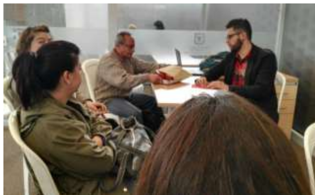
Socialización con artesanos del cuero 28 de Septiembre de 2017 Lugar: Plaza de Los Artesanos – Plaza 7

Para los artesanos vinculados al oficio del cuero, se llevó a cabo una socialización en la cual se hizo revisión de producto y procesos de elaboración de cada uno de los artesanos, también se realizó una breve presentación de inspiración en cuero ( ver anexo 5 ) donde se buscaba que los artesanos abrieran un poco la mente y se dieran cuenta de las posibilidades que tienen para elaborar nuevos productos, optimicen sus procesos y aprovechen al máximo los retales de cuero que se generan durante la elaboración de sus productos.