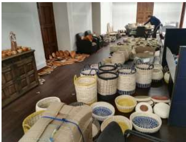
Revisión, ordenamiento y limpieza de producto procedente de diversas regiones de Colombia Noviembre de 2017

La feria de Expoartesanías 2017 estaba cada vez más cerca y cada vez más llegaban productos de todos los rincones donde Artesanías De Colombia tiene presencia, al ser tan grande el volumen de productos que se estaban acumulando, se requirió del apoyo de todo el equipo de diseño para acomodar y revisar los productos de manera que estos no se deterioraran, hubo una especial atención al producto elaborado en madera el cual en muchos casos ingresó a las oficinas de ADC con altos índices de humedad, por lo que fue necesario utilizar varios espacios de las oficinas para remover la humedad acumulada.