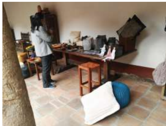
Exhibición de producto para el stand proyecto alcaldía Noviembre de 2017