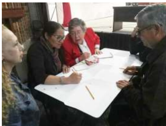
Actividad de selección de referente y diseño por equipos