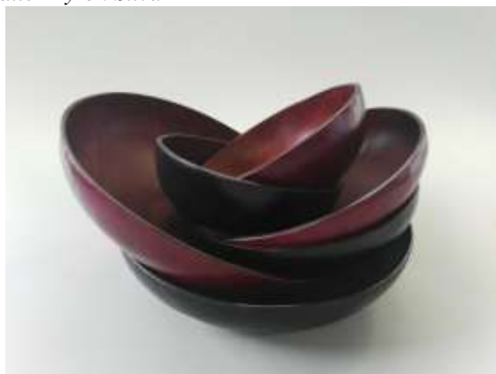
Juegos de cuencos en cuero preformado para laboratorio Bogotá