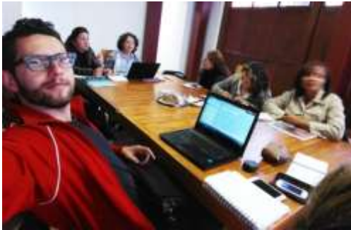
Reunión de equipo de diseño Bogotá 3 de Noviembre de 2017 Lugar: Oficinas ADC Las Aguas