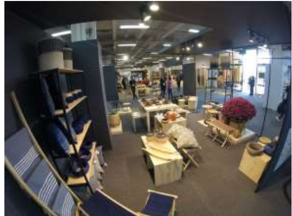
Inicio de Expoartesanías 2017 stand Laboratorio Bogotá y Preview 6 de Diciembre de 2017