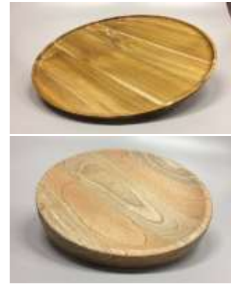
Mesa auxiliar, lamparas colgantes, plato y centro de mesa para laboratorio Bogotá Artesanos: Byron Silva y Mario Barrero Lugar: Oficinas ADC las Aguas

El jueves 16 y viernes 17 de Noviembre se realizaron unas pequeñas sesiones fotográficas de los productos próximos a ser exhibidos en el stand de laboratorio Bogotá, esto con el objetivo de guardar un registro personal de desarrollo de líneas de producto y por supuesto con el fin de compartir dicho material con los propios artesanos y que ellos mismos como unidades productivas, comiencen a generar su propio portafolio de productos y servicios ( VER ANEXO 3 REGISTRO FOTOGRAFICO ).