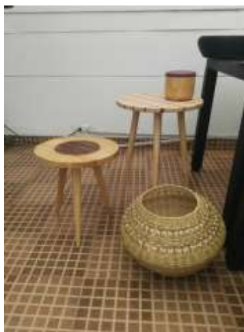
Revisión general de productos para feria de Diciembre 6 de Octubre de 2017 Lugar: Oficinas ADC calle 74