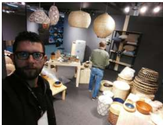
Desmonte de feria y empaque de producto remanente 20 de Diciembre de 2017 Lugar: Pabellón 1-Corferias