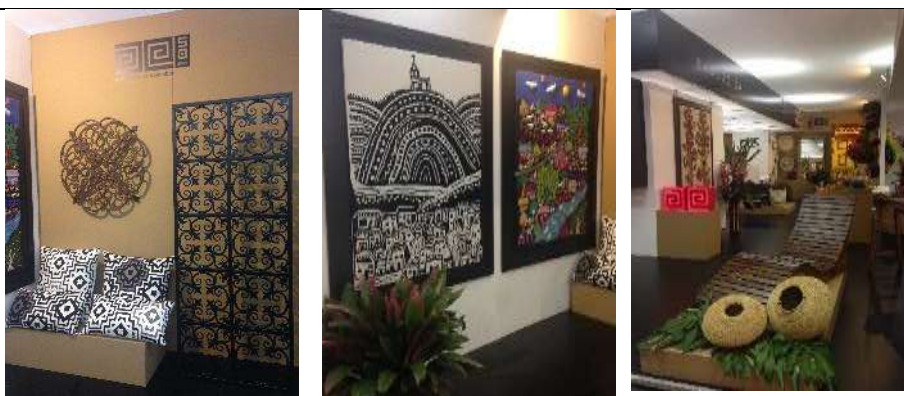
Archivo Fotográfico STAND TRADICION Y EVOLUCION Diciembre 2014