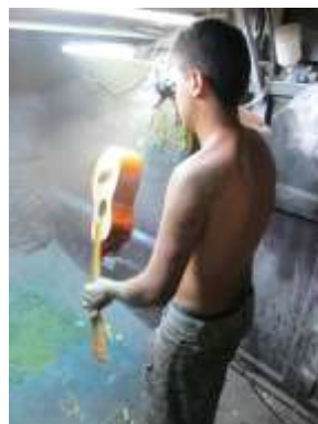
Archivo Fotografico VISITA ARTESANOS CADENA PRODUCTIVA Diciembre 2014