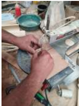
Proceso de Corte Piezas Pinar Pensilvania, Caldas. 2019

En el municipio de Pensilvania se desarrollaron productos para colección nacional con 3 talleres artesanales de trabajo en madera, por lo que se hicieron varias asesorías de asistencia técnica donde se entregaron planos técnicos y plantillas de desarrollo a los talleres, con estos documentos los talleres pudieron tener una mayor precisión de las piezas producidas y se pudieron evitar errores que se habían presentado en producciones de años anteriores.