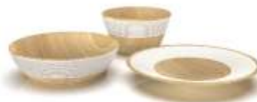
Línea Centros de Mesa Ranurados Madepen Render de Jorge Fuentes. Pensilvania, Caldas. 2019

Anexo 20 Carpeta anexos municipios /Anexo 8: Formato de Bocetos