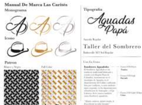
Manual de Marca Aguadas Papá Imagen de Jorge Fuentes. Aguadas, Caldas. 2019 Archivo Fotográfico Artesanías de Colombia