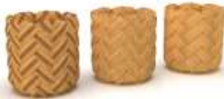
Canastos Calceta de Plátano Render de Jorge Fuentes. Marquetalia, Caldas. 2019

En el municipio de Marquetalia se diseñaron 5 líneas de producto de las cuales 3 se presentaron en comité para colección nacional 2019 de AdC. 2 líneas se diseñaron para mercado local por solicitud expresa de los artesanos, el oficio trabajado en el diseño de estas líneas fue trabajo con calceta de plátano.