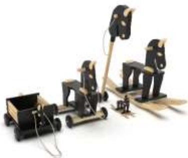
Línea Caballos Maderandia Render de Jorge Fuentes. Pensilvania, Caldas. 2019