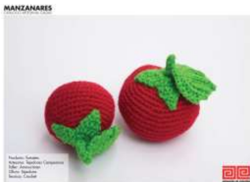
Catálogo de Producto Ammuciman Imagen de Jorge Fuentes. Manzanares, Caldas. 2019 Archivo Fotográfico Artesanías de Colombia

Se desarrolla catalogo digital con algunos productos icónicos del municipio que queda abierto a seguir siendo alimentado de nuevos productos en el futuro.