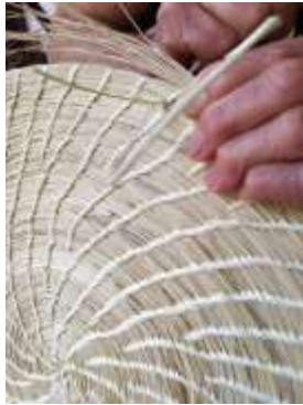
Seguimiento Producción CVDL Aguadas, Caldas. 2019

Se realizan 18 asesorías puntuales de seguimiento a la producción de colección Expoartesanías 2019 con el objetivo de conseguir la máxima calidad y solucionar inmediatamente posibles problemas técnicos que se pudieran presentar durante la producción. Inicialmente se realizó se acompañó a las artesanas tejedoras en la selección de materia prima y revisión de calidad del tejido para los productos, posteriormente se cambiaron materiales que dificultaban la producción de los individuales porque maltrataban las manos de las artesanas y se pasó a fibra de iraca ripeada tradicional, con estos cambios se pudo cumplir con los estándares de calidad y se acordó un precio competitivo de acuerdo a estándares de AdC.