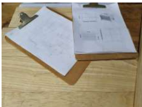
Planos Productos Aprobados Edilsón Castrillón Salamina, Caldas. 2019