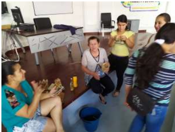
Comunidad de Tejedoras Arreguasca Marquetalia, Caldas. 2019

La población artesanal del Marquetalia es primordialmente rural y aunque algunas de las artesanas viven en el casco urbano la mayor parte de talleres de transformación y recolección de calceta de plátano se encuentran en las veredas. El grupo que se atendió en mayor profundidad fue el enfocado en trabajo con calceta de plátano que se capacito años atrás por medio de SENA sin embargo, este grupo mostro una grave falta de interés y no hay regularidad en el trabajo artesanal que permitiera llegar más lejos con los objetivos propuestos. Las artesanas tienen la artesanía como actividad terciaria que no genera ninguna entrada económica para el hogar por esto hay una gran apatía por parte del grupo en general. Se realizaron asesorías puntuales, talleres, diseño de productos y apoyo comercial.