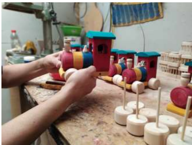
Seguimiento Producción Pinar Pensilvania, Caldas. 2019

La población atendida en Pensilvania es rural y urbana, se realizó convocatoria por medio de contacto directo con los talleres y artesanos que se habían trabajado en proyectos anteriores y adicionalmente se contactó con gesto de la fundación Acceso para convocar nuevos artesanos para talleres práctico - teóricos. En Pensilvania la población atendida está dividida principalmente en talleres de trabajo en madera donde se agrupan varios artesanos y otros artesanos individuales que ejecutan otros oficios y generalmente tiene sus talleres en las casas. Se realizaron asesorías puntuales, asistencias técnicas, talleres, diseño de productos, seguimiento a la producción y apoyo comercial.