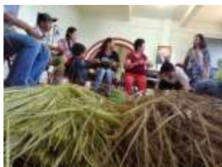
Taller Nuevos Materiales Aguadas, Caldas. 2019

La población atendida en Aguadas es urbana y rural, las convocatorias mediante asociaciones, comercializadores y grupos de trabajo que se contactaron inicialmente para servir como puntos de encuentro para las artesanas y poder trabajar directamente con ellas. Se trabajó con tres grupos principales que fueron, Palmato sombreros, Cooperativa Artesanal de Aguadas y Corporación Virgen de la Loma. Con estos tres grupos se desarrollaron asesorías puntuales, talleres y diseño de producto con todo el proceso que esto conlleva.