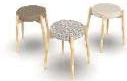
Butacas Iraca Render de Jorge Fuentes. Salamina, Caldas. 2019

En el municipio de Salamina se diseñaron 2 líneas de producto de las cuales 2 se presentaron en comité para colección nacional 2019 de AdC. El oficio trabajado en el diseño de estas líneas fue trabajo en madera con las técnicas de torno, corte y armado.