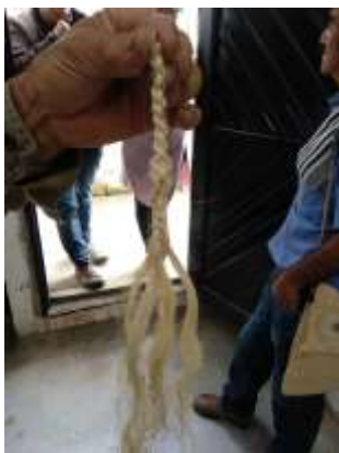
Asesoría Puntal Aránzazu Aránzazu, Caldas. 2019

Se realizaron 24 asesorías puntuales a 11 artesanos en los oficios de trabajo en madera, tejeduría en fique, muñequería, manualidades y tejeduría en hilo. Durante los 5 meses que se visitaron los municipios adicionales se atendieron artesanos en sus talleres artesanales o sedes grupales del municipio.