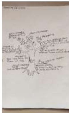
Resultado Taller Identidad y Diferenciación