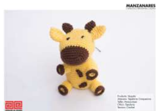
Catálogo de Productos Ammuciman Imagen de Jorge Fuentes. Manzanares, Caldas. 2019 Archivo Fotográfico Artesanías de Colombia