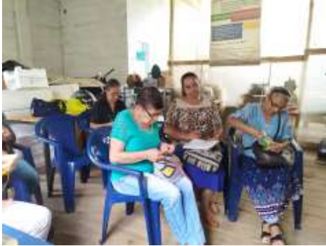
Taller Tendencias y Color Ammuciman Manzanares, Caldas. 2019