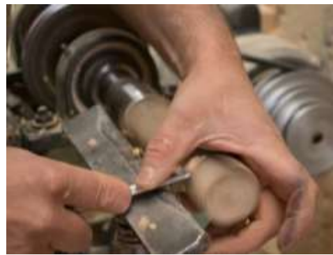
Seguimiento Producción Maderandia Pensilvania, Caldas. 2019