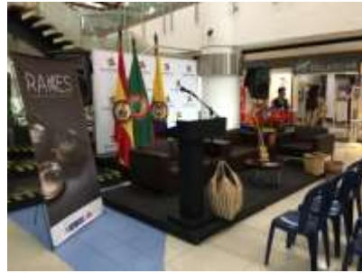
Centro comercial Pereira Plaza Septiembre de 2019