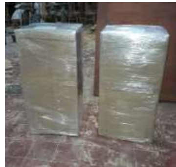
noviembre de 2019 Salamina, Caldas.