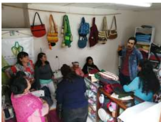
Asesoría Puntal Ammuciman Manzanares, Caldas. 2019

Se realizaron 38 asesorías puntuales a 19 artesanos en los oficios de trabajo tejeduría en hilo y fique. Durante los 5 meses que se visitó el municipio, se atendieron artesanos en las instalaciones de la asociación Ammuciman en asesorías puntuales y talleres.