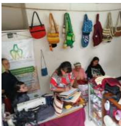
Diagnóstico Inicial Ammuciman Manzanares, Caldas. 2019

La población atendida en Manzanares es de carácter urbano y rural, para convocar las artesanas del municipio se contactó con la líder de la Asociación de Artesanas Campesinas de Manzanares Ammuciman para programar actividades de diagnóstico inicial y de apoyo posterior. Básicamente se atendió una sola asociación en el municipio que trabaja el oficio de tejeduría en hilo y que se compone de alrededor de 22 artesanas de 30 a 65 años de edad. Se realizaron asesorías puntuales, talleres, diseño de productos y apoyo comercial