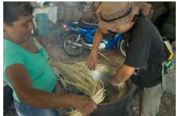
Asesoría Puntal CISLOA Riosucio, Caldas. 2019