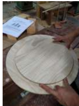
Seguimiento Producción Edilsón Castrillón Salamina, Caldas. 2019