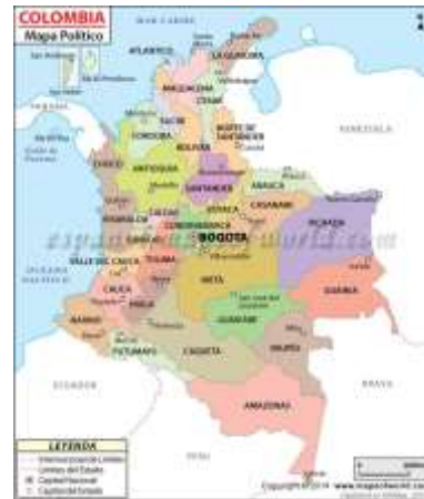
Mapa para ubicación geográfica Nacional