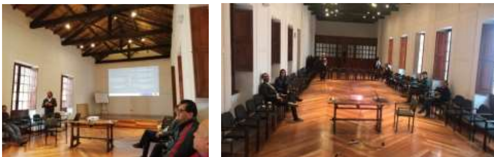
febrero de 2019 Claustro las Aguas

En el mes de febrero del 2019, en las instalaciones de Artesanías de Colombia se llevó a cabo la jornada de inducción frente a las directrices de la entidad para el desarrollo de proyectos y Alianzas en cada uno de los Departamentos, en dicha jornada los diferentes programas de Artesanías de Colombia, realizaron una exposición sobre los alcances de cada una del área y la forma en que deben ser aterrizadas en cada una de las regiones