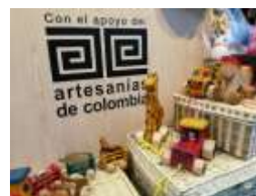
Panaca Octubre de 2019