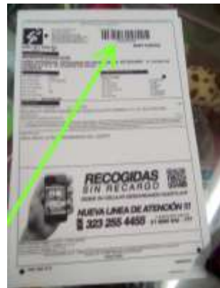
Productos Listos Para Envío CISLOA