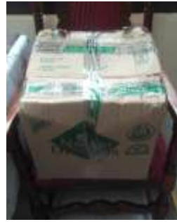
Embalaje Productos CVDL Aguadas, Caldas. 2019