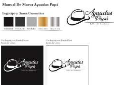
Manual de Marca Aguadas Papá Imagen de Jorge Fuentes. Aguadas, Caldas. 2019 Archivo Fotográfico Artesanías de Colombia

Se realiza un apoyo en desarrollo de identidad grafica para el artesano Diego Ramírez, se realizaron varias reuniones para establecer parámetros y requerimientos de la imagen gráfica y el nombre de la marca a utilizar. Finalmente, se le entrego un manual de marca con logotipo, icono, tipografías a usar, patrones y paletas de color. También se apoyó en el proceso de catálogo y fotografía de producto para el municipio, registrando los productos alternativos al sombrero tradicional con mayor impacto comercial de la Cooperativa Artesanal de Aguadas. En total se realizó 1 manual de marca y 1 catálogo de producto.