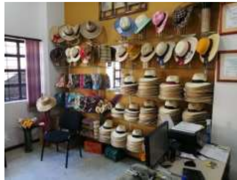
punto de venta Cooperativa artesanal de Aguadas julio de 2019 Aguadas Caldas