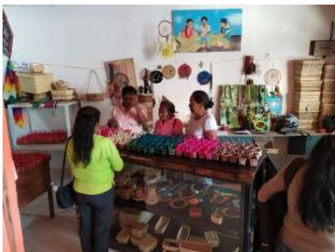
Seguimiento Producción CISLOA Riosucio, Caldas. 2019