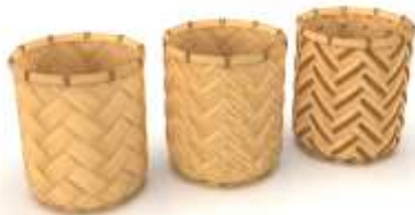
FIGURA 86 Canastos Calceta de Plátano Render de Jorge Fuentes. Marquetalia, Caldas. 2019 Archivo Fotográfico Artesanías de Colombia

De las 5 líneas presentadas para colección nacional de AdC en comité nacional de Artesanías de Colombia, se aprobó una línea de producto. Cabe mencionar que esta línea no se terminó produciendo para Expoartesanías 2019 por que las artesanas no dieron cumplimiento con las condiciones comerciales expuestas por AdC por lo tanto estos diseños se quedaron en aprobación, pero sin producción.