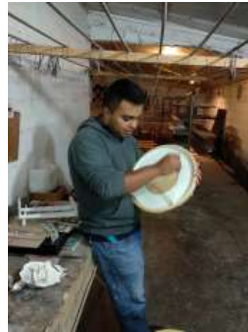
Asesoría Puntal Madepen Pensilvania, Caldas. 2019