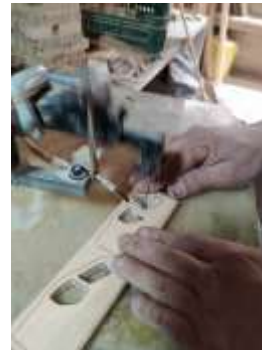
Proceso Corte Piezas Maderandia Pensilvania, Caldas. 2019