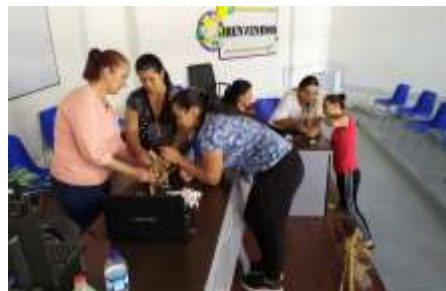
Taller Nuevos Materiales Arteguasca Marquetalia, Caldas. 2019