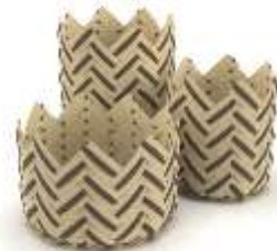
Canastos Picos Calceta de Plátano Render de Jorge Fuentes. Marquetalia, Caldas. 2019 Archivo Fotográfico Artesanías de Colombia