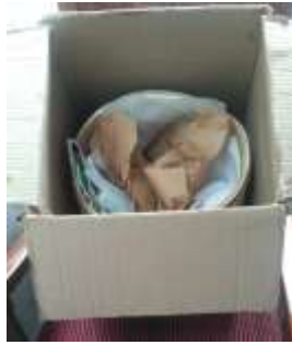
Embalaje Productos CVDL Aguadas, Caldas. 2019