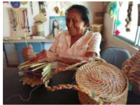
Seguimiento Producción CISLOA Riosucio, Caldas. 2019