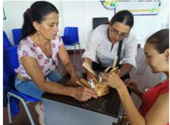
Asesoría Puntal Arreguasca Marquetalia, Caldas. 2019

Anexo 20 Carpeta anexos municipios /Anexo 1: FORCVS02 Asesorías Puntuales 2019