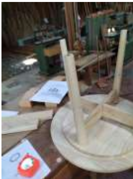
Seguimiento Producción Edilsón Castrillón Salamina, Caldas. 2019

Se realizan 7 asesorías puntuales de seguimiento a la producción de colección Expoartesanías 2019 con el objetivo de conseguir la máxima calidad y solucionar inmediatamente posibles problemas técnicos que se pudieran presentar durante la producción. En el caso de Edilsón Castrillón se le hizo un seguimiento constante, sin embargo, la impuntualidad e irresponsabilidad del artesano no permitió entregar las piezas a tiempo y en condiciones.