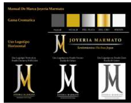
Manual de Marca Joyería Marmato Imagen de Jorge Fuentes. Marmato, Caldas. 2019 Archivo Fotográfico Artesanías de Colombia