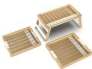
Bandejas Ranuradas Madepen Render de Jorge Fuentes. Pensilvania, Caldas. 2019 Archivo Fotográfico Artesanías de Colombia

Anexo 20 Carpeta anexos municipios /Anexo 9: Fichas de Producto