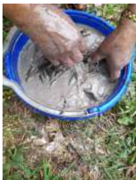
Jornada Tinturado CISLOA