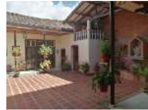
Fundación virgen de la Loma julio de 2019 Aguadas Caldas