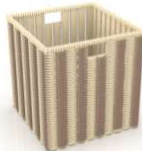
Canasto Caña Brava y Guasca Render de Jorge Fuentes. Riosucio, Caldas. 2019