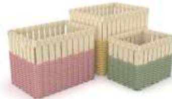
Cestos Organizadores Caña Brava Render de Jorge Fuentes. Riosucio, Caldas. 2019 Archivo Fotográfico Artesanías de Colombia