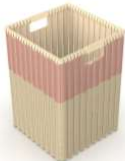
Canasto Rosa Caña Brava Render de Jorge Fuentes. Riosucio, Caldas. 2019

De las 3 líneas presentadas para colección nacional de AdC en comité nacional de Artesanías de Colombia, se aprobaron 3 líneas de producto. Se realizaron algunas correcciones recomendadas por el equipo líder de diseño.