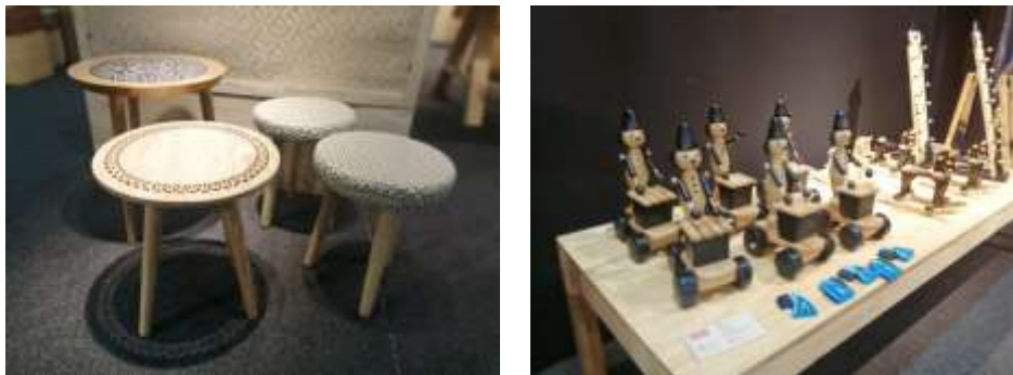
Expo artesanías diciembre de 2019