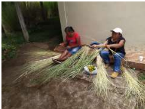
Seguimiento Producción CISLOA Riosucio, Caldas. 2019

Se realizan 30 asesorías puntuales de seguimiento a la producción de colección Expoartesánías 2019 con el objetivo de conseguir la máxima calidad y solucionar inmediatamente posibles problemas técnicos que se pudieran presentar durante la producción. Inicialmente se acompañó a las artesanas tejedoras en la selección de materia prima y revisión de calidad del tejido para los productos, se realizaron correcciones sobre dimensiones, remates, color y en posteriores visitas se revisó que estas correcciones estuvieran ajustadas. Se dio un apoyo constante durante la producción para prolongar tiempos de entrega ya que la comunidad no pudo cumplir con los propuestos inicialmente por mal tiempo y dificultades en la consecución de material. Se hicieron ajustes de precios teniendo en cuenta que en el año 2018 se desfasaron los costos de transporte y las artesanas se vieron muy afectadas por estos costos descontados a su trabajo.