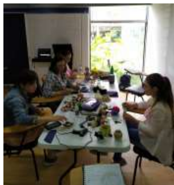
Taller Color y Conceptos Básicos Foto de Jorge Fuentes. Taller Nuevos Materiales Foto de Jorge Fuentes.