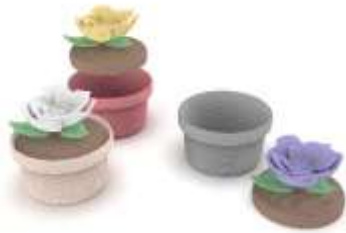
Contenedores Materos Render de Jorge Fuentes. Manzanares, Caldas. 2019