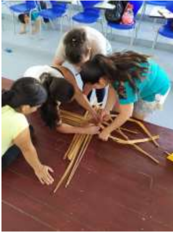
Asesoría Puntal Arreguasca Marquetalia, Caldas. 2019