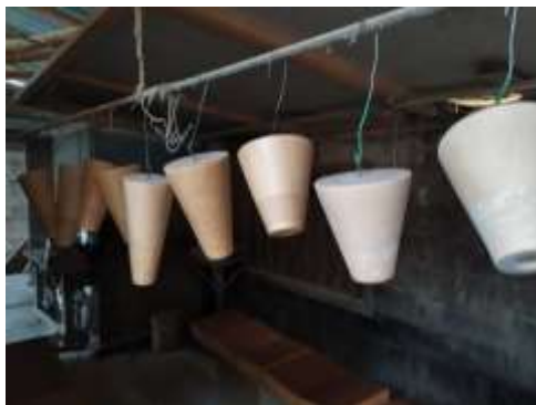
Seguimiento Producción Madepen Pensilvania, Caldas. 2019

Se realizan 9 asesorías puntuales de seguimiento a la producción de colección Expoartesánías 2019 con el objetivo de conseguir la máxima calidad y solucionar inmediatamente posibles problemas técnicos que se pudieran presentar durante la producción. En el caso del pinar se tuvieron que cambiar diseños de dos referencias de producto que por problemas en producción no funcionaban correctamente, con el adecuado seguimiento se logró cambiar el diseño y tener los productos con una gran calidad y diferenciación. En el caso de Madepen se realizaron varias visitas de seguimiento sin embargo el taller tuvo muchos problemas para conseguir materia prima adecuada para producción, por lo que se extendió muchos días la producción de Expoartesánías 2019. Con Maderandia se realizaron varias visitas y no se encontraron problemas en la producción.