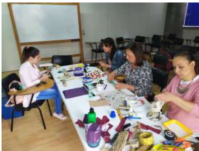
Taller Nuevos Materiales Manizales, Caldas. 2019

La población atendida en Manizales es mayoritariamente urbana y se realizaron convocatorias mediante llamados telefónicos y socialización del proyecto a asociaciones y grupos de trabajos. Adicionalmente los talleres se impartieron en grupos de trabajo como Barrio Amigo de Acopi, Asomarte o Comunidad Indígena Estudiantil Jajetsa Bengbe. También se atendió a muchos artesanos que llegaron directamente al laboratorio pidiendo apoyo en temas específicos.