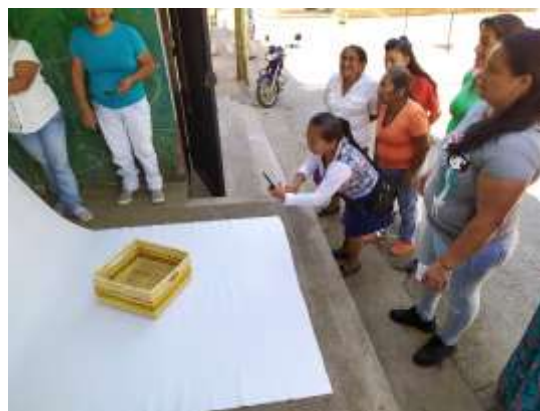
Taller Fotografía de Producto Riosucio, Caldas. 2019