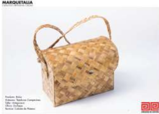
Catálogo de Productos Marquetalia Imagen de Jorge Fuentes. Marquetalia, Caldas. 2019 Archivo Fotográfico Artesanías de Colombia