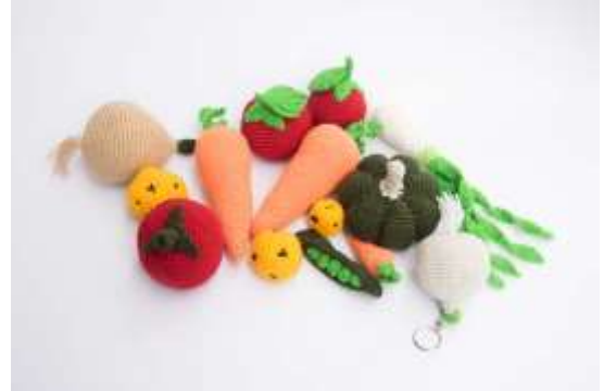
Resultado Taller Fotografía de Producto Foto de Jorge Fuentes. Manzanares, Caldas. 2019 Archivo Fotográfico Artesanías de Colombia