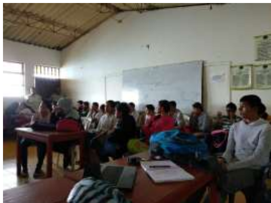
Taller Identidad y Diferenciación

Se impartió 1 taller práctico teórico en el tema de identidad y diferenciación. En total asistieron 16 beneficiarios a este taller.