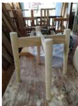
Desarrollo Estructura Butaca Iraca Salamina, Caldas. 2019