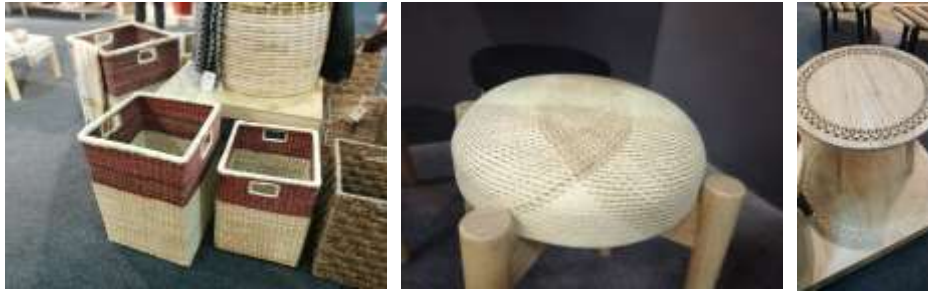
Expo artesanías diciembre de 2019