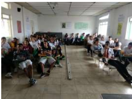
Sensibilización Aprendices SENA Joyería Riosucio, Caldas. 2019

Se impartió 1 taller práctico en el tema de fotografía de producto y una capacitación en sensibilización de diseño. En total asistieron 61 beneficiarios a talleres y capacitaciones en el municipio.