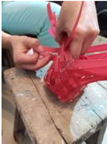
Asesoría Puntal Bibiana Franco Pensilvania, Caldas. 2019