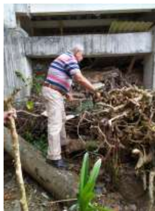
Asesoría Puntual Gerardo Muñoz Neira, Caldas. 2019

Anexo 20 Carpeta anexos municipios /Anexo 1: FORCVS02 Asesorías Puntuales 2019