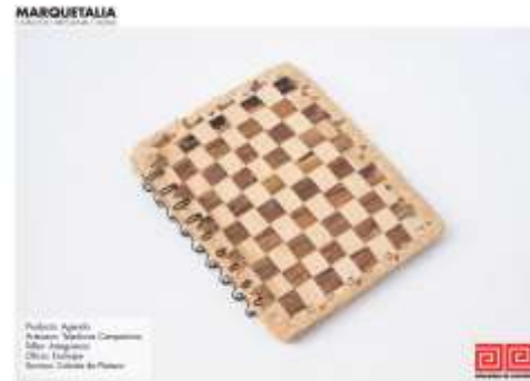
Catálogo de Productos Marquetalia Imagen de Jorge Fuentes. Marquetalia, Caldas. 2019 Archivo Fotográfico Artesanías de Colombia