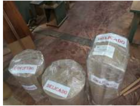
Embalaje Productos Edilsón Castrillón Salamina, Caldas. 2019

Anexo 20 Carpeta anexos municipios /Anexo 13: Guías de Envió y Fotos de Embalaje