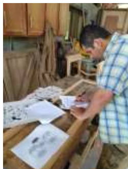
Seguimiento Producción Edilson Castrillon Salamina, Caldas. 2019

puntual, estos artesanos también fueron registrados exitosamente en las bases de datos de AdC.