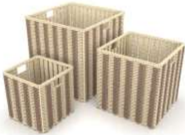
Roperos Caña Brava y Guasca Render de Jorge Fuentes. Riosucio, Caldas. 2019

En el municipio de Riosucio se diseñaron 3 líneas de producto de las cuales 3 se presentaron en comité para colección nacional 2019 de AdC. Los oficios trabajados fueron cestería en caña brava y guasca de plátano. Se diseñaron productos para la comunidad artesanal CISLOA del resguardo indígena San Lorenzo.