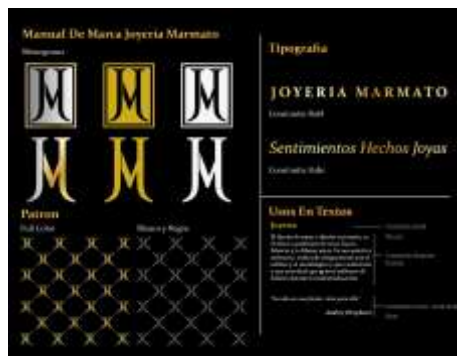
Manual de Marca Joyería Marmato Render de Jorge Fuentes. Marmato, Caldas. 2019

Se apoyó a dos asociados de Asojomar con el desarrollo y actualización en imagen gráfica, realizando manual de marca con logotipo, icono, patrón y paleta de color. Este manual se socializó con el artesano y se explicó su correcto uso para la creación de nuevas piezas gráficas. Adicionalmente a estos artesanos también se les diseño un empaque para joyería y se hizo proceso de cotización con productor de empaques para que el artesano pudiera producirlo sin ningún problema. Finalmente se realiza catálogo digital de productos con algunos de los más significativos del municipio. En total se realizó 1 manual de marca, 1 desarrollo de empaque y un catálogo digital de producto.