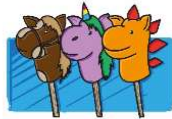
Caballos de Palo Tejidos Render de Jorge Fuentes. Manzanares, Caldas. 2019