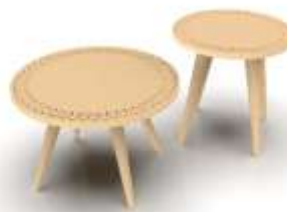
Mesas Caladas Render de Jorge Fuentes. Salamina, Caldas. 2019