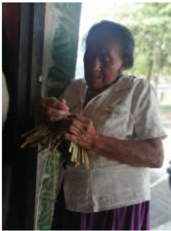
Asesoría Puntal CISLOA Riosucio, Caldas. 2019

Se realizaron 53 asesorías puntuales a 19 artesanos en los oficios de cestería en caña brava, tejeduría en chaquira y rollo en calceta de plátano. Durante los 6 meses que se visitó el municipio, se atendieron artesanos en los talleres en la casa de la cultura del resguardo indígena San Lorenzo donde está la sede principal de la asociación.