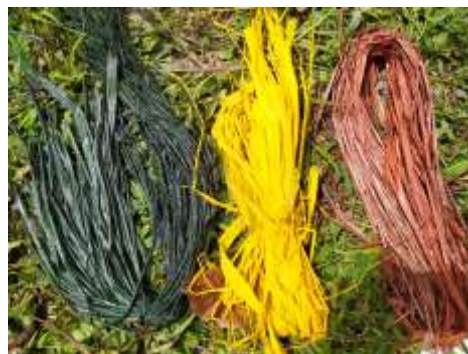
Resultado Tinturado CISLOA