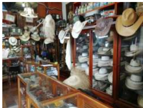
punto de venta de Antonio Hurtado julio de 2019 Aguadas Caldas