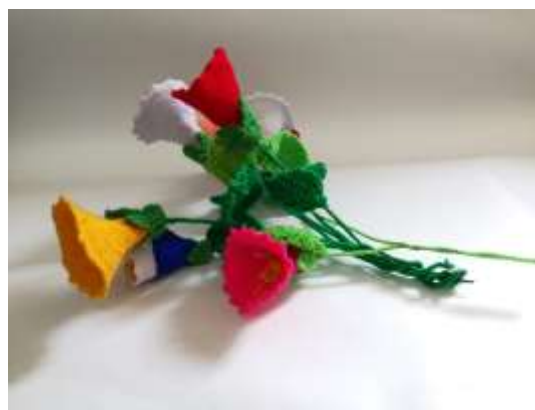
Registro Productos Ammuciman Manzanares, Caldas. 2019

Anexo 20 Carpeta anexos municipios /Anexo 1: FORCVS02 Asesorías Puntuales 2019