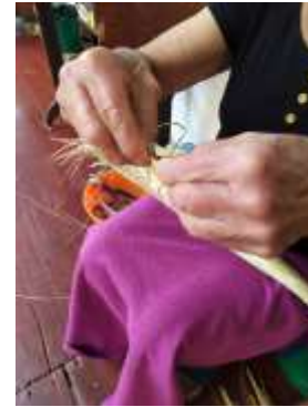
Seguimiento Producción CVDL Aguadas, Caldas. 2019