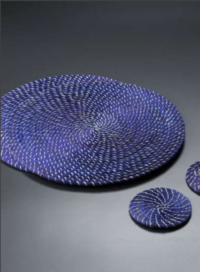
Producto Tradicional – Individuales