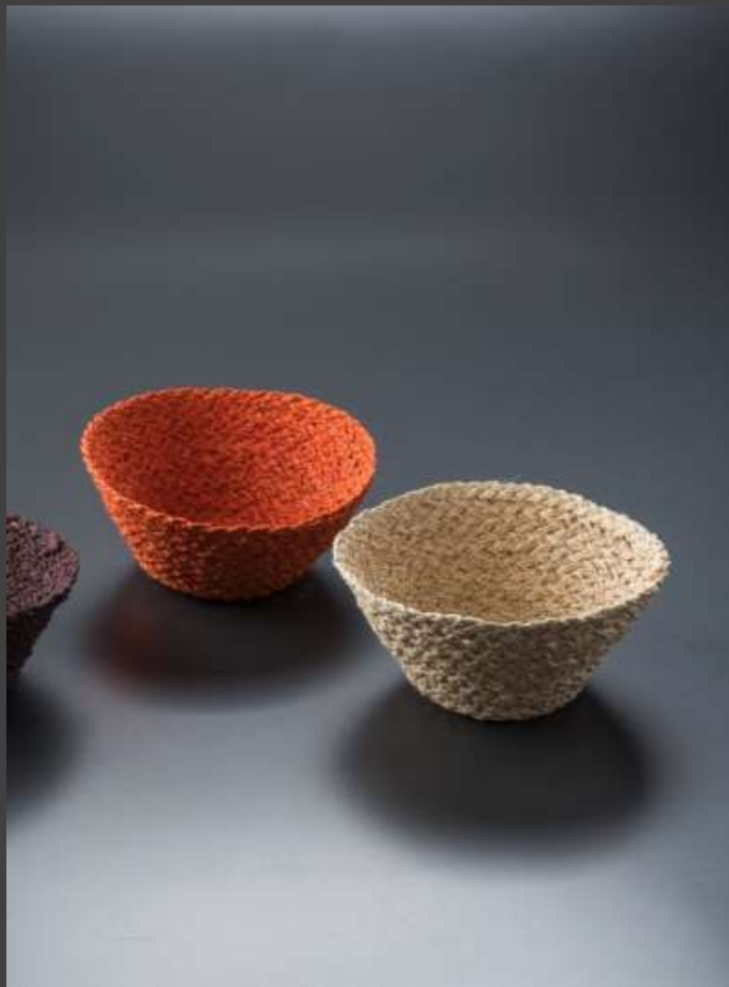
Producto Tradicional – Portacazuelas