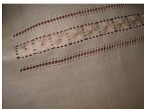
Artesano: Antonio Calderón Producto: Camisas

Se percibió en la artesana la intención de enriquecer el producto con motivos y patrones en secuencia, a través de la técnica del nudo. Se planteó la conveniencia de simplificar formas y la necesidad de aportar funcionalidad al producto con una mezcla de otro tipo de material. Igualmente, se propuso disminuir la saturación y cantidad de color de las superficies y usar menos elementos en las composiciones.