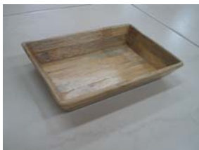
Artesana: Gladys Bueno Producto: Frutero

Productos para caballeros tradicionales, siendo éste su mercado objetivo. Se planteó la posibilidad de buscar mercados juveniles, a través de diseños más acorde con las tendencias de la moda y con apariencia más comercial. Se planteó el uso del color, se enfatizó mucho sobre la manera y la importancia de la confección como componente de diseño y, a su vez, sobre la necesidad de buscar nuevos mercados con aplicación de las técnicas, bordados y calados, en productos diferentes al de moda.