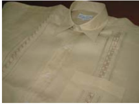
Artesano: Eliseo Gutierrez Producto: Camisas

Productos para caballeros tradicionales, siendo éste su mercado objetivo. Se planteó la posibilidad de buscar mercados juveniles, a través de diseños más acorde con las tendencias de la moda y con apariencia más comercial. Se planteó el uso del color, se enfatizó mucho sobre la manera y la importancia de la confección como componente de diseño y, a su vez, sobre la necesidad de buscar nuevos mercados con aplicación de las técnicas, bordados y calados, en productos diferentes al de moda.