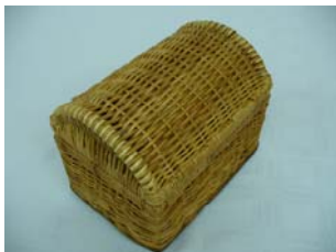
Artesano: Omar Ortíz Producto: Baúl - organizador

Éste, como todos los producto de forma simple, puede hacerse más estético por medio del color, para lo cual no es necesario saturar de esta característica el objeto, sino convertirlo en un acento dentro del mismo, a su vez, es conveniente dejar a la vista el tono natural del material. La función de contenedor puede orientarse hacia un uso más específico, y de esta forma, concebir un producto para un mercado más definido.