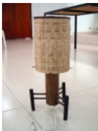
Artesana: Dora Sánchez Producto: Lámpara

Guadua y Guasca. Se encontró ausencia de armonía en el producto. Formalmente hay que buscar integrar mejor cada una de las piezas. El punto de partida es conservar el manejo de ambos materiales, no necesariamente de la técnica. En el caso puntual de la guadua, se puede involucrar el calado y ensamble de piezas. La línea del producto se puede conservar en el tema de iluminación de mesa y se debe entrar a dimensionar mejor el producto.