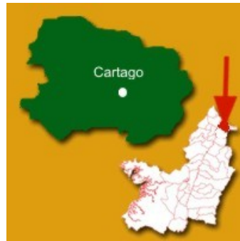
Ubicación de Cartago en el departamento del Valle del Cauca