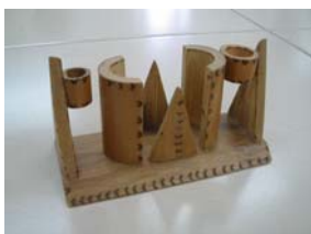
Artesana: Gladys Bueno Producto: Servilletero

Para la elaboración de este producto se utilizó material aglomerado en forma de tablero, para prestar una función de soporte. Sin embargo, no se encontró una buena definición del producto, en su forma, ni espacios para el agarre o sujeción de la pieza. Se hace necesario explorar más la forma del producto y combinar con otros materiales para generar líneas de productos.