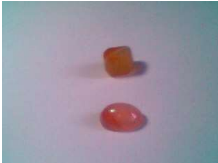
Jaspe rojo, tallada en forma de cabujón ovalado, posibilidades de uso en anillo, broche, etc