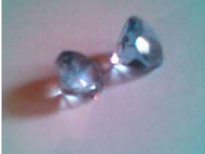
Citrinos tallados en facetas redondas y calibradas, la talla faceteada implica un grado de complejidad mas alto.