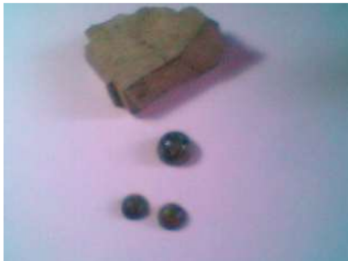
Piedra caliza en bruto y tallada propia de la región, se encuentra en las quebradas y sus alrededores, es una piedra común pero al tallarse puede proporcionar buenas posibilidades, tiene la dureza del mármol.