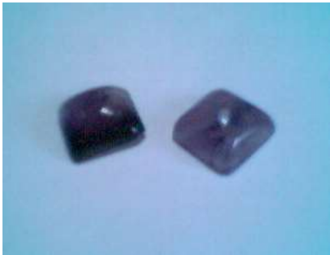
Amatista tallada en cabujones cuadrados