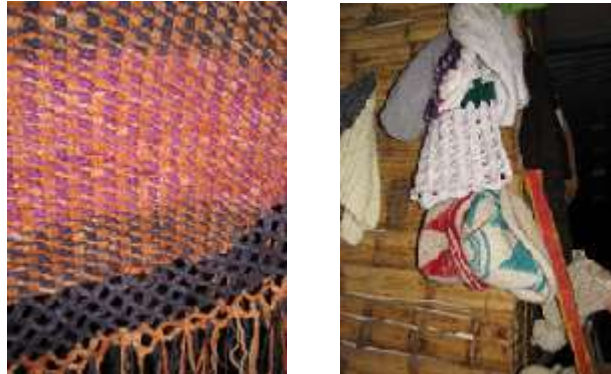
Figura 2. Productos de lanas realizadas por las artesanas de Ráquira. Fotos tomadas por Angélica Suaza, 1 de octubre de 2014. Cedavida-Artesanías de Colombia.

Tinturan sus fibras tanto con productos naturales como industriales y consideran que para trabajar las fibras se deben tener condiciones, incluso de humor, “con la angustia y el afán el esparto no se deja trabajar” 3 .