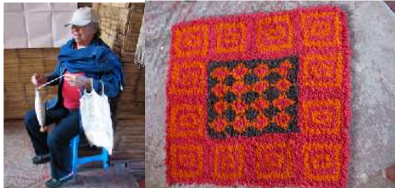
Figura 3. Artesana Ana Betilde Páez hilando y su tapete. Foto tomada por Angélica Suaza, 14 de noviembre de 2014. Cedavida-Artesanías de Colombia