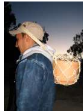
Figura 5. Productos en fique realizados por el artesano Luis Castillo. Fotos tomadas por Angélica Suaza, 16 de noviembre de 2014. Cedavida-Artesanías de Colombia

En Ráquira el fique es utilizado en las fincas para delimitar lotes y también en las orillas de los caminos. Aunque los artesanos están preocupados pues las plantas están siendo rozadas y acabadas, pues la gente dice “que no sirve para nada” 9