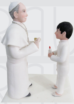
Decoración de pasteles Primeras comuniones