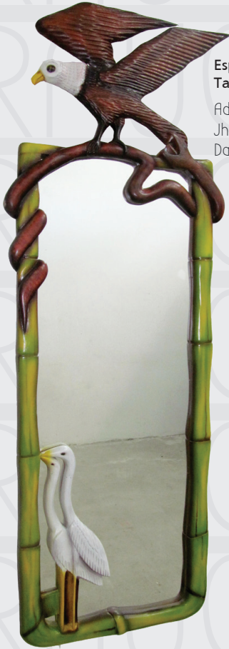
Espejo la caza del águila Talla en madera