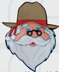
Decoración navideña Papá Noel llanero