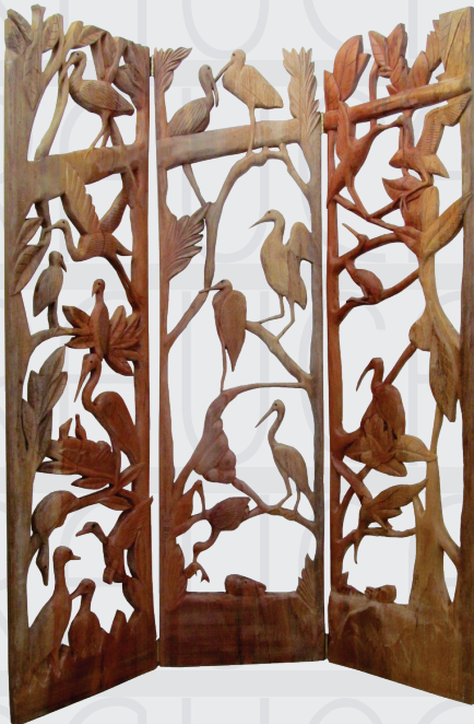
Biombo Garzas y corocoras Talla en madera