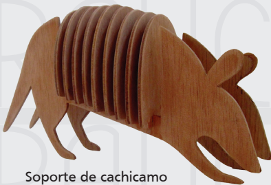
Soporte de cachicamo Calado en madera