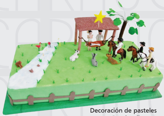
Decoración de pasteles Pesebre llanero