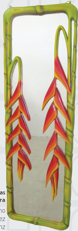
Espejo de Heliconias Talla en madera