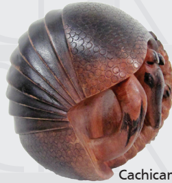
Cachicamo enrollado Talla en madera