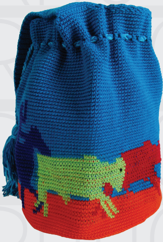
Mochila Trabajo de llano Tejeduría