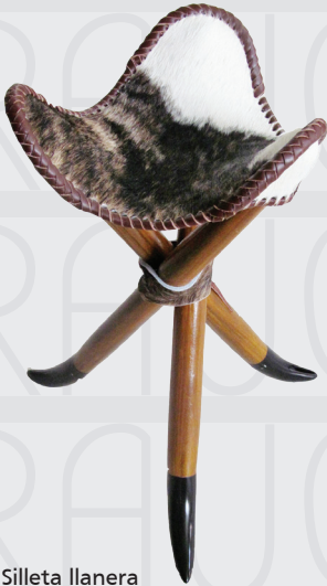
Silleta llanera Torno en madera cacho y cuero