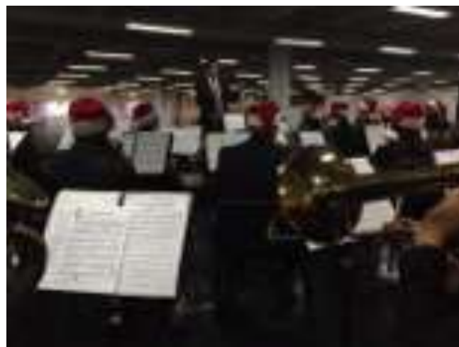
Actividad: Día de Risaralda - Concierto de Navidad Banda sinfónica de Pereira Lugar: Pabellón 1 Corferias Ciudad: Bogotá