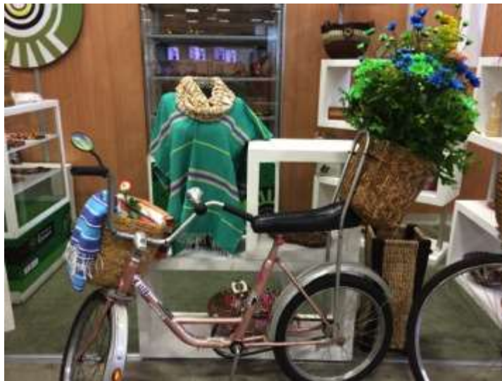
Stand Artesanías de Risaralda Lugar: Expofuturo Fecha: Mayo 15 de 2014 Municipio: Pereira

Fue un espacio atractivo que contó con visita de empresarios, estudiantes y personas del común. Los productos tuvieron muy buena acogida, la actividad promocional fue exitosa. Se trató de un evento promocional y de posicionamiento de marca, no comercial.