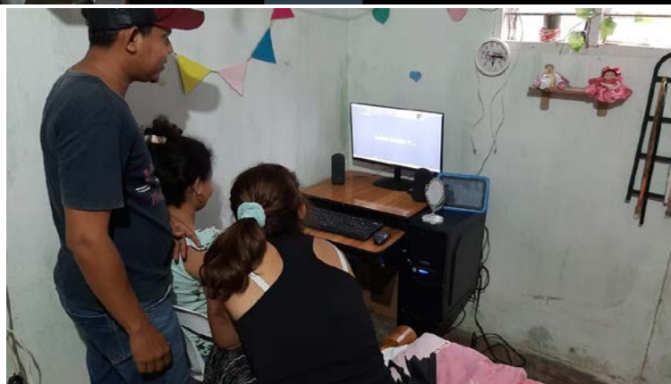
Foto: Taller de fotografía Artesanos de Sampedra conectados al taller. 05/11/2020