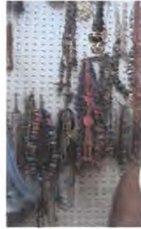
Productos de Bisutería - Referente Cartagena – Bolívar Abril 2006

Bisutería, collares en concha de nácar, perlas, resinas, coco, etc. Este tipo de producto se comercializa mucho hoy en día en la zona, generalmente al por mayor, no se evidencian diseños diferenciados, en su generalidad son collares ensartados.