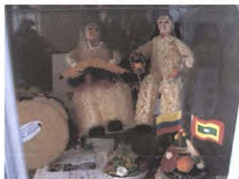
Productos en estropajo - Referente Cartagena – Bolívar Fotos tomadas por: Sandra Helena Uribe Artesanías de Colombia. Abril 2006

Como se aprecia en las fotografías, el producto principal son las muñecas de estropajo con diferentes personajes como: la campesina, la india Catalina, el payaso, los abuelitos, los recordatorios y objetos souvenir.