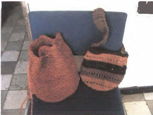
Productos en tejido crochet - Referente Cartagena – Bolívar Foto tomada por: Sandra Helena Uribe Artesanías de Colombia. Abril 2006

Mochilas tejidas en fique con la técnica de crochet.