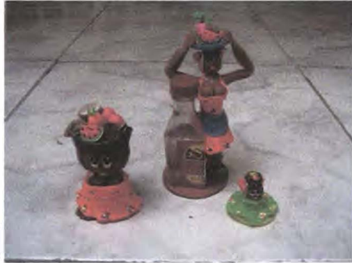
Productos en porcelanigrón - Referente Cartagena – Bolívar Abril 2006

El producto elaborado son las muñequitas chapoleras en porcelanigrón se venden como tipo souvenir en cantidad y a precios muy económicos.