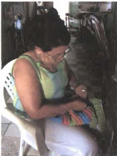
Artesana en su casa – taller en el proceso de elaboración de prototipos Cartagena – Bolívar Foto tomada por: Sandra Helena Uribe . Artesanías de Colombia, Abril 2006