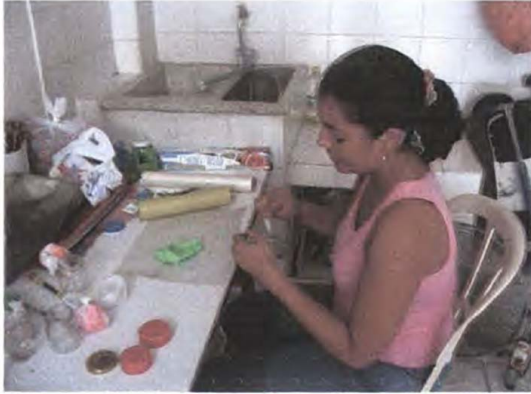
Artesana en su casa – taller en el proceso de elaboración de prototipos Cartagena – Bolívar Abril 2006