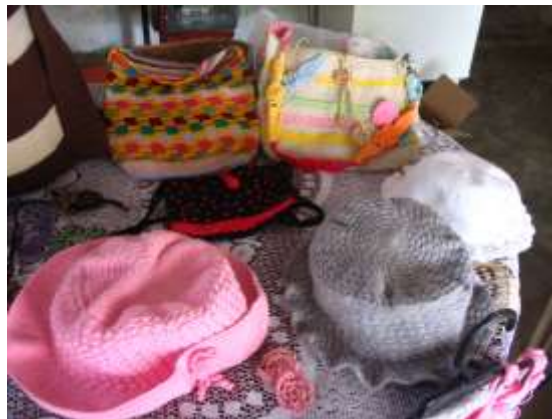
Productos de Tejido en crochet - Referente Talaigua Nuevo – Bolívar

Abril 2006