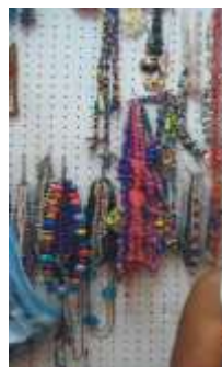
Productos de Bisutería - Referente Cartagena – Bolívar

Abril 2006