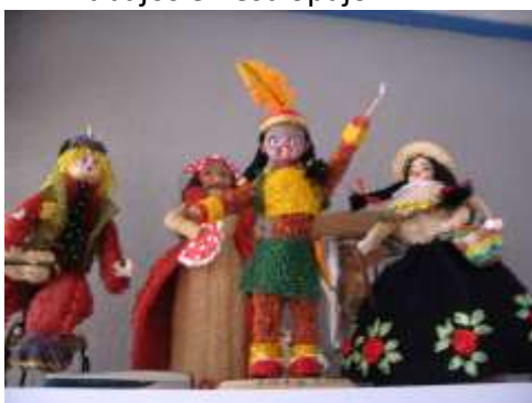
Productos en estropajo - Referente Cartagena – Bolívar