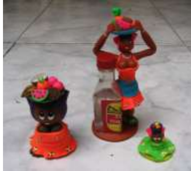
Productos en porcelanicrón - Referente Cartagena – Bolívar Foto tomada por: Sandra Helena Uribe Artesanías de Colombia. Abril 2006

El producto elaborado son las muñequitas chapoleras en porcelanicrón se venden como tipo souvenir en cantidad y a precios muy económicos.