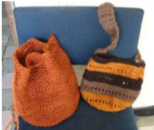
Productos en tejido crochet - Referente Cartagena – Bolívar Foto tomada por: Sandra Helena Uribe Artesanías de Colombia. Abril 2006

Mochilas tejidas en fique con la técnica de crochet. El producto presenta una buena calidad en su elaboración y acabados.