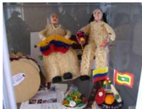
Abril 2006

Como se aprecia en las fotografías, el producto principal son las muñecas de estropajo con diferentes personajes como: la campesina, la india Catalina, el payaso, los abuelitos, los recordatorios y objetos souvenir.