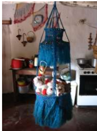
Productos de Tejido en macramé - Referente Talaigua Nuevo – Bolívar Fotos tomadas por: Sandra Helena Uribe Artesanías de Colombia. Abril 2006

El tejido en macramé es el oficio en que trabajan la mayoría de artesanos, éste lo aprendieron hace aproximadamente unos 4 años en una capacitación que recibieron por parte del SENA.