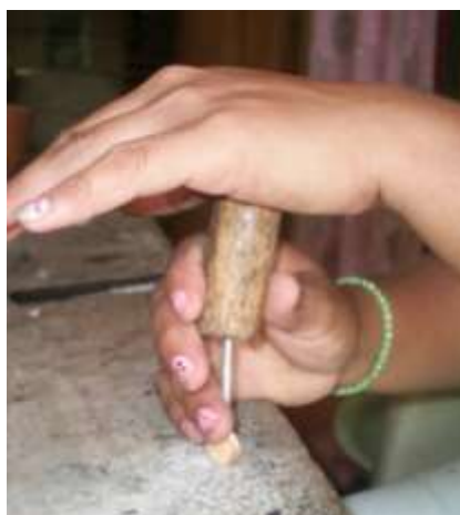
Presión con la mano sobre la herramienta para el perforado

Artesanías de Colombia - Fotografía: Claudia Helena González - Febrero de 2006