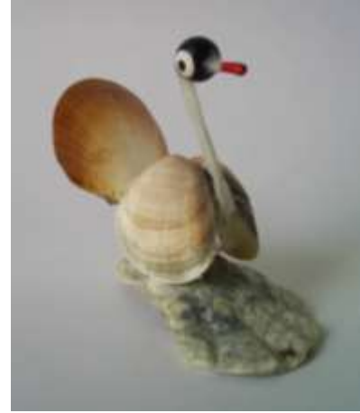
Garza tradicional Artesanías de Colombia Fotografía: Claudia Helena González – Febrero de 2006