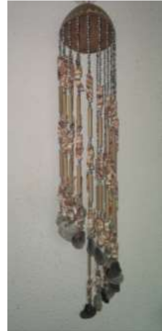
Productos tradicionales Arboletes: Móviles con totumo, bambú y conchas marinas Artesanías de Colombia – Febrero de 2006