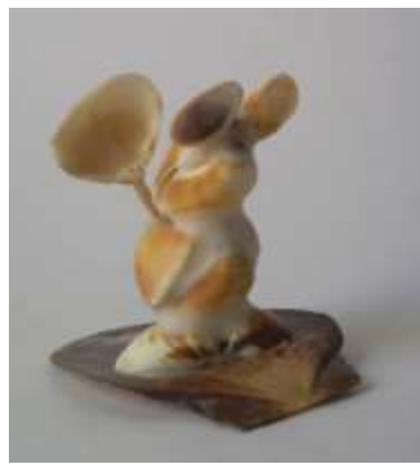
Pieza terminada con adecuado recubrimiento de la masilla y sin excesos Artesanías de Colombia - Fotografía: Claudia Helena González – Febrero de 2006