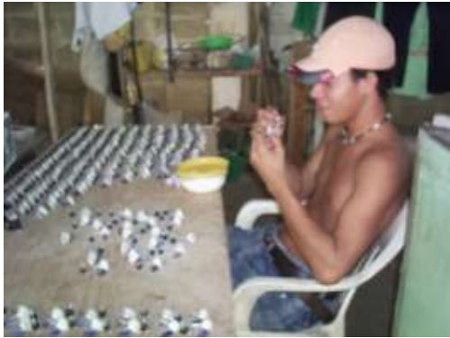
Taller en la cabecera municipal Artesanías de Colombia

Febrero de 2006