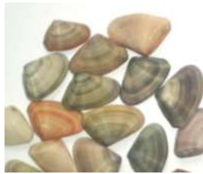
Algunas conchas empleadas en la elaboración de productos - Artesanías de Colombia Fotografía: Claudia Helena González – Febrero de 2006