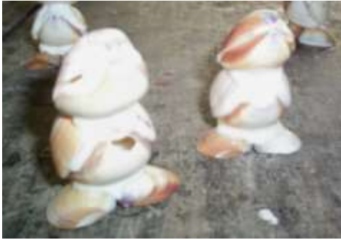
Inadecuado recubrimiento en donde observan espacios vacíos Artesanías de Colombia Fotografía: Claudia Helena González – Febrero de 2006