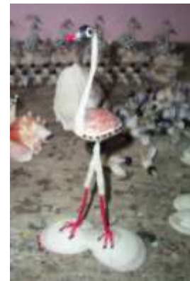
Pieza decorada y “dibujada” con vinilos Artesanías de Colombia – Febrero de 2006