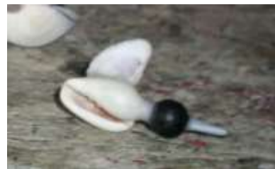
Eliminación de las piedras en el producto Artesanías de Colombia

Fotografía: Claudia Helena González – Febrero de 2006