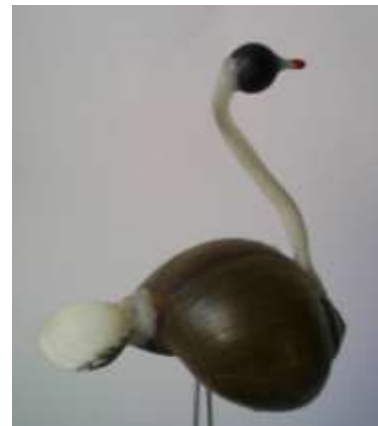
Piezas realizadas durante el proceso de producción observando aspectos de calidad en materias primas y aplicación de masillas Artesanías de Colombia - Fotografía: Claudia Helena González – Febrero de 2006

Proyecto: Diseño e Innovación Tecnológica Aplicados en el Proceso de Desarrollo del Sector Artesanal Colombiano