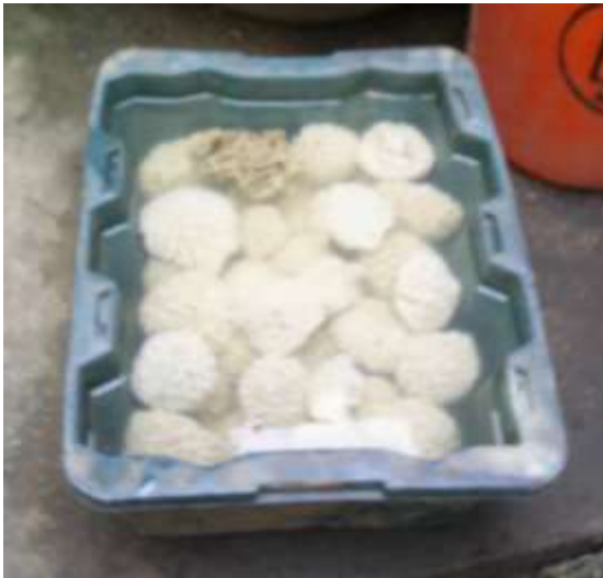
Lavado y blanqueado de materias primas Artesanías de Colombia

Durante estas visitas se realizaron observaciones acerca del buen manejo en las materias primas, las posibles mejoras en el proceso de elaboración de los productos y la calidad final de las piezas.