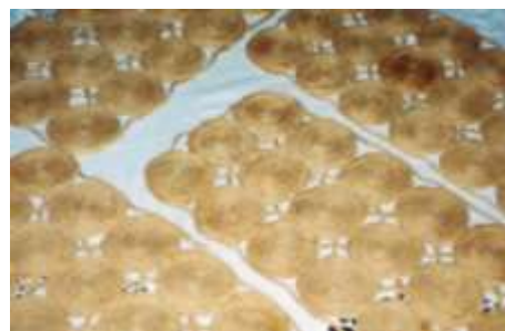
Productos en calceta de plátano Técnica de cestería en espiral Artesanías de Colombia

El oficio más representativo que se tenía por supuesto era el realizado a partir de la calceta de plátano; sin embargo y según se pudo establecer con la asesora que realizó el reconocimiento, la actividad artesanal principal en Arboletes es la del trabajo en conchas. Este dato se confirmó con la Casa de la Cultura de Arboletes, quienes a la vez reconocieron al municipio de Los Córdoba (departamento de Córdoba) como los productores de la artesanía en calceta de plátano.