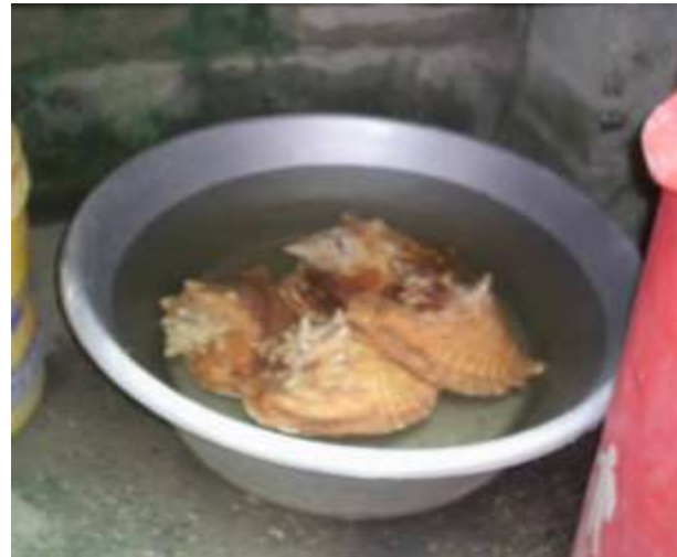
Lavado de materias primas Artesanías de Colombia

Febrero de 2006