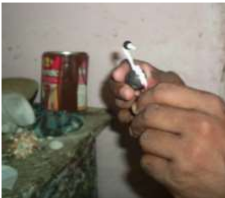
Proceso de elaboración para los productos tipo souvenir Artesanías de Colombia Fotografía: Claudia Helena González – Febrero de 2006

El proceso de producción se realiza en dos etapas: La preparación de la materia prima y la elaboración del producto final. Dependiendo del tipo de producto a realizar, es decir, si es souvenir o móvil, la etapa de armado tiene variación, ya sea por el método de armado y pegado, ó del método de armado y ensartado.