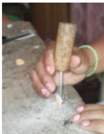
Disposición de la herramienta para la perforación de la concha