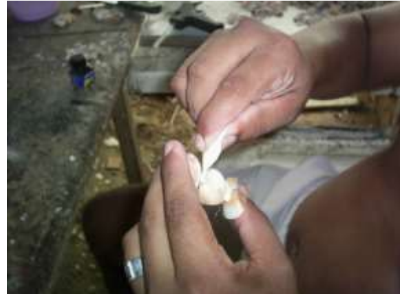
Pulido de conchas (No es frecuente en los talleres) Artesanías de Colombia

Fotografía: Claudia Helena González – Febrero de 2006