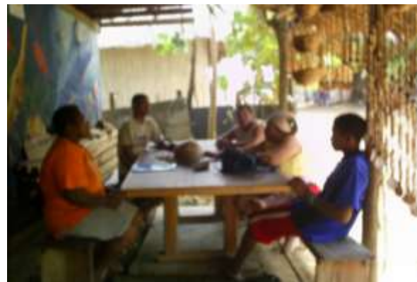
Taller en Río Hobo Artesanías de Colombia Fotografía: Claudia Helena González – Febrero de 2006