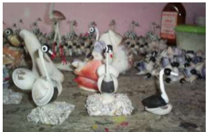
Piezas terminadas y en producción Artesanías de Colombia

Fotografía: Claudia Helena González – Febrero de 2006