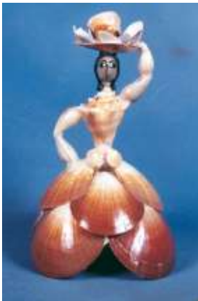
Miniatura en conchas Artesanías de Colombia