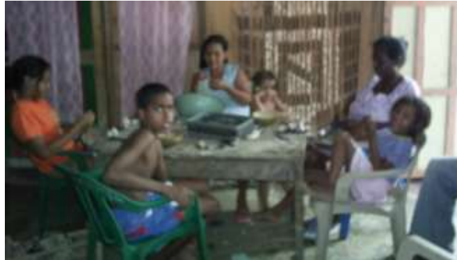
Taller en barrio de la cabecera Municipal Artesanías de Colombia

Febrero de 2006