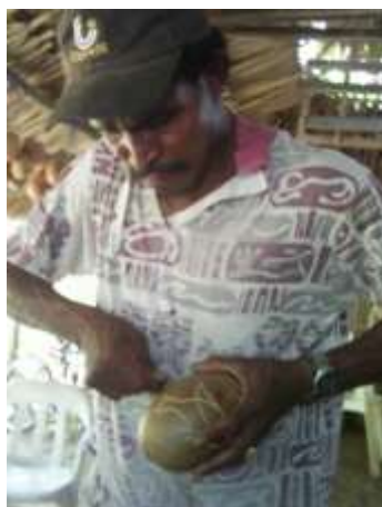
Artesano tallando con cuchillo un totumo Artesanías de Colombia - Fotografía: Claudia Helena González - Febrero de 2006