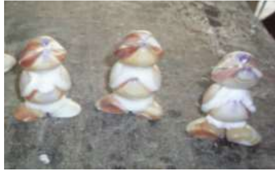
Adecuado recubrimiento de las piezas con masilla Artesanías de Colombia Fotografía: Claudia Helena González – Febrero de 2006