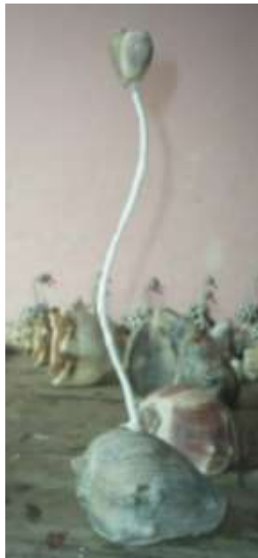
Prueba de nueva propuesta en diseño, de acuerdo a la presentación que se elaboró para la asesoría. Artesanías de Colombia Febrero de 2006