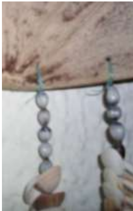
Hilos de nylon sobrantes