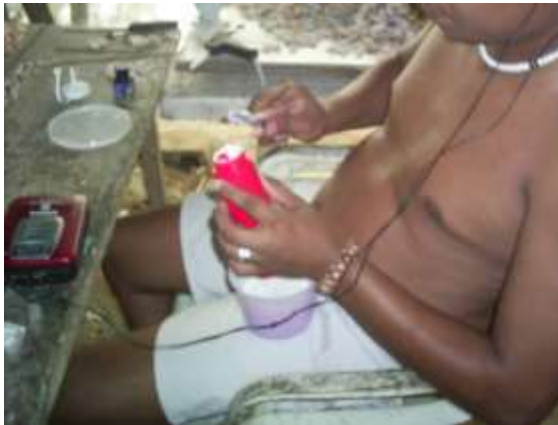
Secado de materias primas sobre zinc Artesanías de Colombia

Fotografía: Claudia Helena González – Febrero de 2006