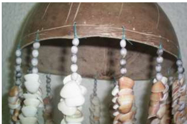
Totumo: Obsérvese las ralladuras hacia el borde