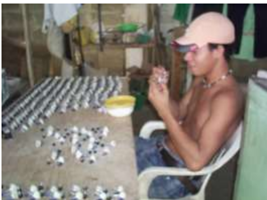
Producción seriada de miniaturas en conchas Artesanías de Colombia