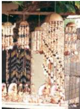
Móviles en conchas Artesanías de Colombia