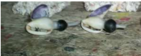
Productos con depósitos de piedras Artesanías de Colombia

Fotografía: Claudia Helena González – Febrero de 2006