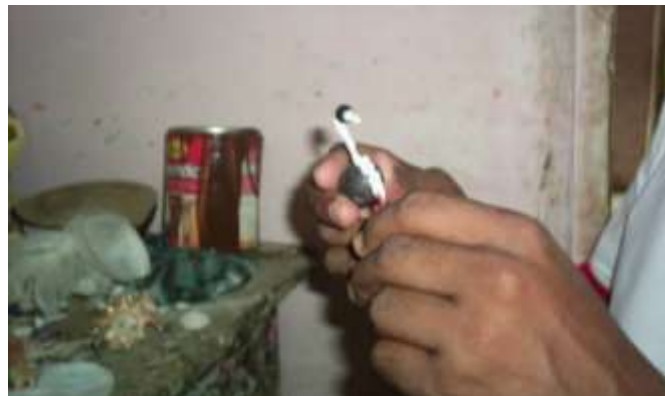
Decoración y pegues con la masilla Artesanías de Colombia

Fotografía: Claudia Helena González – Febrero de 2006