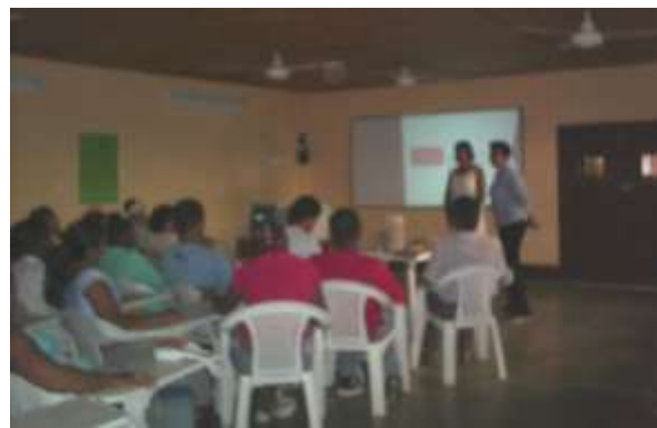
Reunión grupal de socialización en la Casa de la Cultura de Arboletes. Artesanías de Colombia

Febrero de 2006