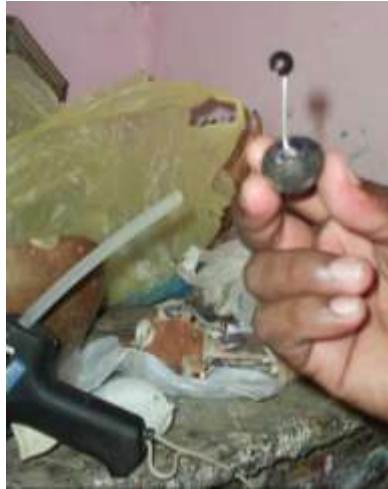
Ensamble de alambre en la garza Artesanías de Colombia

Febrero de 2006