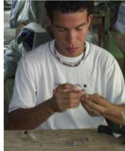
Ensamble de piezas sobre estructuras de alambre y conchas Artesanías de Colombia

Fotografía: Claudia Helena González – Febrero de 2006