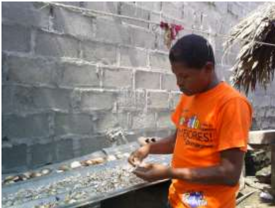
Secado de materias primas sobre zinc Artesanías de Colombia

Febrero de 2006