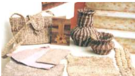
Productos en calceta de plátano Técnicas de cestería de rollo, crochet y papel Artesanías de Colombia