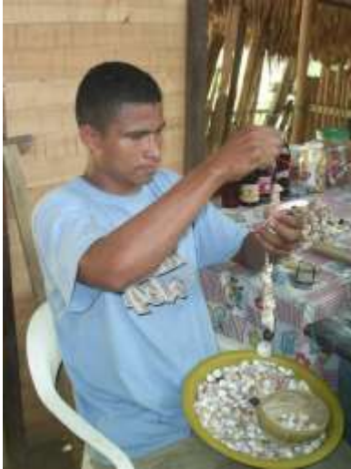
Ensartado de conchas con hilo nylon Artesanías de Colombia

Fotografía: Claudia Helena González – Febrero de 2006