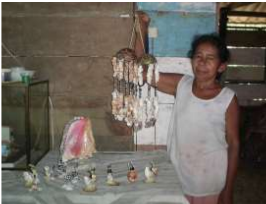
Taller en barrio cercano a la cabecera del Municipio Artesanías de Colombia – Febrero de 2006

Se visitaron diferentes talleres artesanales que tuvieron como objeto reconocer los productos artesanales de los mismos y verificar directamente el proceso en las materias primas, los procesos de producción y los productos finales.