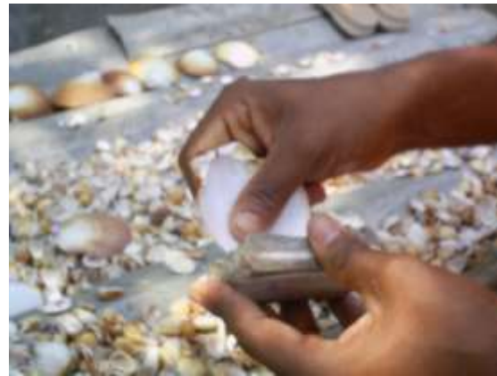
Pulido de conchas (No es frecuente en los talleres) Artesanías de Colombia

Febrero de 2006