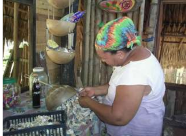
Anudado de tiras de conchas en la base (totumo) Artesanías de Colombia

Fotografía: Claudia Helena González – Febrero de 2006