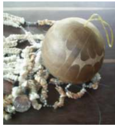
Apariencia final de la pieza antes de corte de hilos

Artesanías de Colombia - Fotografía: Claudia Helena González – Febrero de 2006