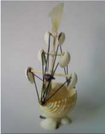
Barco Artesanías de Colombia Fotografía: Claudia Helena González – Febrero de 2006

Se realizó una muestra sobre la línea de souvenir, en donde, para su producción, el artesano tuvo en cuenta varios de los aspectos de calidad que se detallaron para el proceso.