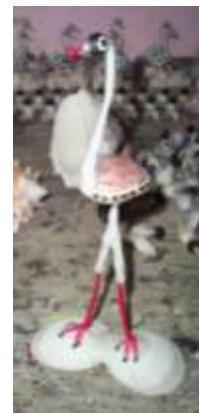
Productos tradicionales Arboletes: miniaturas de animales tipo souvenir Artesanías de Colombia – Febrero de 2006