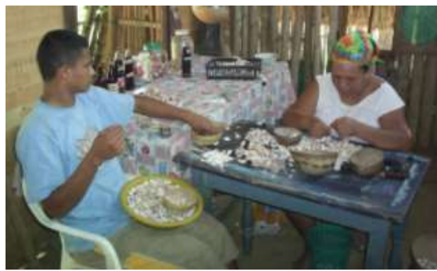
Proceso de elaboración para los móviles Artesanías de Colombia Fotografía: Claudia Helena González – Febrero de 2006