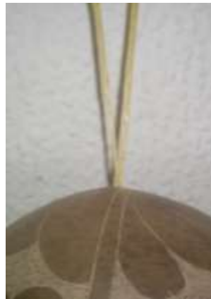
Cuerda para colgar el móvil

Artesanías de Colombia - Fotografía: Claudia Helena González – Febrero de 2006