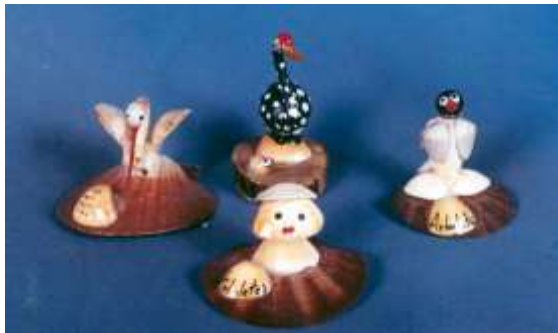
Miniaturas en conchas Artesanías de Colombia

En el municipio de Arboletes se realizó un reconocimiento de los oficios artesanales que en el momento se realizaban en la localidad 2 . Dentro de los oficios se hizo referencia a los trabajos en conchas y en calceta de plátano; estas son algunas fotos de los referentes: