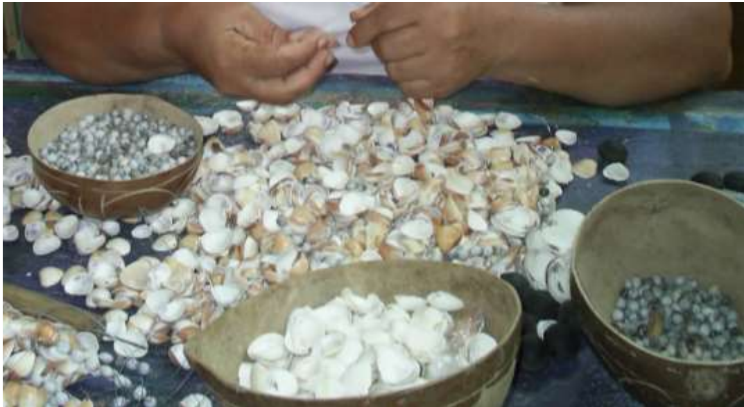
Selección de materias primas y distribución de las misma en diferentes recipientes Artesanías de Colombia

Fotografía: Claudia Helena González – Febrero de 2006