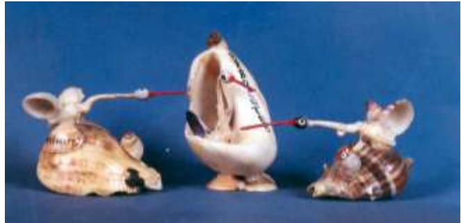
Miniaturas en conchas y caracoles Artesanías de Colombia