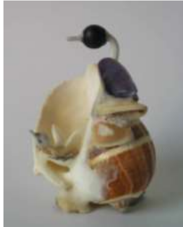
Garza con pichón Artesanías de Colombia Fotografía: Claudia Helena González – Febrero de 2006