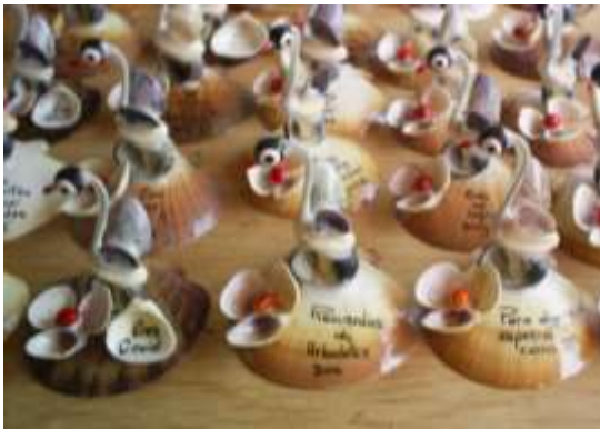
Piezas decoradas con vinilos, tinta china y acabado con laca Artesanías de Colombia – Febrero de 2006