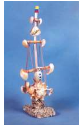
Miniatura en conchas Artesanías de Colombia