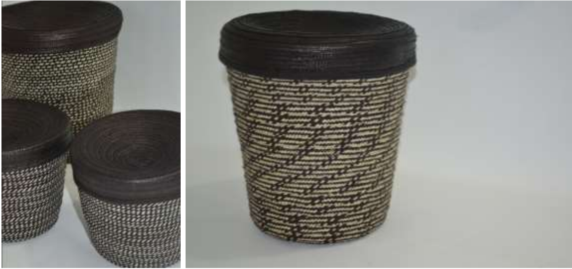
Línea de tarros (diferentes amarres (granito tradicional, caminito, granito de arroz, etc))