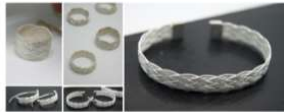
SANTAFE DE ANTIOQUIA, ANTIOQUIA