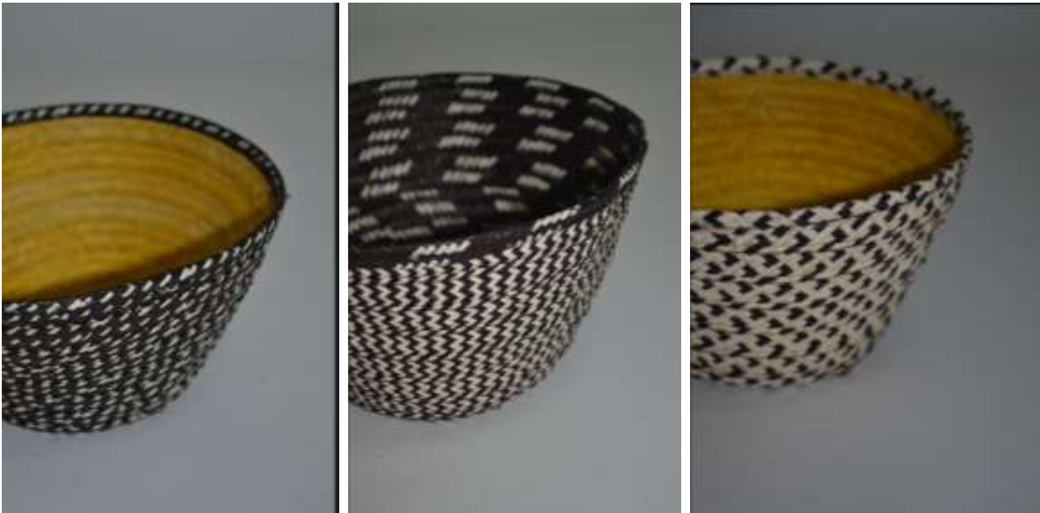
Confiteras doble pared.