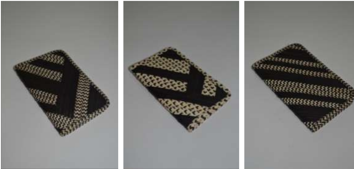
Línea de portadocumentos (diferentes diseños y diferentes amarres)