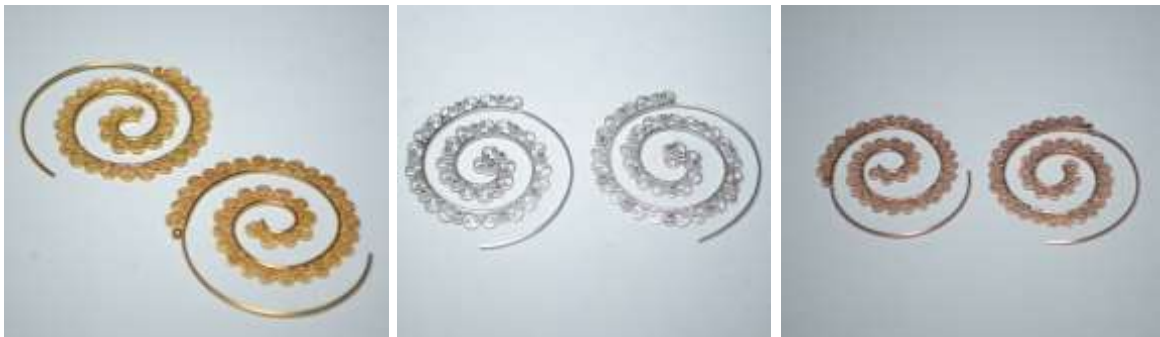
Línea candongas en espiral (diferentes rellenos). Acabado con baño de oro dorado, rosado y plata.