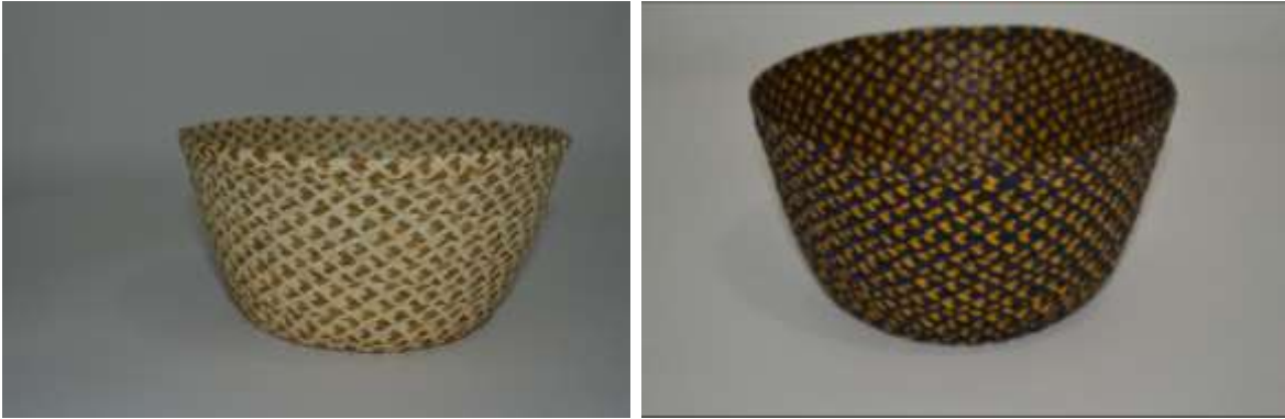
Confiteras sencillas. Rescate de tintes naturales como batatilla, dividivi, mataratón, etc.