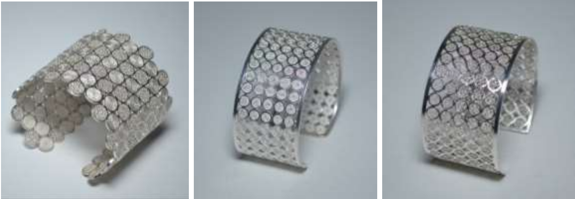
Brazaletes de las diferentes líneas diseñadas.