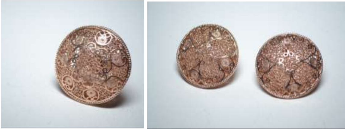
Línea lentejas (anillo y topos). Acabado con baño de oro rosado.