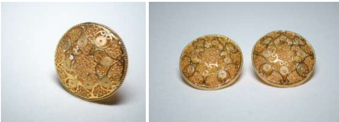
Línea lentejas (anillo y topes). Acabado con baño de oro dorado.