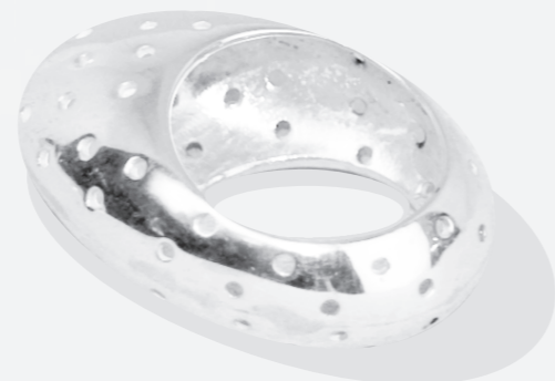
ANILLO NUDO armado Plata 925