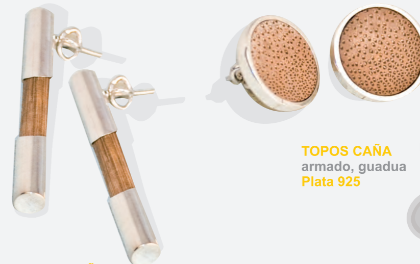
TOPOS CAÑA armado, guadua Plata 925