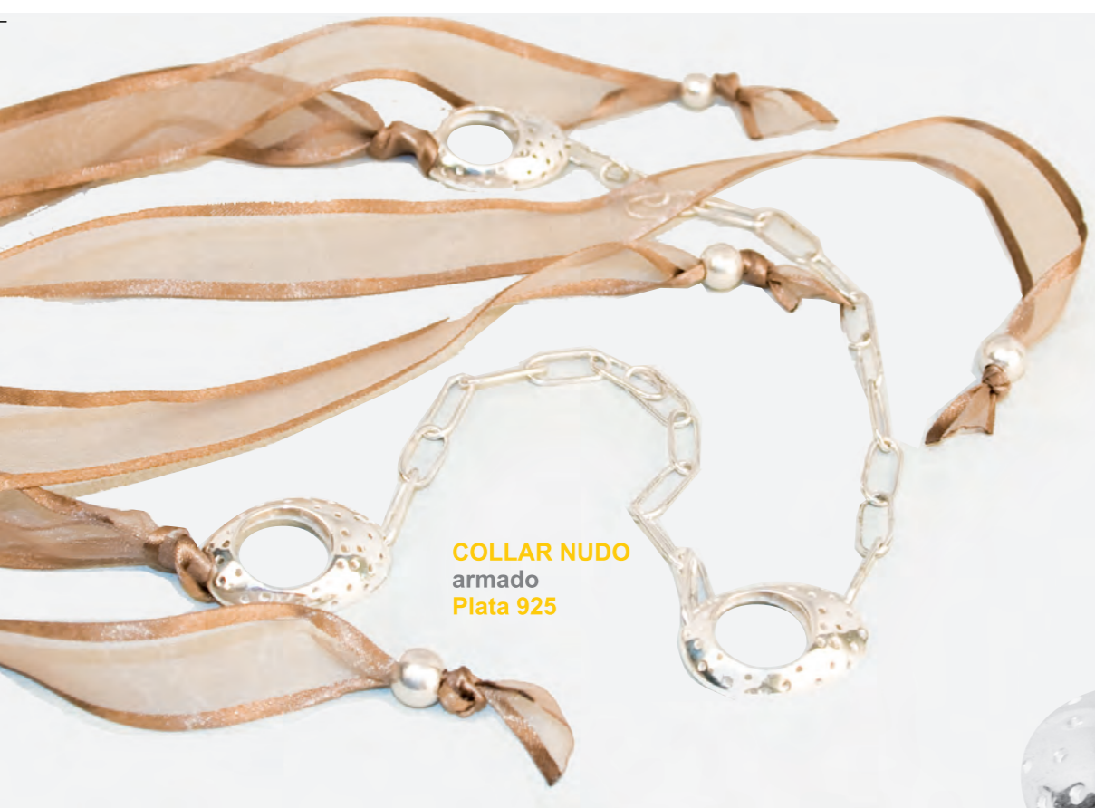
COLLAR NUDO armado Plata 925