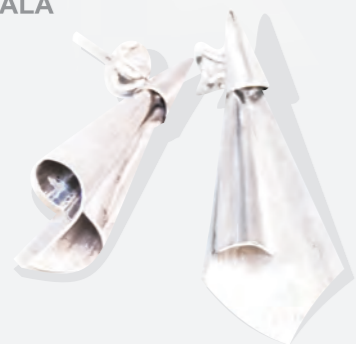
TOPOS MADUALA armado Plata 925