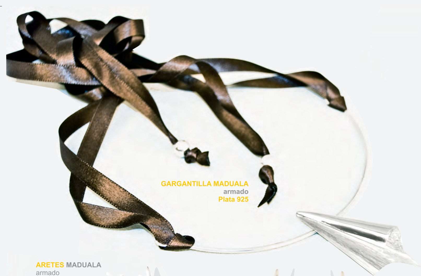
GARGANTILLA MADUALA armado Plata 925