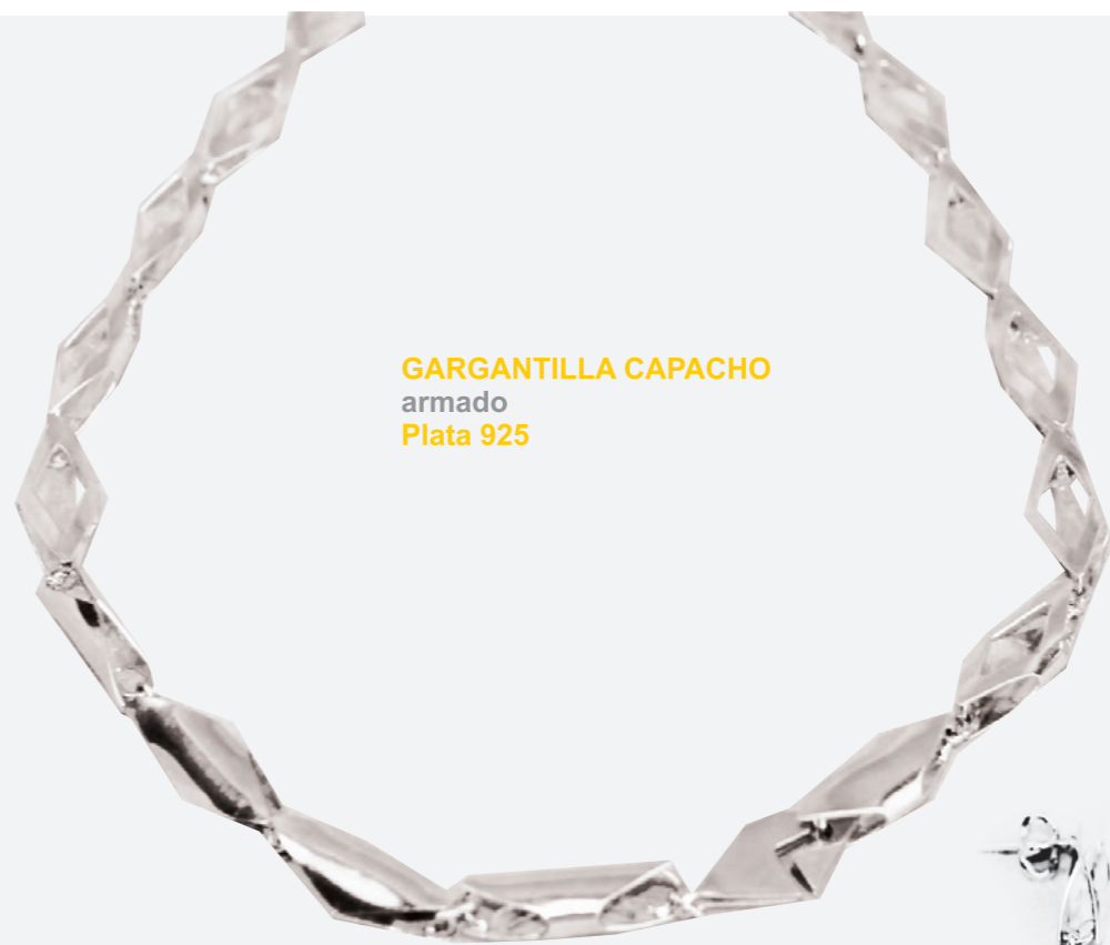
GARGANTILLA CAPACHO armado Plata 925