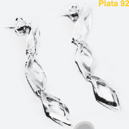
ARETES CAPACHO armado Plata 925