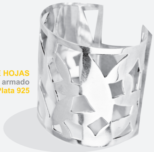
BRAZALETE HOJAS armado Plata 925