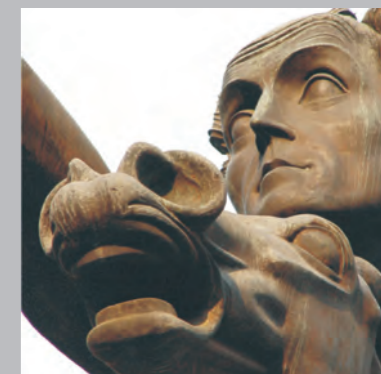
el bolívar desnudo