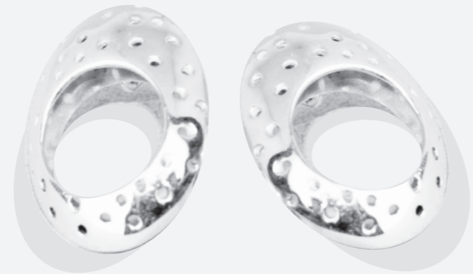
ARETES NUDO armado Plata 925