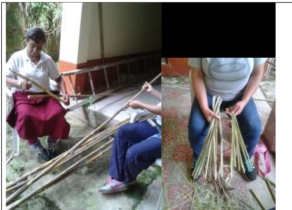
Alistando el chin Tenza – Octubre 2016-

Luego realizar los tejidos con tafetán, asargado diagonal y entrelazado