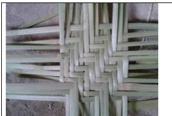
Tejidos Tenza– Octubre 2016