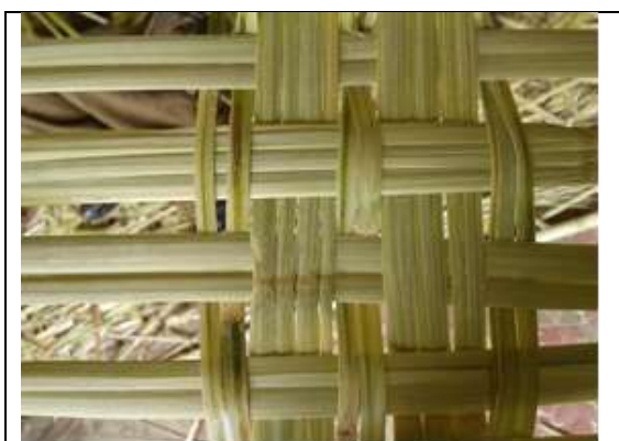
Tejidos Tenza– Octubre 2016