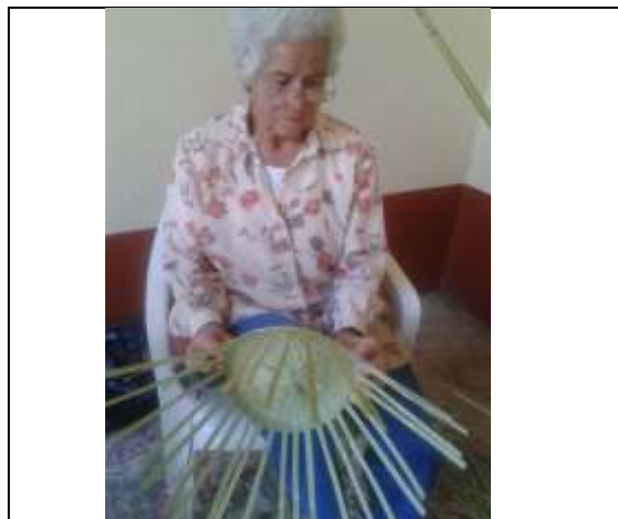
Tejiendo el producto Tenza– Octubre 2016- Foto tomada por Constanza Arévalo Corpochivor – Artesanías de Colombia