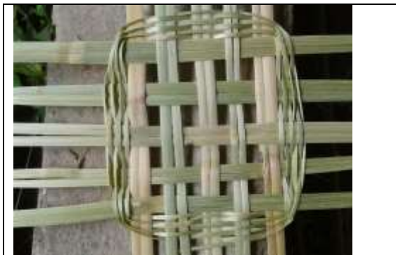
Tejidos Tenza– Octubre 2016- Foto tomada por Constanza Arévalo Corpochivor – Artesanías de Colombia