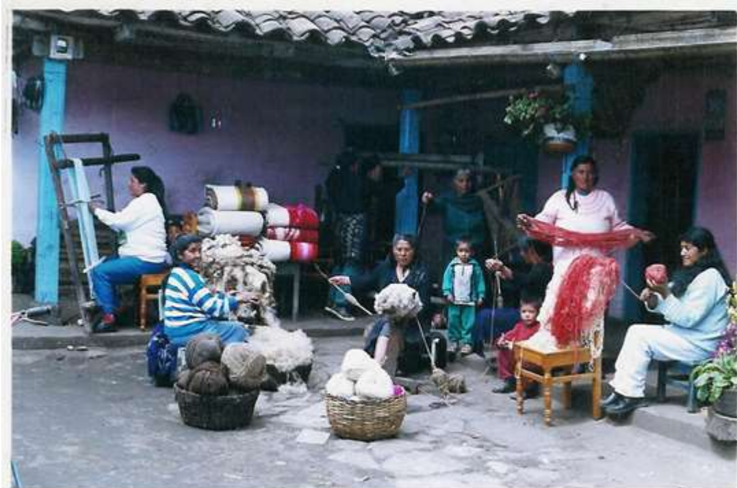
Procesos Oficio de Tejeduría. Guachucal, Febrero 2000. Sonia Calvache – Artesanías de Colombia S.A.