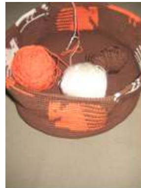
Experimentación - Prototipos. Cumbal, Junio de 2012. Sonia Calvache – Artesanías de Colombia S.A Inicio de mochilas con aplicación de simbologías “Pastos”. Tejido en crochet.