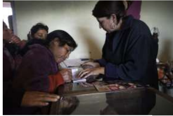
Expoartesanías, Cumbal, Enero de 2013. Eric Bauer – Artesanías de Colombia S.A.

Pago por ventas de productos Expoartesanías 2012.