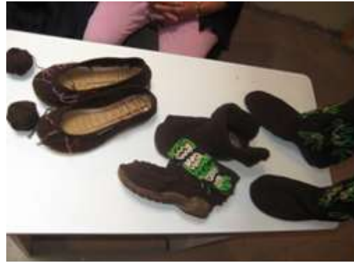
Mezcla de materiales. Cumbal, Julio de 2012. Sonia Calvache Artesanías de Colombia S.A.

Detalle de elaboración de botas, botas niño y zapatos para casa. Línea de accesorios personales. Referente del medio: Cebolla larga. Mezcla de materiales: Hilo guajiro – hilo líder – suelas plásticas – cordones.