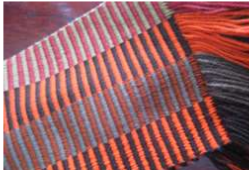
Mezcla de materiales. Cumbal, Julio de 2012. Sonia Calvache Artesanías de Colombia S.A.

Detalle de elaboración de botas, botas niño y zapatos para casa. Línea de accesorios personales. Referente del medio: Cebolla larga. Mezcla de materiales: Hilo guajiro – hilo líder – suelas plásticas – cordones.