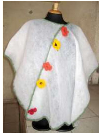
Taller de diversificación. La ruana como identidad. Cumbal, Mayo de 2012. Sonia Calvache – Artesanías de Colombia S.A Aplicación de referentes del medio: amapola – trabajo en grupo.