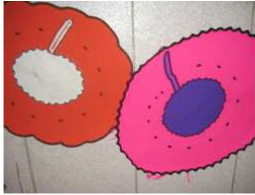
Experimentación - Prototipos. Pupiales, Junio de 2012. Sonia Calvache – Artesanías de Colombia S.A

Cojín piso con aplicación de Referentes del medio - Amapola. Tejido en crochet.