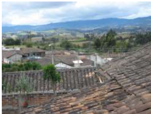
Municipio de Pupiales, Abril 2012. Sonia Calvache – Artesanías de Colombia S.A