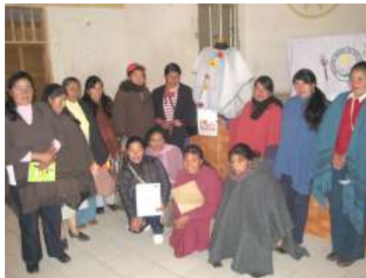
Taller de diversificación. La ruana como identidad. Cumbal, Mayo de 2012. Sonia Calvache – Artesanías de Colombia S.A Resultado final taller.