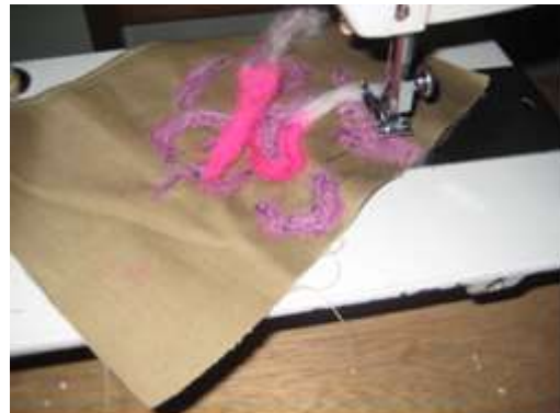
Mezcla de materiales. Cumbal, Julio de 2012. Sonia Calvache Artesanías de Colombia S.A.

Detalle de elaboración tela tejida en guanga. Línea de bolsos, accesorios personales. Referente del medio: Repollo morado. Mezcla de materiales: Hilo guajiro – hilo líder – tela drill – lana natural.