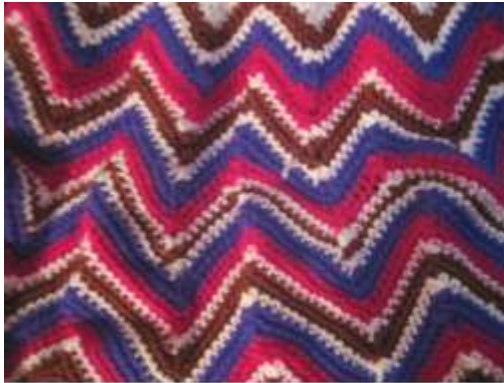
Refajo, tejido tradicional. Pupiales. Julio de 2012.

Cojín piso con aplicación de Referentes del medio - Amapola. Tejido en crochet.