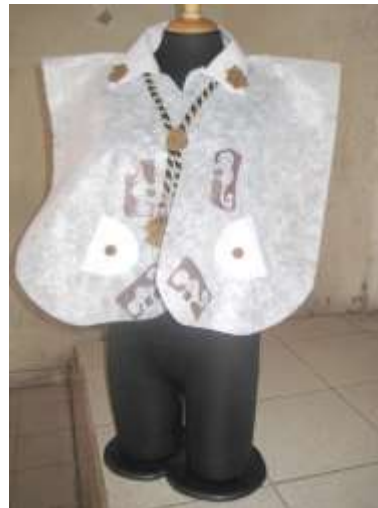
Taller de diversificación. La ruana como identidad. Cumbal, Mayo de 2012. Sonia Calvache – Artesanías de Colombia S.A Referentes simbologías “Pastos”