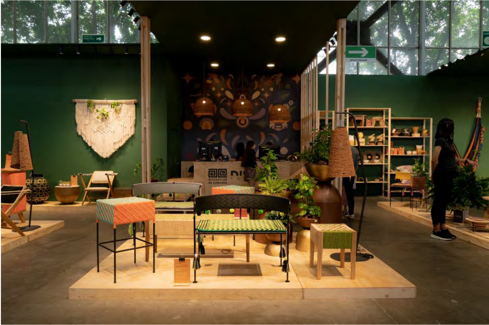
Diseño Colombia, Pabellón Amarillo