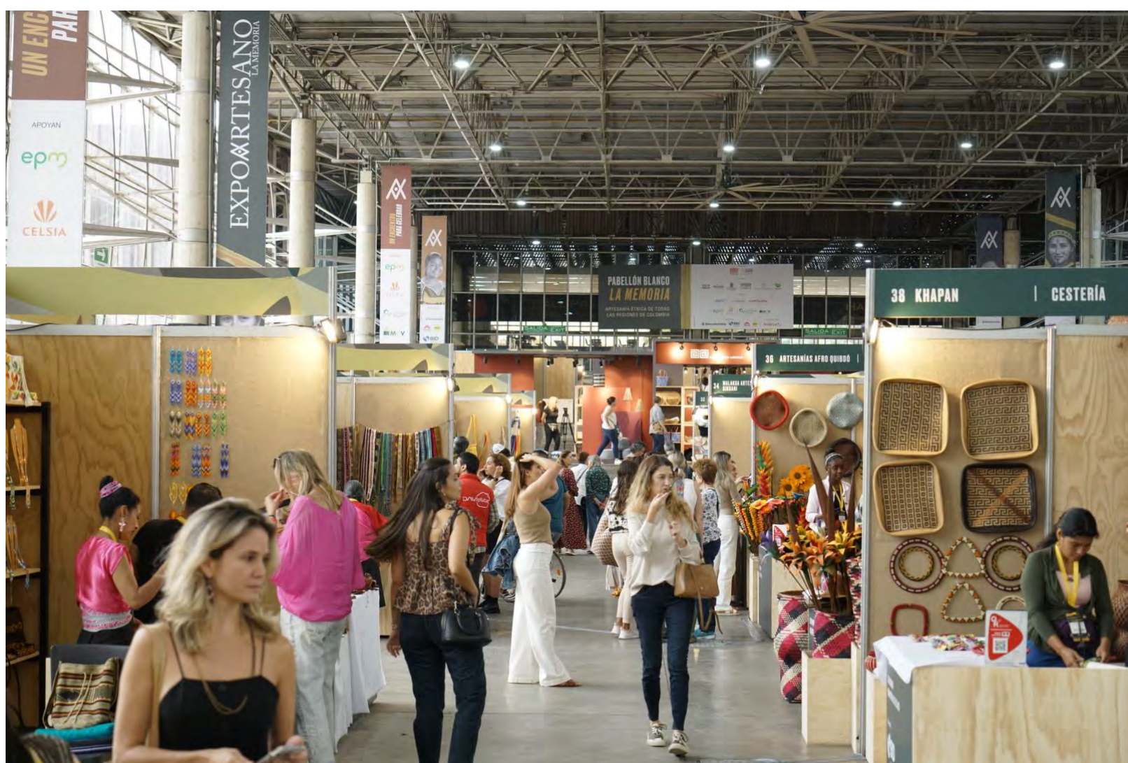
Pabellón Blanco, La Memoria.