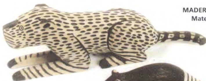
MADERA BLANDA/SOFT WOOD Materia Prima/ Raw material: Curupí