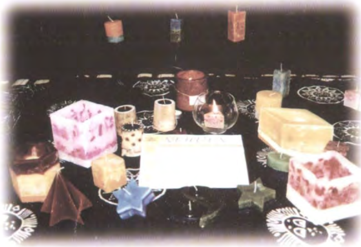
Nehuen Velas POSADAS