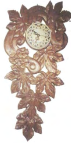
Briyi Stockmayer POSADAS