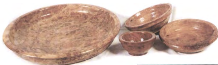
Néstor Bachot MONTECARLO