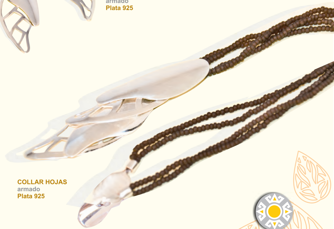
COLLAR HOJAS armado Plata 925