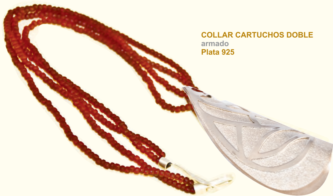
COLLAR CARTUCHOS DOBLE armado Plata 925