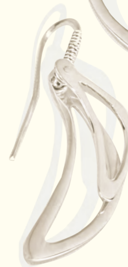
ARETES BANANOS armado Plata 925