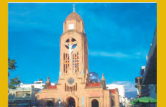
la iglesia jesús maría y José