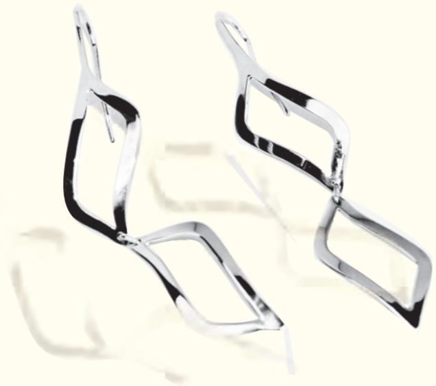
ARETES ENLACES armado Plata 925