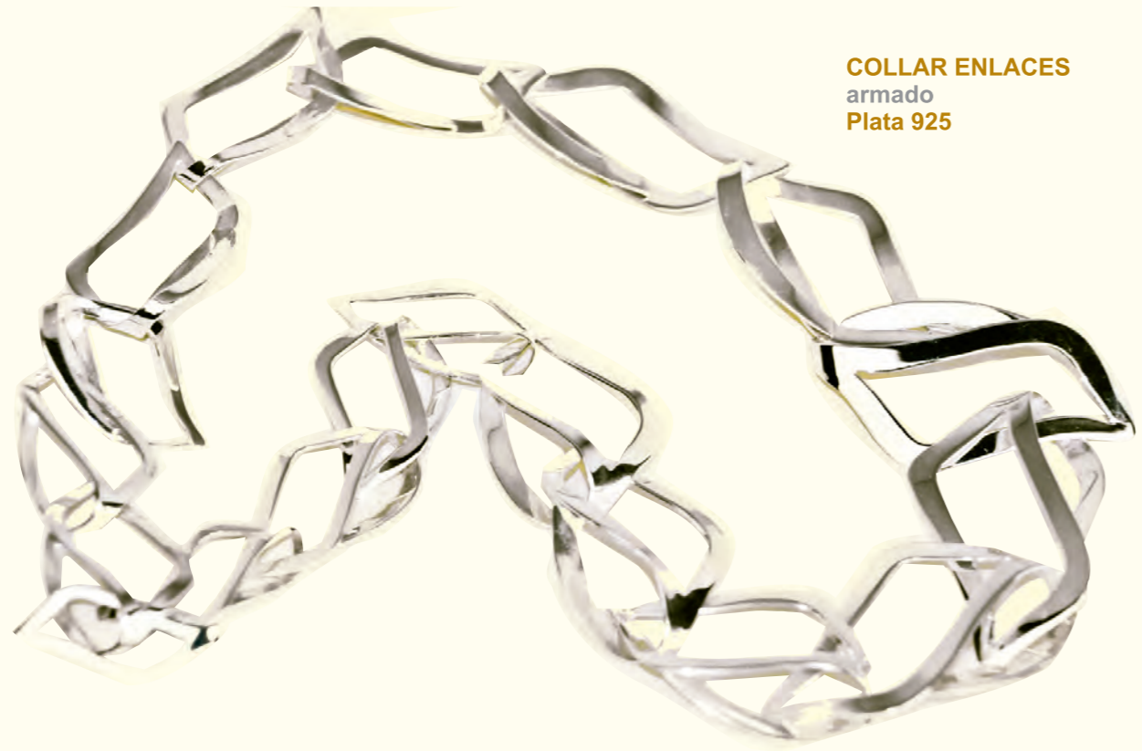
COLLAR ENLACES armado Plata 925