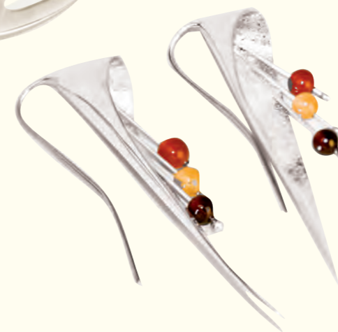
ARETES CARTUCHOS armado Plata 925