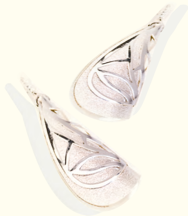
ARETES CARTUCHOS DOBLE armado Plata 925