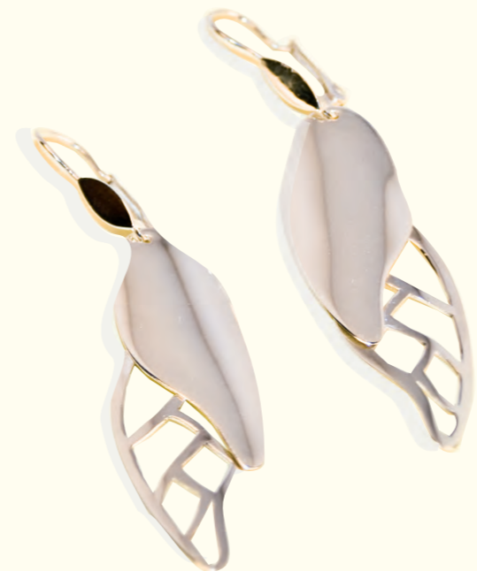
ARETES HOJAS armado Plata 925