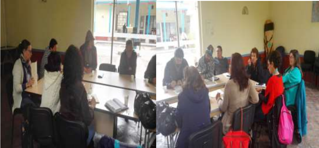
Mesa Distrital de Artesanos de Bogotá D.C