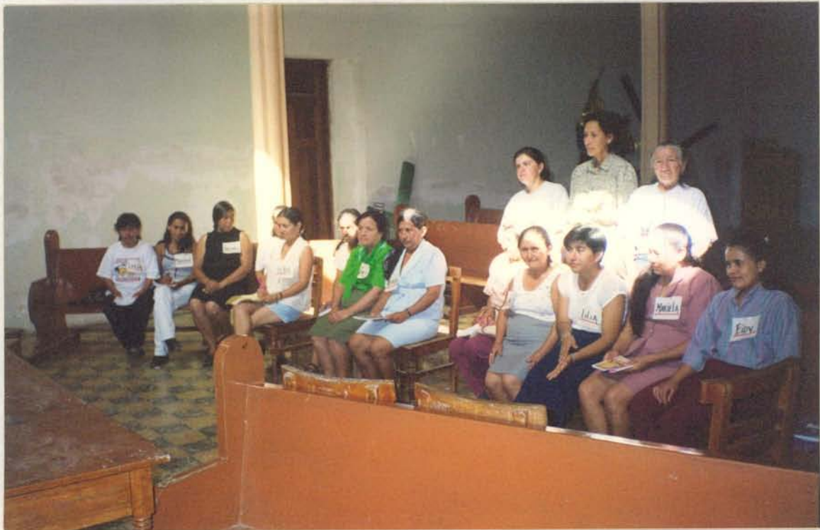
GRUPO DE ARTESANAS : Jornada de Capacitación de la tarde 2pm. a 6pm.