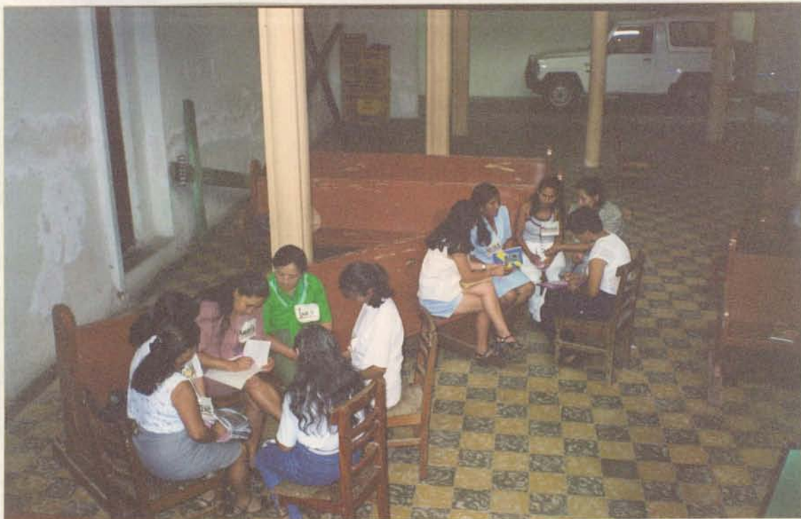
EJERCICIO EN CLASE: Trabajo en Grupo – Socialización del Aprendizaje.