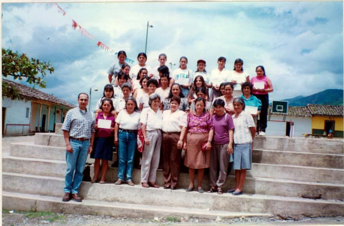
GRUPO DE ARTESANAS : "Asociación de Mujeres Artesanas de Ancuya"