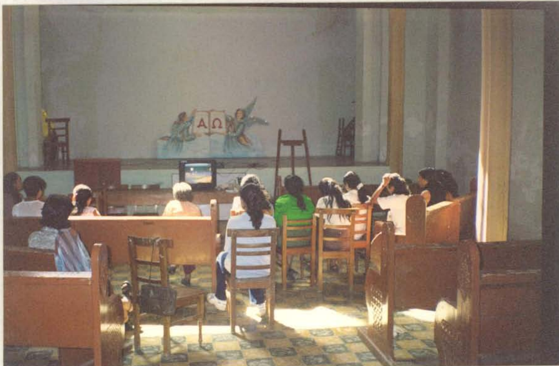
JORNADA DE CAPACITACION : Presentación de Vídeo VHS - Estudio de Caso