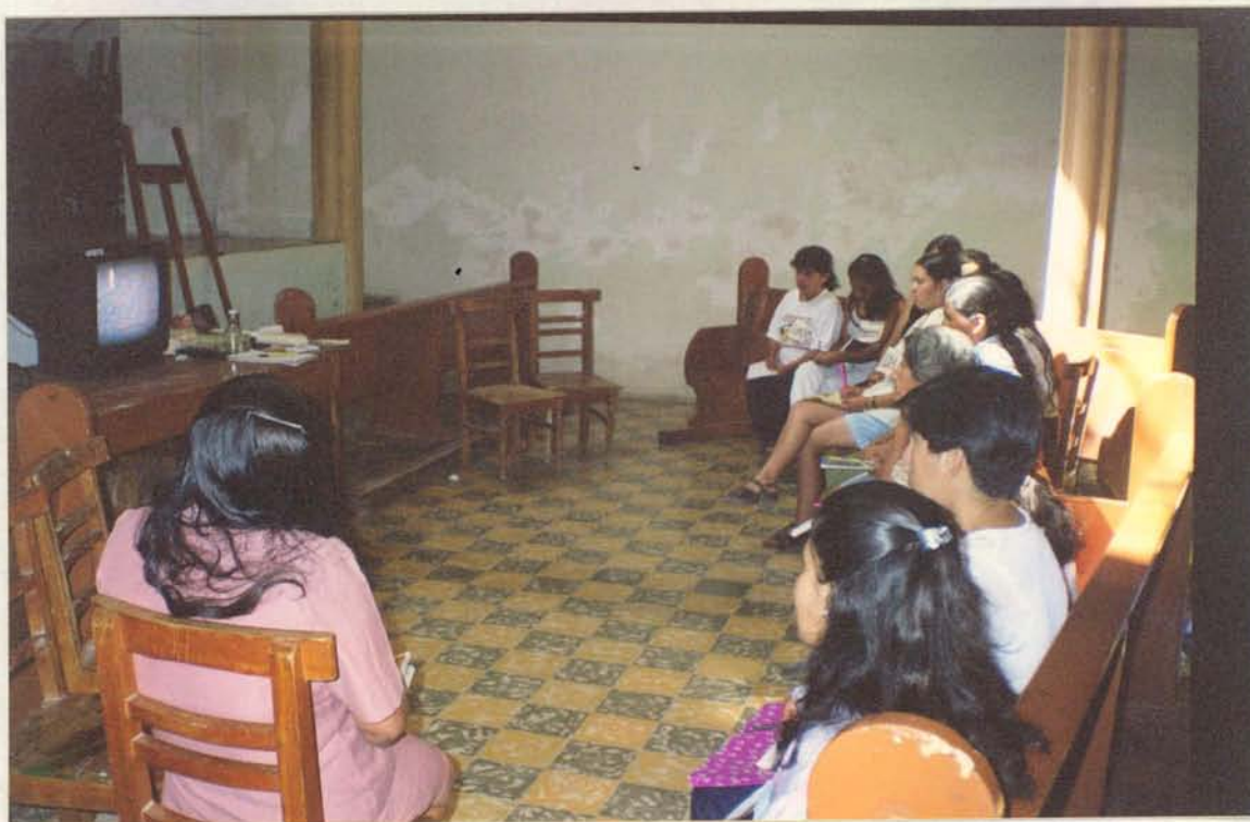
JORNADA DE CAPACITACIÓN : Desarrollo cuestionario con respecto al estudio de caso