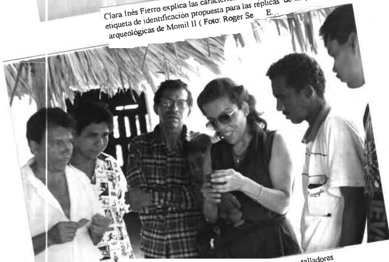
Atención y sumo interés demostraron los ceramistas y talladores momileros en la asesoría sobre diseño y técnicas de envejecimiento de réplicas de la Arqueología Zenú.