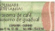
Imagen corporativa Molinari