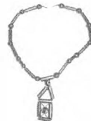
Collar tradicional Coveñas. Artesanías de Colombia. Noviembre 2006.