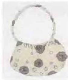
Bolso en tela. Coveñas. Fotógrafo: Omar Darío Martínez G. Artesanías de Colombia. Noviembre 2006.

Los productos artesanales más representativos que elaboran los artesanos en la localidad, son: