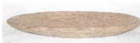
Batea en tallado de madera de palma. Coveñas. Fotógrafo: Omar Darío Martínez G. Artesanías de Colombia. Noviembre 2006.