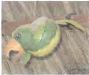
Artesanías de Colombia. Noviembre 2006.