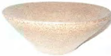
Batea dándole un poco mas de funcionalidad al elemento. Coveñas. Fotógrafo: Omar Dario Martínez G. Artesanías de Colombia. Noviembre 2006.