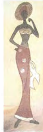
Cuadro anterior. Coveñas. Artesanías de Colombia. Noviembre 2006.