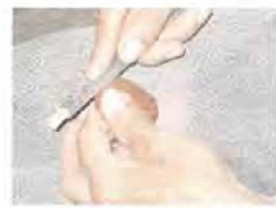
Proceso transformación. Coveñas. Artesanías de Colombia. Noviembre 2006.