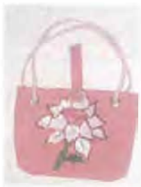
Bolso producto sugendo a partir la flora de la región. Coveñas. Fotógrafo: Omar Darío Martínez G. Artesanías de Colombia, Noviembre 2006.

A continuación se realiza una comparación de los productos existentes diseñados por los artesanos con los productos con las mejoras propuestas.