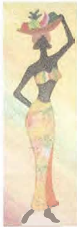
Cuadro pintado con mayor contraste de color. Coveñas. Artesanías de Colombia. Noviembre 2006.