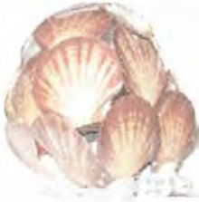
Lámpara solo de conchas. Coveñas. Fotógrafo: Omar Dario Martínez G. Artesanías de Colombia. Noviembre 2006.