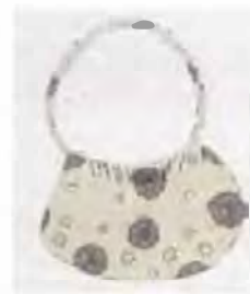
Bolso tradicional. Coveñas. Fotógrafo: Omar Darío Martínez G. Artesanías de Colombia, Noviembre 2006.