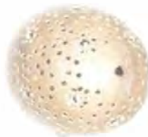
Aplique en totumo y calabazo. Coveñas. Artesanías de Colombia. Noviembre 2006.