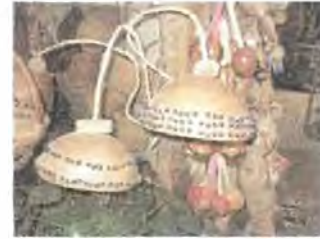
Artesanías de Colombia. Noviembre 2006.

El oficio más representativo de la región es el trabajo en totumo y calabazo, esto se debe a la fácil obtención de la materia prima, y a la destreza que han adquirido los artesanos en el manejo de esta, pero en la actualidad las artesanías de la zona están tomando cursos de capacitación que les dicta el SENA en el desarrollo de manualidades, como confección de bolsos y elaboración de objetos de bisutería.