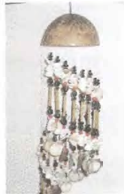
Lámpara tradicional Coveñas. Artesanías de Colombia. Noviembre 2006.