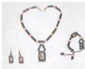
Collar complementado para hacer la linea de productos. Coveñas. Artesanías de Colombia. Noviembre 2006.