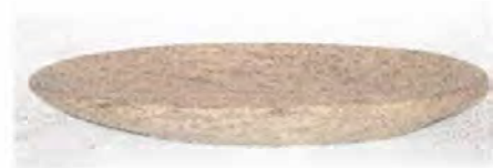
Batea tradicional Coveñas. Fotógrafo: Omar Dario Martínez G. Artesanías de Colombia. Noviembre 2006.