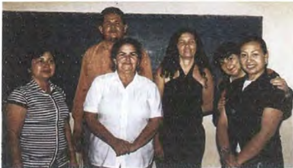
Algunos integrantes del grupo de trabajo con la asesora del proyecto