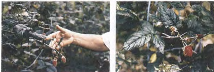
Mata de mora