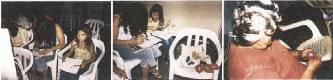
Grupo de Accesorios de moda

Se inició por un trabajo de bocetación libre y luego se procedió a elaborar un modelo con materiales como papel, fique y pauche