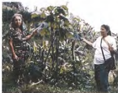
Árbol de Pauche o arboloco