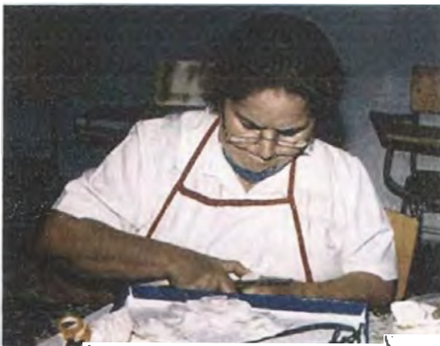
Posteriormente se procedió a cortar muy cuidadosamente (con cuchillo muy afilado) tajadas de pauche para formar la flor