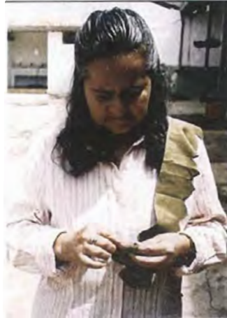
Armado de la base en tela para proteger a la flor. Se hizo a partir del diseño de flor en tela le da.