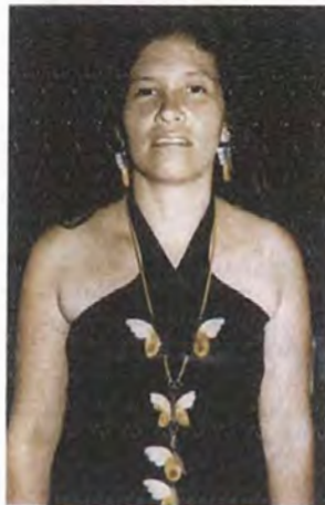
Collar largo con cordón plano de cuero, ajustado con Broche Náutico Pequeño