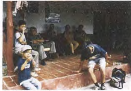
Grupo asistente a la jornada de observación