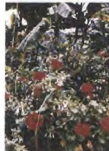
Diversidad de flores ornamentales