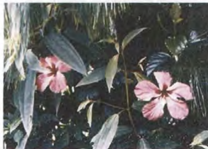
Flor del curubo