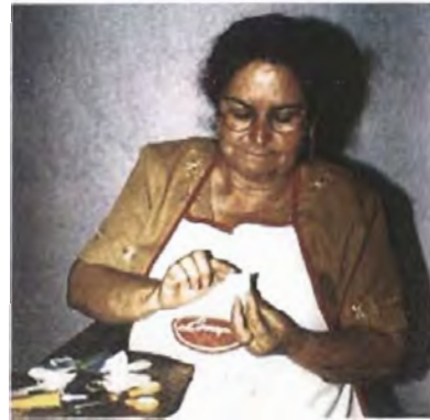
Armado de la flor, con el pegue de varios pétalos