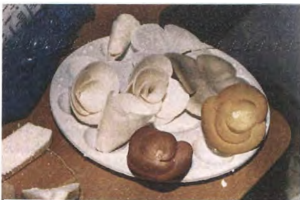
Primeras flores elaboradas para la línea de broches, a partir del ensamble de pétalos previamente curvados