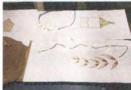
Figuras decorativas con referente en flores