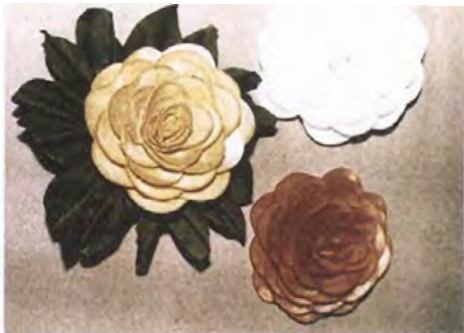
Flores listas para armar el prendedor