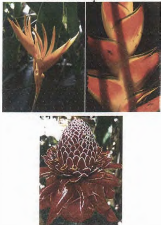
2. Flores Tropicales