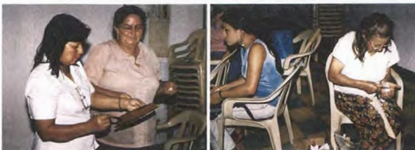
Grupo de Accesorios utilitarios