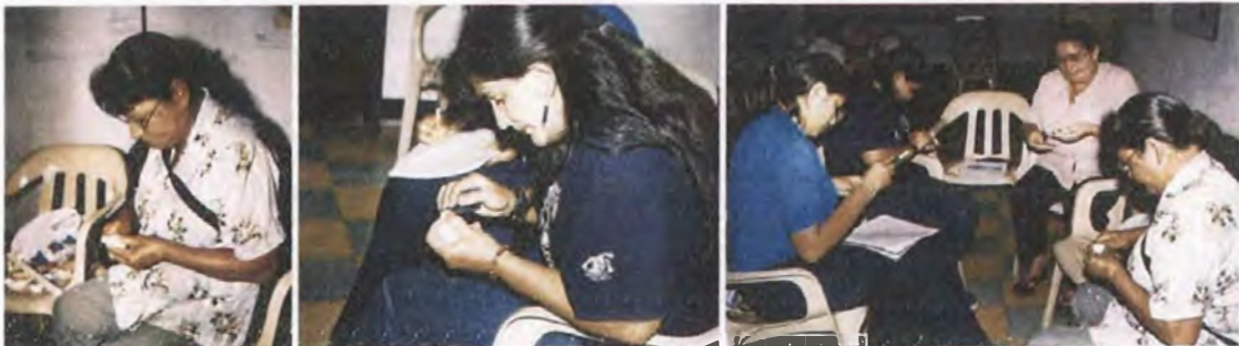
Grupo de figuras decorativas