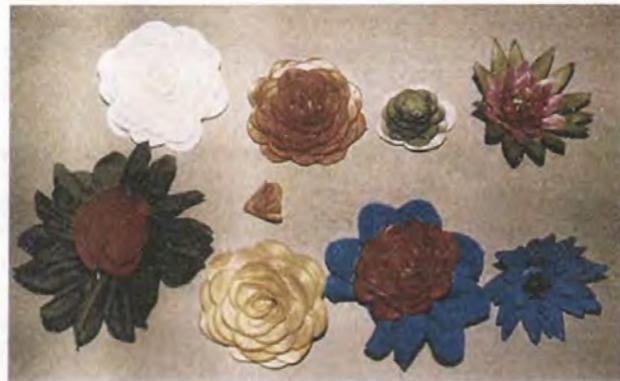
Diseños varios de flores.