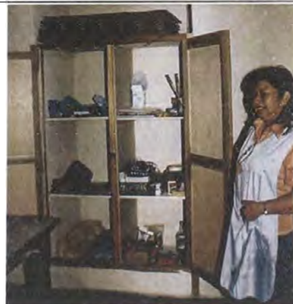
Organización de los materiales e insumos entregados en el sitio de trabajo