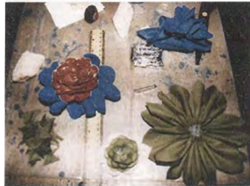
Modelos iniciales de prendedor