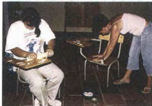
Proceso inicial para elaborar los pétalos. Se ensayaron varias formas buscando la más viable, en esta ocasión se cortaban pequeñas rodajas de paucha, previamente humedecidos se curvaban con un rodillo. Este proceso fue demorado dificultando el pegado por estar húmeda la materia prima.