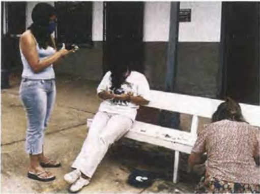
Lijado de las rodajas de pauche para formar los pétalos