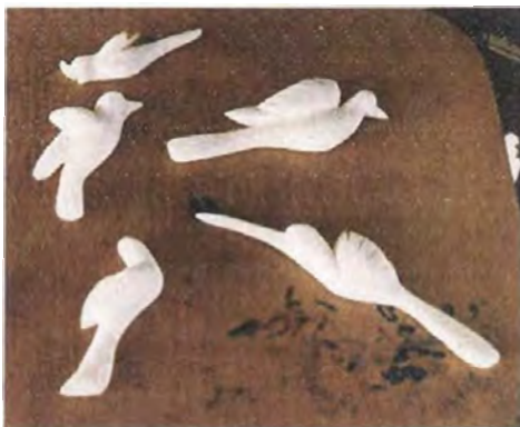
Diversa formas de pájaros para ubicarlos en retablos