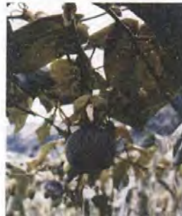
Flor de granadilla en proceso de maduración (le hace falta dos meses para su recolección)