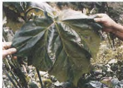
Hoja del pauche

Se encontraron diferentes árboles ornamentales y frutales como la granadilla, tomate de árbol, lulo, curuba durazno, mora, fresa, maíz, plátano; (también se encontró un árbol de arboloco de donde se extrae el pauche). Esta actividad sirvió para observar la morfología de las especies de árboles frutales y ornamentales, sus flores y frutos, encontrando relación entre los colores, tamaños y formas conocidas como también a partir de las sensaciones de olores y texturas.