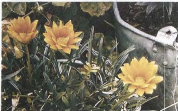
3. Flor Silvestre