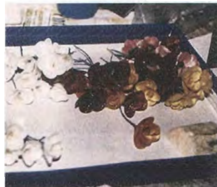
El armado se hizo con alambre forrado en cinta Floral tape verde