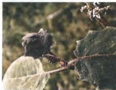
Hoja de árbol de lulo