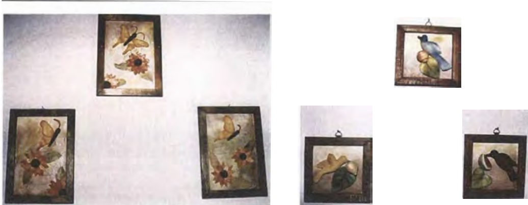
Presentación final de los retablos, se mezclaron los elementos nuevos como las mariposas y flores con los tradicionales como pájaros ( tallados con unacara plana ) y frutos