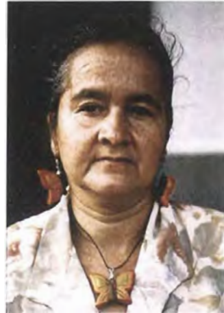
Collar corto elaborado con el tema de inspiración de mariposas, anudado con cordón de cuero hindú color negro y ajustado con gancho pico de loro RH10N