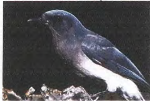
4. . Azulejos