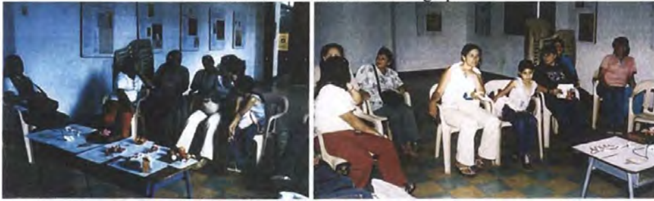
Presentación de resultados ante el grupo