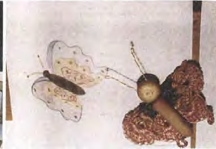
Accesorios de moda, collares y prendedores con referente en mariposas