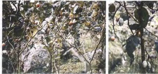
Tomate de árbol