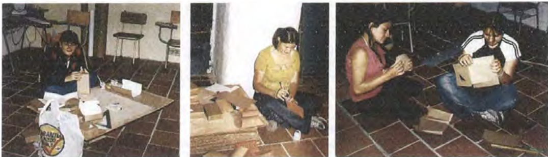
Grupo de artesanas en la elaboración de los empaques a partir del modelo desarrollado

Se elaboraron los planos con dimensiones y forma de plegado para cada uno.