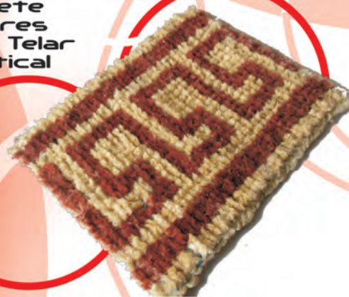
Tapete Grabado Tejido Telar Vertical