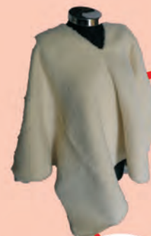
Ruana Blanca Tejido Telar Horizontal