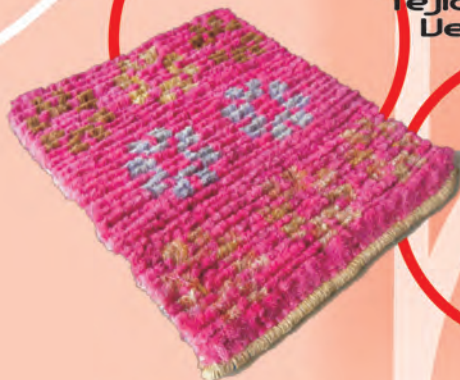
Tapete Flores Tejido Telar Vertical