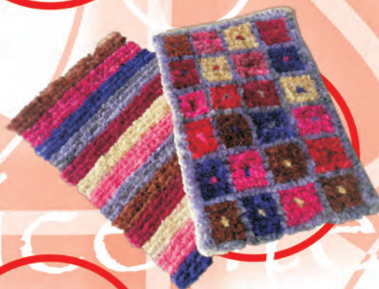
Tapete Colores Tejido Telar Vertical