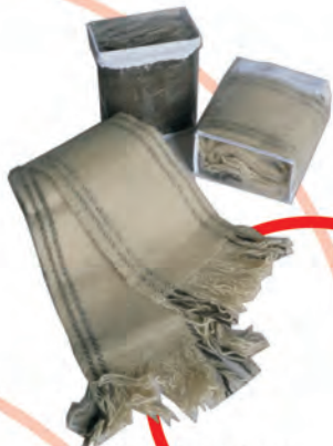
Bufandas Tejido Telar Horizontal