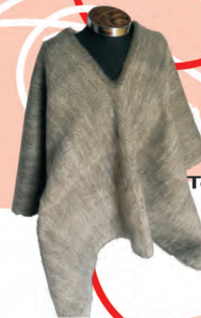
Ruana Tejido Telar Horizontal