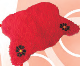
Tapete Tejido telar Vertical