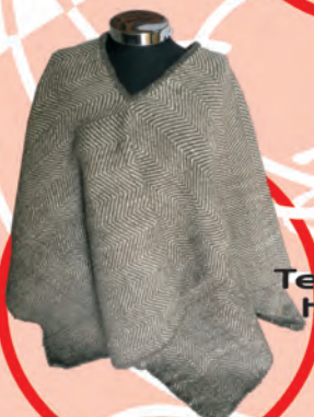
Ruana Tejido Telar Horizontal