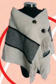
Chal Tejido Telar Horizontal