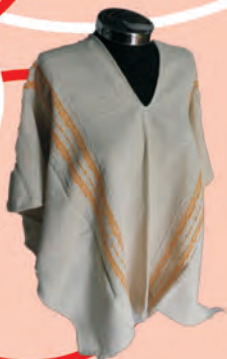
Ruana con Grabado Tejido Telar Horizontal