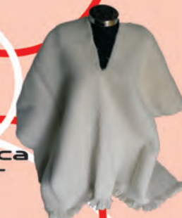
Ruana Blanca Tejido Telar Horizontal