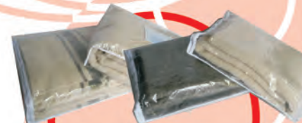
Cobija Tejido Telar Horizontal