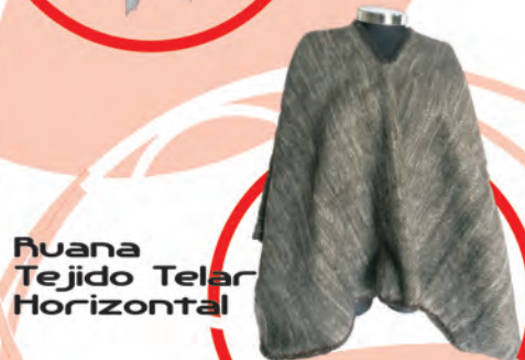
Ruana Tejido Telar Horizontal