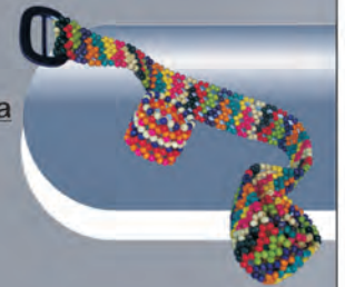
Correa y Manilla Materiales: Madera