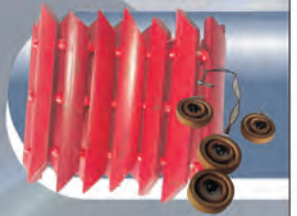
Collar, aretes y Manilla Materiales: Guadua y Semillas