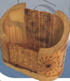
Papelera Materiales: Guadua, mimbre tejido y semillas