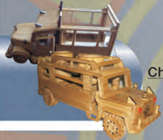
Chiva tradicional y Campero Materiales: Guadua