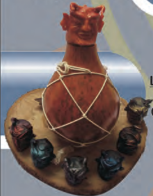
Licorera y copas Materiales: Calabazo y fique