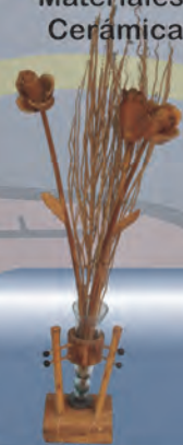
Florero y Flores Materiales: Bambú, guadua y semillas