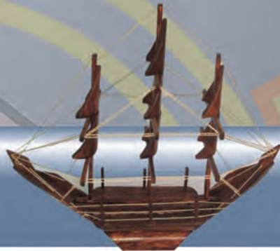
Barco Materiales: Guadua y fibras naturales