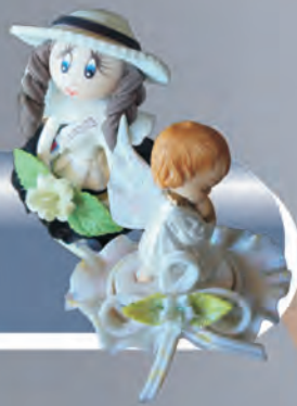
Souvenirs Materiales: Porcelanacrón, fibras naturales y semillas