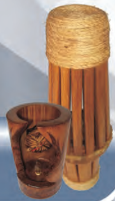
Reloj y Lámpara Materiales: Guadua y Fique