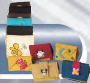
Billeteras Materiales: Yute, lona, aplicación tela sobre tela