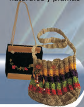
Bolsos Materiales: Fique tejido, semillas, tela, guadua y bordados