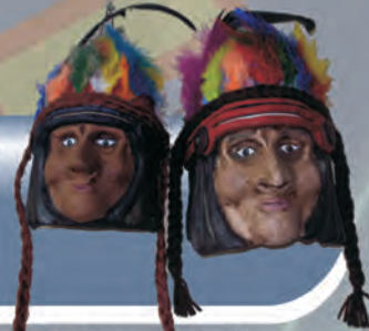
Máscaras Indígenas Materiales: Cerámica, fibras naturales y plumas