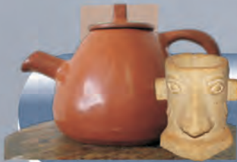
Teteras y Vaso Materiales: Cerámica