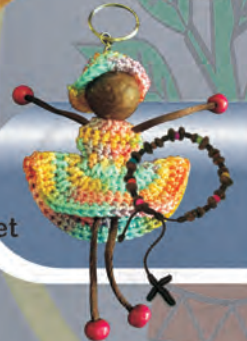
Llavero - Denarios Materiales: Granos de café, totumo, madera e hilo tejido en crochét