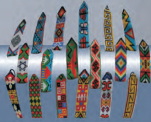
Manillas tejidas Materiales: Chaquiras