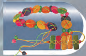
Collar, Cinturón y Manilla Materiales: Totumo y madera