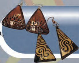
Aretes Materiales: Totumo y guadua, tallados y pirograbados