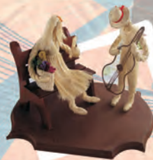
FIGURA PAREJA TÍPICA Materiales: Fique y madera