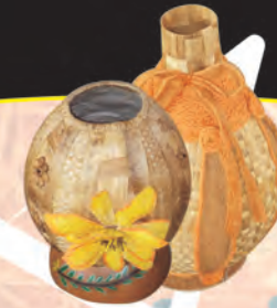
JARRONES Materiales: Calceta de plátano y fique