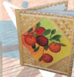
ÁLBUM DE FOTOS Materiales: Fique y papel