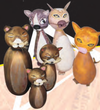
GATOS DECORATIVOS Materiales: Totumo y fique