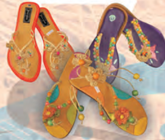
SANDALIAS Materiales: Cuero, calceta de plátano y fique