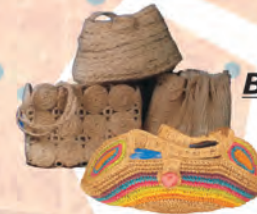
BOLSOS TEJIDOS Materiales: Fique