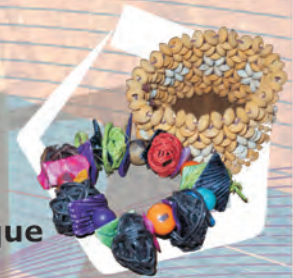
BISUTERÍA Materiales: Madera, calceta de plátano y fique