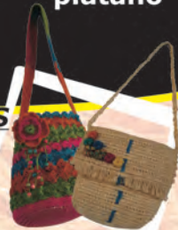
BOLSOS TEJIDOS Materiales: Fique, madera y semillas