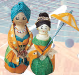
MUÑECAS DECORATIVAS Materiales: Capacho de maíz, calceta de plátano y estropajo