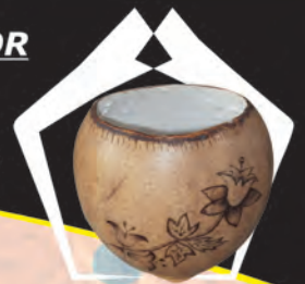
CONTENEDOR Materiales: Totumo pirograbado