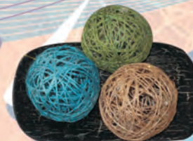
CENTRO DE MESA Materiales: Madera y fique