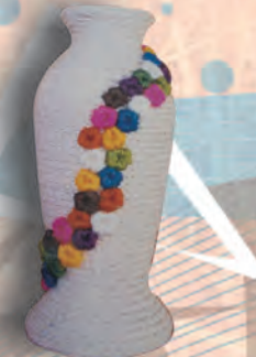
JARRÓN Materiales: Fique