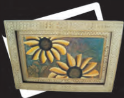
CUADRO Materiales: Óleo, marco en calceta de plátano