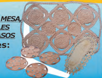
CENTRO DE MESA, INDIVIDUALES Y PORTA VASOS Materiales: Fique