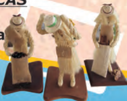
FIGURAS TÍPICAS Materiales: Fique y madera