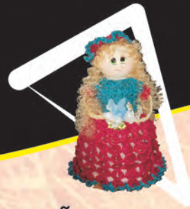
MUÑECA TEJIDA Materiales: Fique, porcelanacrón y semillas