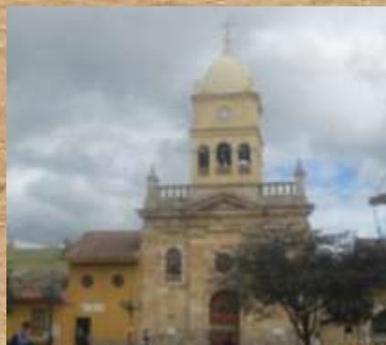
Iglesia Nuestra Señora del Rosario

Uno de los principales pilares de la Arquitectura Colonial que adorna el municipio, antigua hacienda la Calera, la Casa Municipal, imponente y emblemática centro de reunión administrativo.