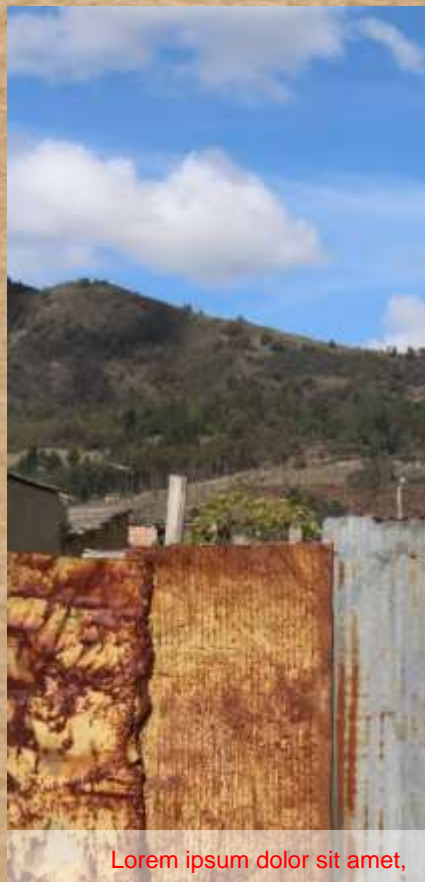
Lorem ipsum dolor sit amet,