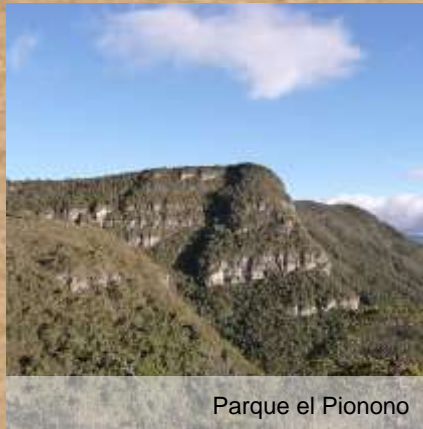
Parque el Pionono

La Flor digital enmarca los jardines del parque principal de Sopó, con sus colores, es sin duda uno de los tantos símbolos del municipio.