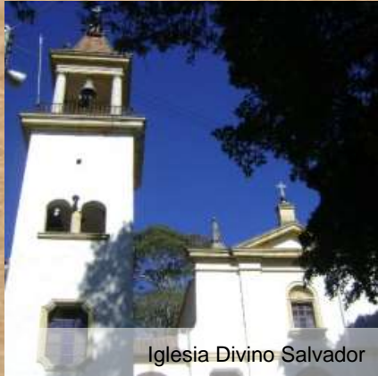
Iglesia Divino Salvador