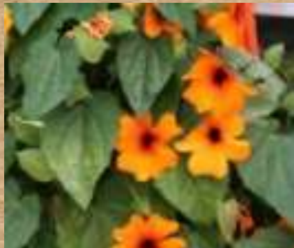
Planta Ojo de Poeta