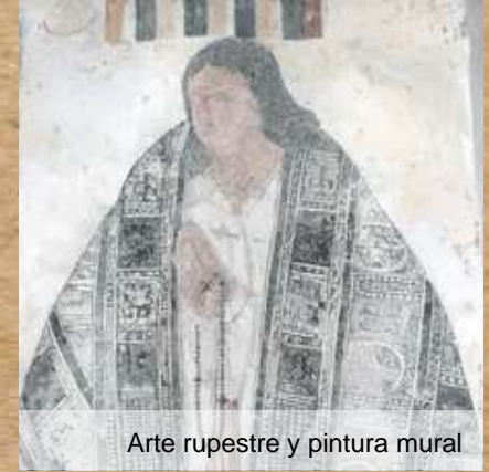
Arte rupestre y pintura mural

Lejos del dogma, la iglesia principal del conjunto doctrinero San Juan Bautista se puede catalogar como una joya de la arquitectura colonial, no sólo por su historia y construcción, sino también por sus murales que datan del siglo XVII, usados también como herramienta para el adoctrinamiento de los indígenas.