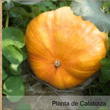
Planta de Calabaza