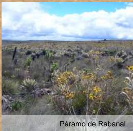
Páramo de Rabanal