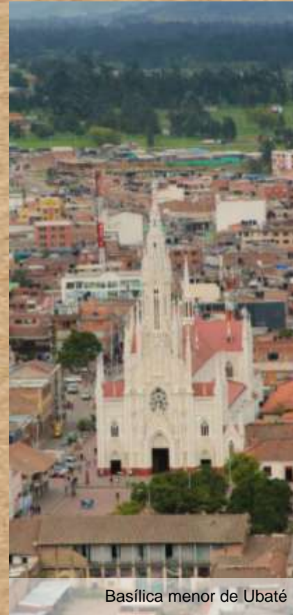
Basílica menor de Ubaté

Se coloca la primera piedra el 6 de Agosto de 1921 por los arquitectos Constantino de Castro y el Holandés Antonio Stoute en el mismo sitio que ocupará la primera iglesia doctrinera de comienzos del siglo XVIII. Su construcción finaliza el 27 de octubre de 1939. Su estilo neogótico francés deja entrever una aguja principal de 67 metros de altura, tres naves en forma ojival, columnas en piedra, expresiones del arte ojival o flamígero, rosetón y vitrales con motivos religiosos.)