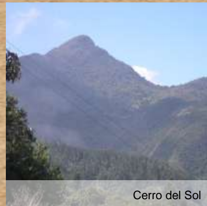
Cerro del Sol