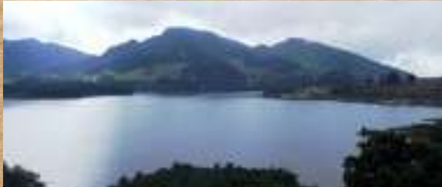
Embalse del Neusa

Las Salinas de Tausa junto con Nemocón y Zipaquirá, hacen parte de la ruta de la sal desde la época precolombina, su explotación y comercialización “creó una red de caminos y lugares de encuentro entre mercados indígenas donde la sal se intercambiaba por otros productos tales como algodón, maíz, coca, conchas, oro y cerámicas” (León Soler, 2011).