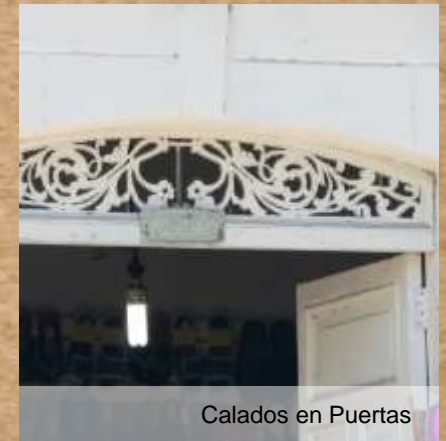
Calados en Puertas