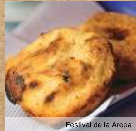
Festival de la Arepa

De este horno se tiene escasos datos históricos, cuyos restos permanecen en calle Josefina 1152. Se estima que funcionó hasta finales del siglo XIX.