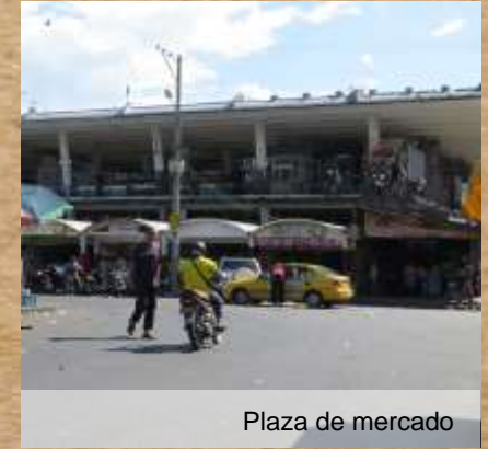
Plaza de mercado

Plaza de mercado, diseñada por el Arquitecto Leopoldo Rother y construida en 1954. Fue premio nacional de Arquitectura y en 1990 se fue declarada monumento nacional. Su importancia radica en el uso de columnas en forma de V y techos arqueados, los cuales le permiten mantener una planta de grandes áreas libres y altura ideales para el clima de la ciudad.