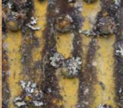
Lorem ipsum dolor sit amet,