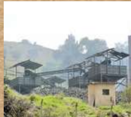
Mina de Carbón

La construcción inicial de este recinto religioso comprende entre 1564 a 1580, edificación en bahareque y cubierta en paja.