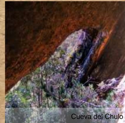
Cueva del Chulo