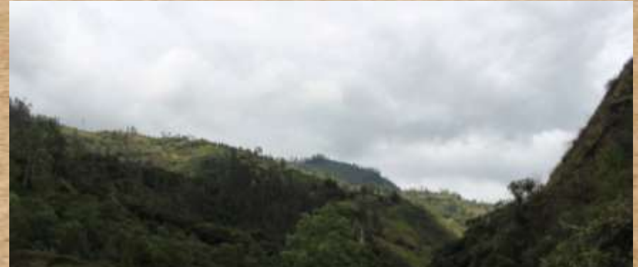
Lorem ipsum dolor sit amet,