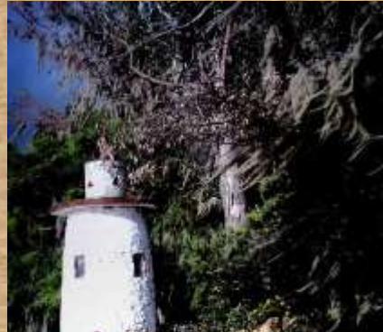
El faro laguna de Fúquene