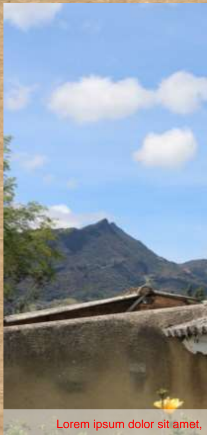
Lorem ipsum dolor sit amet,

Lorem ipsum dolor sit amet, consectetur adipiscing elit. Nullam a nisl ante. Suspendisse laoreet quam ante, sed placerat leo iaculis sit amet. Cras ut ex quis nulla viverra rhoncus. Nunc ullamcorper viverra libero, nec iaculis enim porta sed.