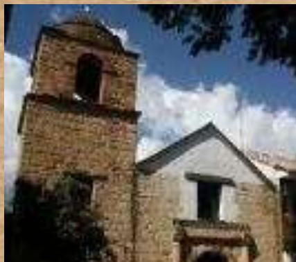
Capilla Nuestra Señora del Rosario