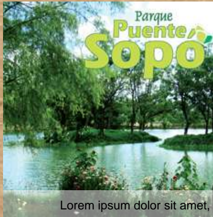
Lorem ipsum dolor sit amet,

El cerro de las águilas en el Parque del Pionono, presenta alturas que comprenden desde los 2.800 msnm. Hasta su pico máximo de 3.250 msnm. Por sus características se ha constituido en una gran reserva forestal representada por mamíferos como liebres, zorrillo, armadillos, curíes; aves como golondrinas, mirlas, copetones, reinitas, trogloditas, reptiles y anfibios.