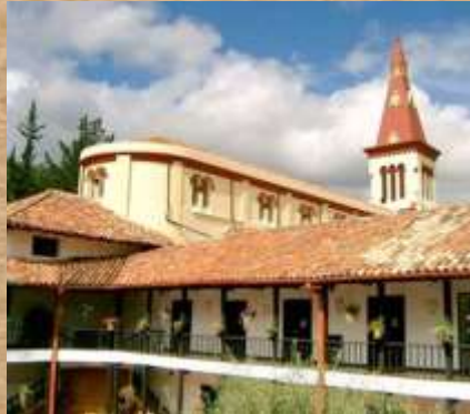
Noviciado San Luis Obispo

Noviciado Franciscano desde 1883. Desataca su arquitectura antigua y con un aire de espiritualidad Construcción que data de 1835, con estructura de estilo colonial enchapada en piedra de río, piso de ladrillo, techo artesonado de madera y cubierta de teja de barro, desde donde se puede apreciar una vista panorámica del Valle de Ubaté. Construida en Honor a Santa Bárbara, abogada de los truenos y los relámpagos.