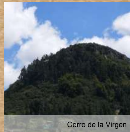
Cerro de la Virgen

Colombia, como poseedor de la mayor diversidad de Frailejones en el mundo y Guachetá con su Páramo de Rabanal, se convierte en referente geográfico y turístico para conocer diversas clases de esta planta. Río Quebrada Honda en límites con Ráquira, ofrece un paisaje lleno de rápidos y cascadas. Cerro del Sol (en Chibcha "labranza de nuestro pueblo"), es uno de los lugares representativos de la región. Lugar ceremonial para los Indios Guachetaes.