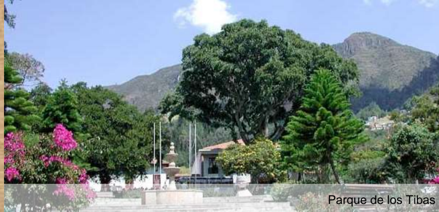
Parque de los Tibas