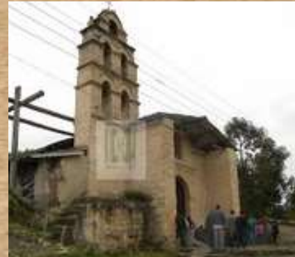
Iglesia Tausa Viejo

Trucha Arcoiris. Llamada así por los colores que lleva en su cuerpo y que varían acorde con su edad. Hace parte de los platos típicos del municipio de Tausa, su cría se concentra en el embalse del Neusa. ("Tausa," n.d.).