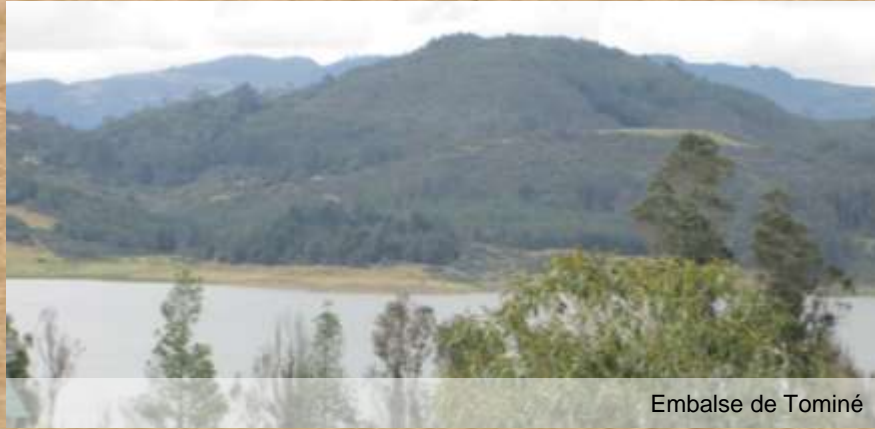
Embalse de Tominé