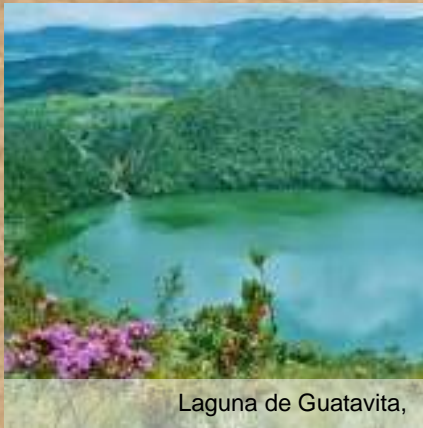
Laguna de Guatavita,