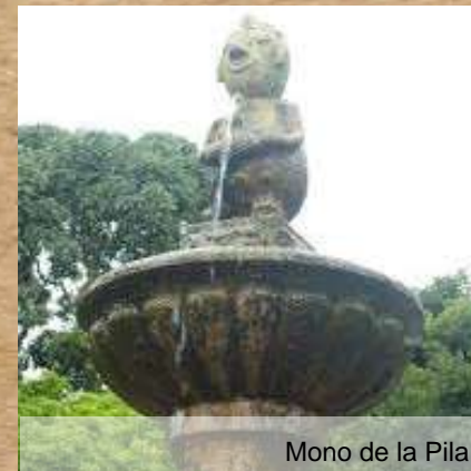
Mono de la Pila