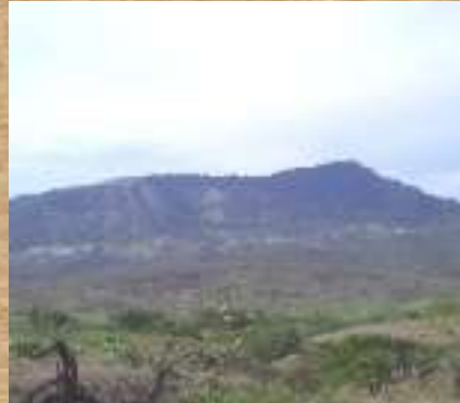
Cerro de Guacaná

Ubicada en el parque principal, esta estatua de la “patasola”, mitología nacional que los locales han adoptado por la vigencia de sus relatos.