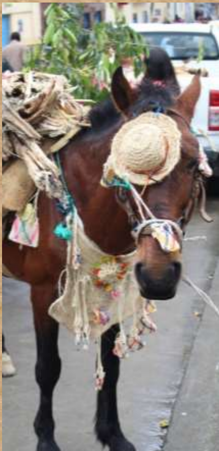
Lorem ipsum dolor sit amet,