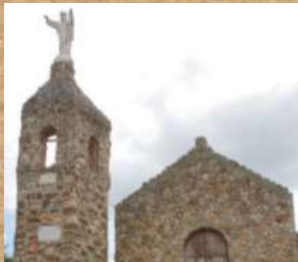
Capilla Santa Bárbara

Noviciado Franciscano desde 1883. Desataca su arquitectura antigua y con un aire de espiritualidad Construcción que data de 1835, con estructura de estilo colonial enchapada en piedra de río, piso de ladrillo, techo artesonado de madera y cubierta de teja de barro, desde donde se puede apreciar una vista panorámica del Valle de Ubaté. Construida en Honor a Santa Bárbara, abogada de los truenos y los relámpagos.