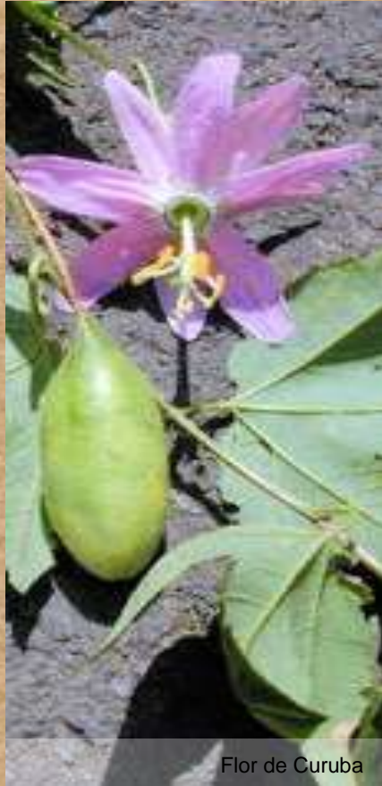
Flor de Curuba