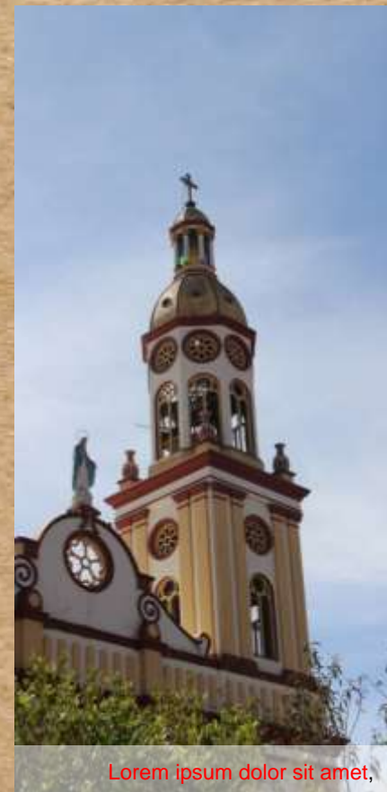
Lorem ipsum dolor sit amet,

Cras ut ex quis nulla viverra rhoncus. Nunc ullamcorper viverra libero, nec iaculis enim porta.