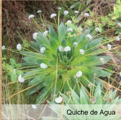
Quiche de Agua