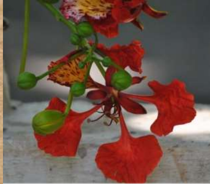
Flor de Acacio

Girardot en antaño fue conocida como la ciudad de las Acacias, dado que estos árboles se encontraban adornando todas las calles del municipio, brindando sombra del inclemente sol a sus ciudadanos y visitantes.