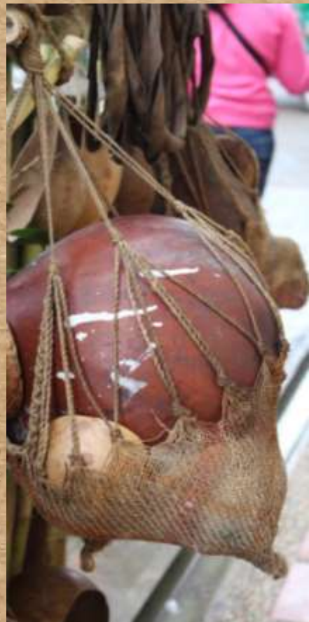
Lorem ipsum dolor sit amet,