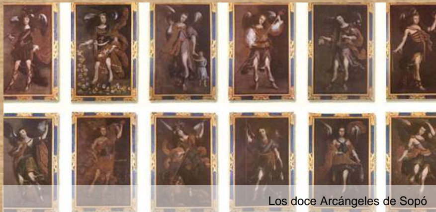
Los doce Arcángeles de Sopó