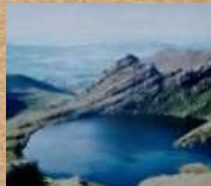
Parque Nacional Chingaza

Esta rana se haya en el páramos de la región central y la vertiente de la cordillera Oriental en el Departamento de Cundinamarca , Parque Nacional Natural Chingaza.