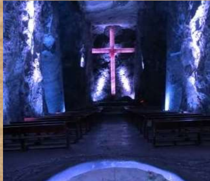
Catedral de Sal