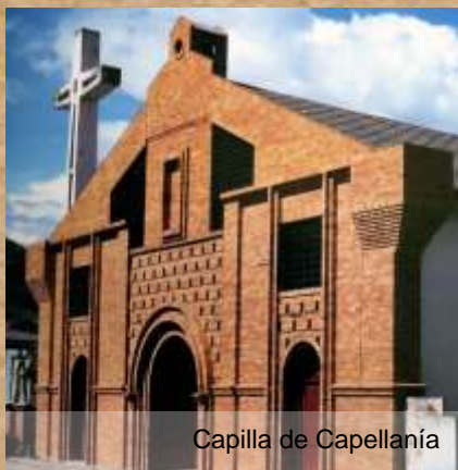
Capilla de Capellanía

Capilla de Nuevo Fúquene fué construida en el sector que algunos habitantes de entonces querían reubicar al pueblo de Fúquene, lo cual nunca sucedió, así desde entonces es llamado Nuevo Fúquene y queda a 15 km del pueblo original que aún existe. Capellanía es paso obligado cuando de la capital se conduce hacia el pueblo de Fúquene, data del siglo XX y fué remodelada en el año 2005.