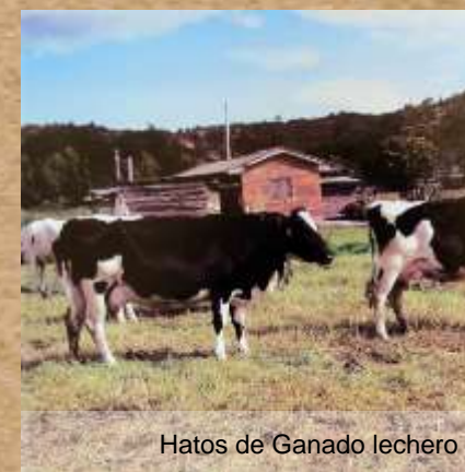
Hatos de Ganado lechero

Tunel del Ferrocarril del Norte, construido en 1926 en límites entre Fúquene y Susa.