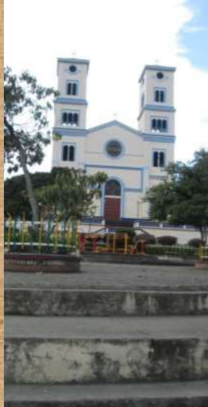
Lorem ipsum dolor sit amet,