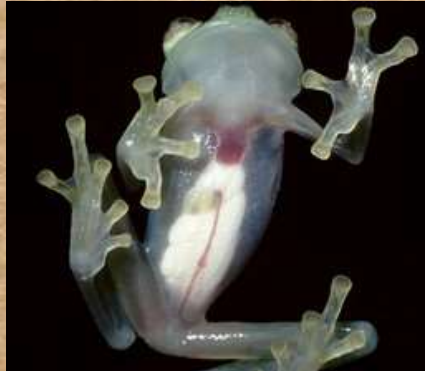
Rana de Cristal

Hyalinobatrachium pellucidum , ese es el nombre de esta extrañísima rana, también llamada rana de cristal, debido a su piel transparente, que llega a revelar hasta sus órganos vitales. ("Las ranas de cristal," n.d.).