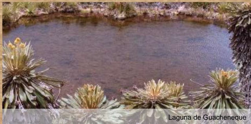
Laguna de Guacheneque

Flor del frailejón, es característica de Villapinzón. El municipio es conocido por el nacimiento del río Bogotá y allí, el paisaje está rodeado de frailejones. El río Bogotá nace en el páramo de Guacheneque en las proximidades del municipio de Villapinzón. Mirador el Pozo de la Nutria, bajo la vegetación del páramo.