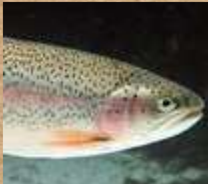
Trucha Arco Iris

Hyalinobatrachium pellucidum , ese es el nombre de esta extrañísima rana, también llamada rana de cristal, debido a su piel transparente, que llega a revelar hasta sus órganos vitales. ("Las ranas de cristal," n.d.).