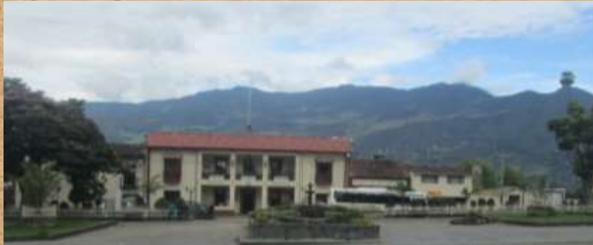
Lorem ipsum dolor sit amet,

Lorem ipsum dolor sit amet, consectetur adipiscing elit. Nullam a nisl ante. Suspendisse laoreet quam ante, sed placerat leo iaculis sit amet. Cras ut ex quis nulla viverra rhoncus. Nunc ullamcorper viverra libero, nec iaculis enim porta sed.