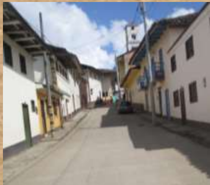
Lorem ipsum dolor sit amet,

Lorem ipsum dolor sit amet, consectetur adipiscing elit. Nullam a nisl ante. Suspendisse laoreet quam ante, sed placerat leo iaculis sit amet. Cras ut ex quis nulla viverra rhoncus. Nunc ullamcorper viverra libero, nec iaculis enim porta sed.