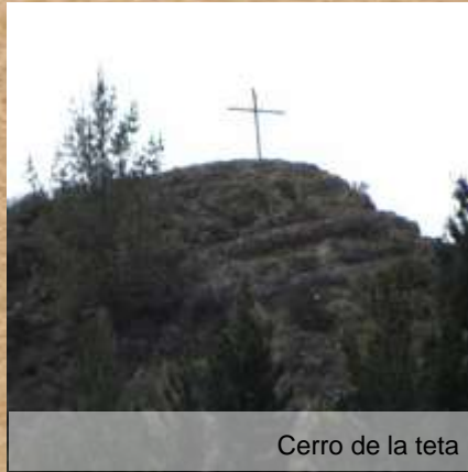
Cerro de la teta

Cerro ubicado al costado occidental del casco urbano, es utilizado habitualmente para desarrollar actividades deportivas los fines de semana y ha sido escenario de validas departamentales de ciclismo de montaña, posee varios senderos hasta la cima de donde se aprecia parte del valle de Ubaté y el casco urbano. La quebrada de Soagá en su caída forma chorros que caen más de 4 metros.