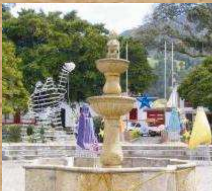
Mono de la Pila

Cuenta la leyenda que Sopó fue un gran cacique que obedecía órdenes de Guatavita, el cacique mayor. Su oficio era recaudar impuestos, se cubría con oro, perfumes, comidas y esmeraldas. La iglesia es uno de los más antiguos templos de la sabana de Bogotá. Desde el siglo XVIII tiene la forma actual. En la nave principal se destaca una colección única del más puro arte colonial del siglo XVII "los 12 arcángeles de sopó". El mono de la pila, una modesta pila construida hace más de un siglo.