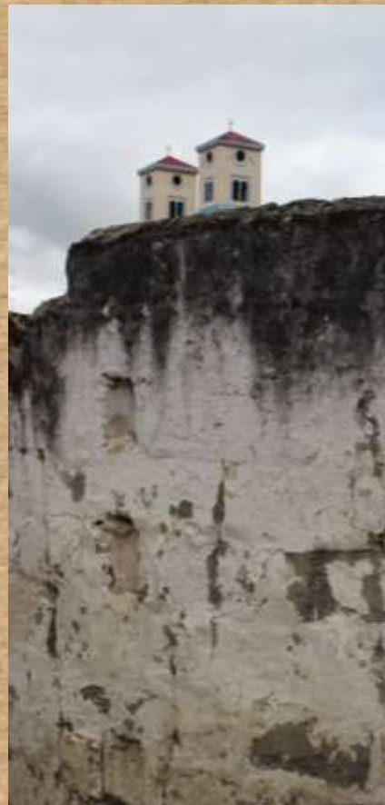
Lorem ipsum dolor sit amet,

Lorem ipsum dolor sit amet, consectetur adipiscing elit. Nullam a nisl ante. Suspendisse laoreet quam ante, sed placerat leo iaculis sit amet. Cras ut ex quis nulla viverra rhoncus. Nunc ullamcorper viverra libero, nec iaculis enim porta sed.