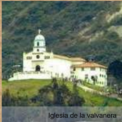
Iglesia de la valvanera