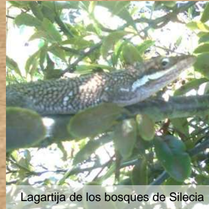
Lagartija de los bosques de Silecia

En los páramos que rodean el municipio se encuentran los Quiches de Agua, plantas que se asemejan a los frailejones, pero que llaman la atención del visitante por su inflorescencia distintiva.