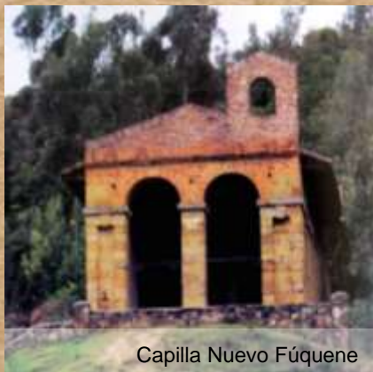
Capilla Nuevo Fúquene