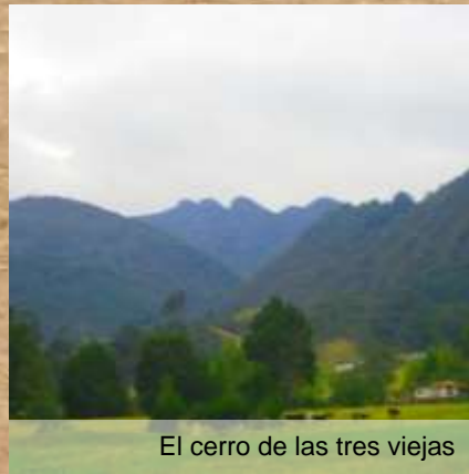
El cerro de las tres viejas

La laguna está ubicada en la cordillera oriental de Colombia en el municipio de Sesquilé, dando lugar a la leyenda de El Dorado. El Embalse de Tominé, ubicado entre los límites del municipio de Sesquilé y Guatavita, se pueden realizar diversas actividades como: senderismo, cabalgatas, camping y deportes acuáticos.