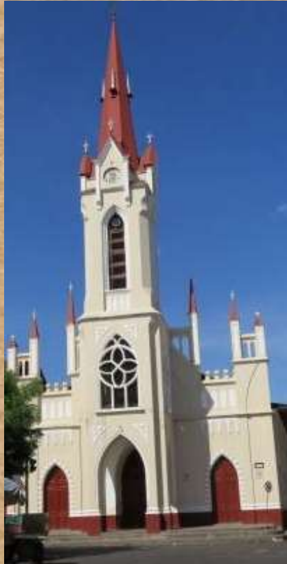
Iglesia de San Miguel

De estilo gótico, fue construida a finales del siglo XIX en la que se denominó “plaza de la Constitución” hoy en día “plaza Santander”. Fue la primera iglesia erigida en el municipio