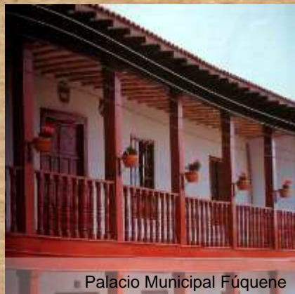
Palacio Municipal Fúquene