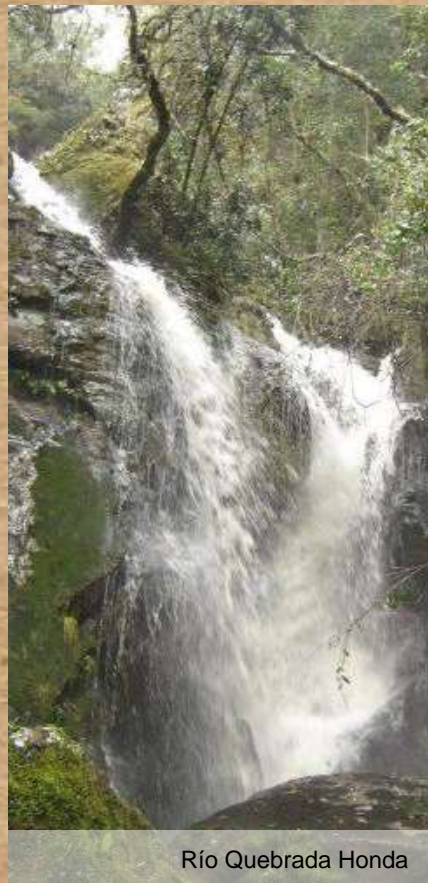
Río Quebrada Honda