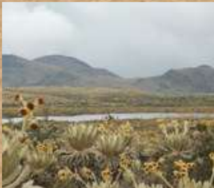
Complejo de Guerrero

El embalse se localiza en los municipios de Tausa (70%) y Cogua (30%). Es fuente de abastecimiento de agua y luz para municipios aledaños incluyendo Bogotá. Pertenece al sistema de embalses con los que la CAR regula el caudal del río Bogotá. Se ha denominado complejo de Guerrero al sistema de páramos del norte de Cundinamarca