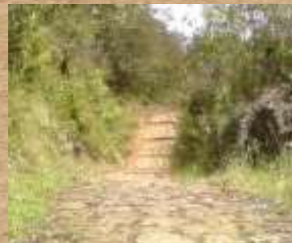
Camino al meta