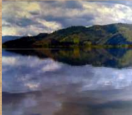
Laguna de Fúquene