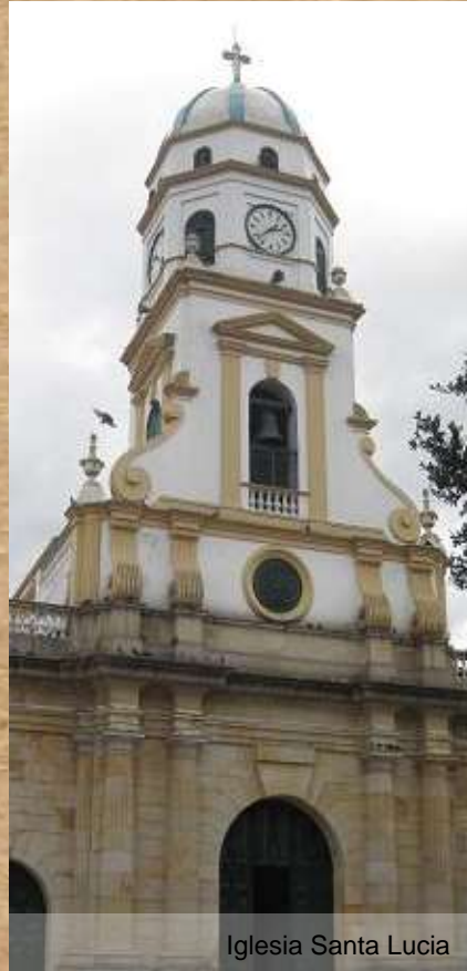
Iglesia Santa Lucia

El Cerro de la Cruz, es un lugar utilizado para peregrinación, es un sitio turístico y provee a las personas de una vista espectacular. La iglesia Santa Lucía, ubicada en el parque central o parque Santander, es considerada la iglesia más significativa. La iglesia de la Valvanera, en el cerro de la cruz es una capilla con una buena vista del municipio.