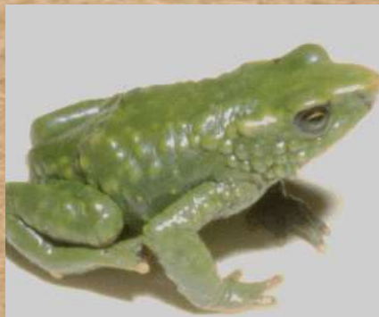
Rana Atelopus Muisca,