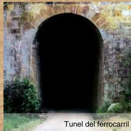
Tunel del ferrocarril