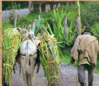
Campesino con carga de Junco

Cuerpo de agua dulce ubicado a 2540 msnm. La palabra FÚQUENE está compuesta por Fu – Quyny , que quiere decir "lecho de la zorra" o lecho del dios FO o FU , a quien le rendían culto en la isla grande de la laguna de Fúquene, después esta isla fue manejada como refugio indígena durante la conquista española. El Faro que orientaba a navegantes para el desembarque en el muelle de la isla y el puerto originalmente creado como desembarcadero, para recibir a los navegantes de la Laguna de Fúquene y a quienes llegaban a la estación de tren que se encuentra al lado en la zona de Guatancuy. Hoy es lugar turístico para hacer paseos en lancha. Mula cargando el Junco fresco, recién cortado de las inmediaciones de la laguna. Así se transporta hacia el lugar en donde permanecerá en proceso de secado