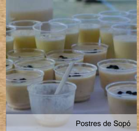
Postres de Sopó

La Iglesia Divino Salvador fue construida en 1953, bajo la dirección del arquitecto Alfredo Rodríguez, con el fin de venerar la piedra milagrosa que fue hallada 200 años atrás y que se encuentra en la cruz de plata que reposa en el altar mayor.