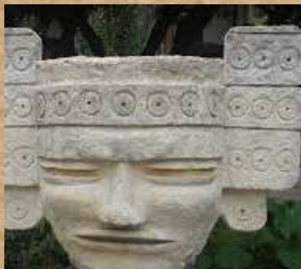
Cacique de Sopó