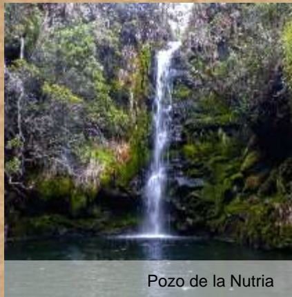
Pozo de la Nutria