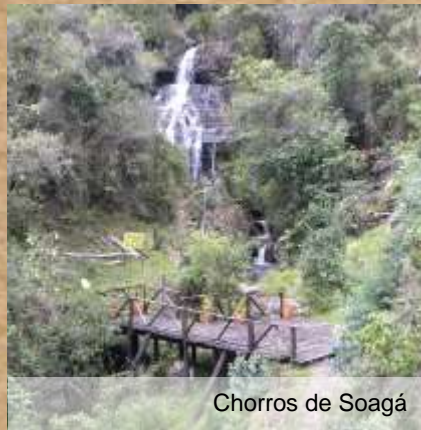
Chorros de Soagá

Cerro ubicado al costado occidental del casco urbano, es utilizado habitualmente para desarrollar actividades deportivas los fines de semana y ha sido escenario de validas departamentales de ciclismo de montaña, posee varios senderos hasta la cima de donde se aprecia parte del valle de Ubaté y el casco urbano. La quebrada de Soagá en su caída forma chorros que caen más de 4 metros.