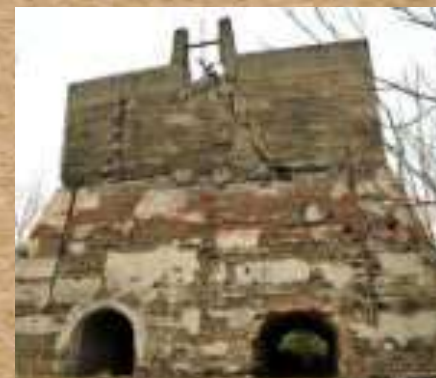
Mina de Cal