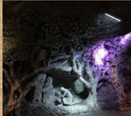
Árbol de la Vida