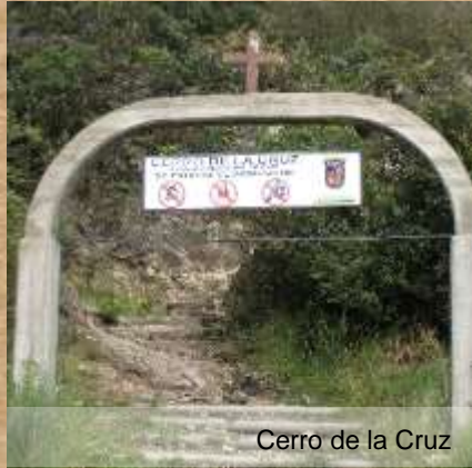
Cerro de la Cruz