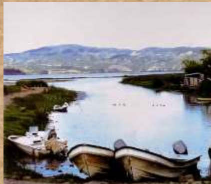
Puerto Laguna de Fúquene