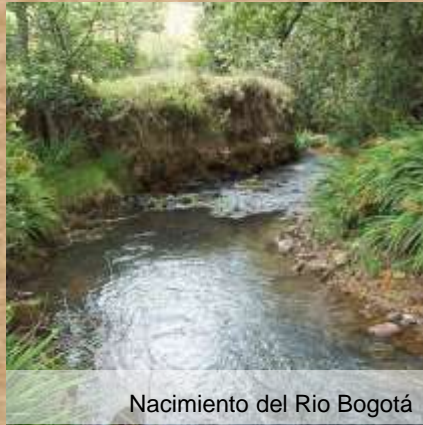
Nacimiento del Río Bogotá