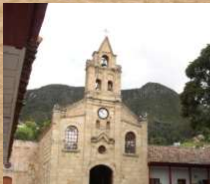
Iglesia Divino Salvador