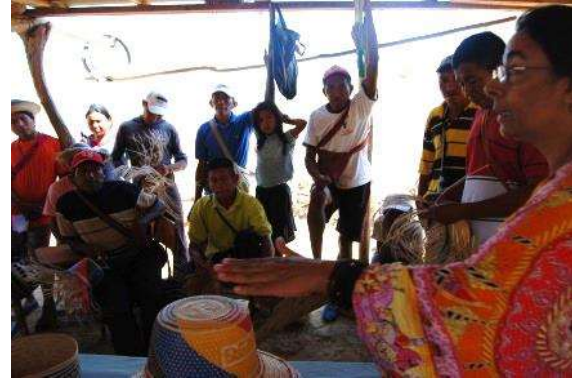
2. Apreciación de los elementos y del control de la calidad Kashsjiwoü, 12 de abril de 2016