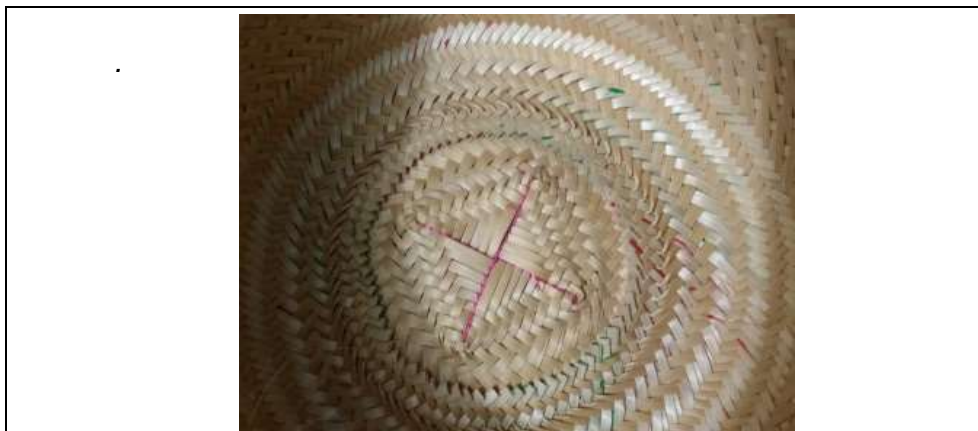
Amarre en forma de equis, inicio de la base del sombrero Kashajwoü, 12 de abril de 2016

Materia prima 2: Cuerda fina y resistente de algodón o acrílico, de origen comercial, comprada o conseguida de sobrantes de otros tejidos, que se emplea para asegurar el entretejido de cintillas en el inicio de la base del sombrero.