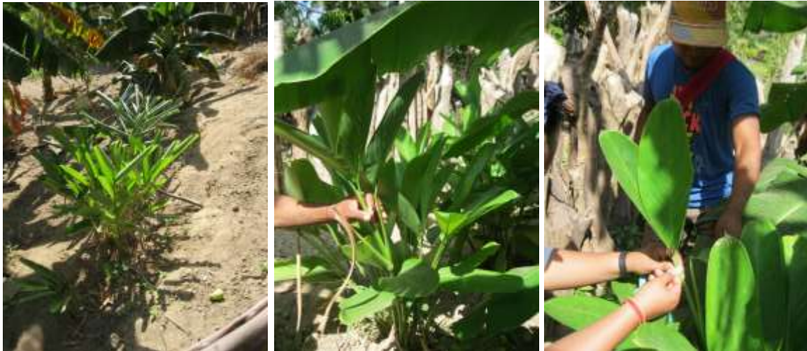
Planta de pacero o tetera, selección de los ramos Serranía de la Macuira, 13 de abril de 2016

Actualmente tienen que encargarlo a Venezuela, a la Serranía del Perijá, a la Costa Colombiana o comprarlo a vendedores que cobran a cinco mil pesos colombianos un rollo que contiene de treinta a cuarenta cintas de entre cuatro y cinco centímetros de ancho por treinta o cuarenta de largo, que alcanza para tejer tres o cuatro sombreros.