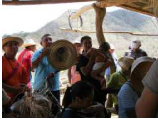
1. Presentación y reconocimiento de los tejedores Kashsjiwoü, 12 de abril de 2016