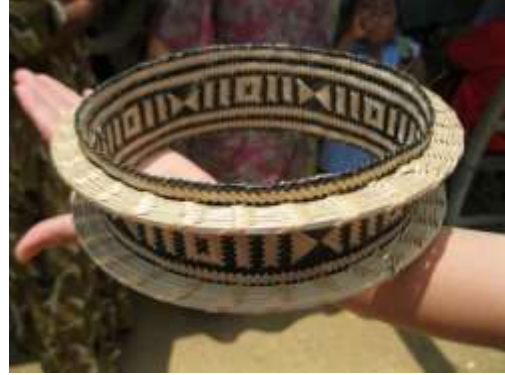
Aro o corona del Karrats, objeto ceremonial Comunidad Kajashiwou -12 de Abril de 2016 – Fotografía: Marta Ramírez y Melisa Sánchez