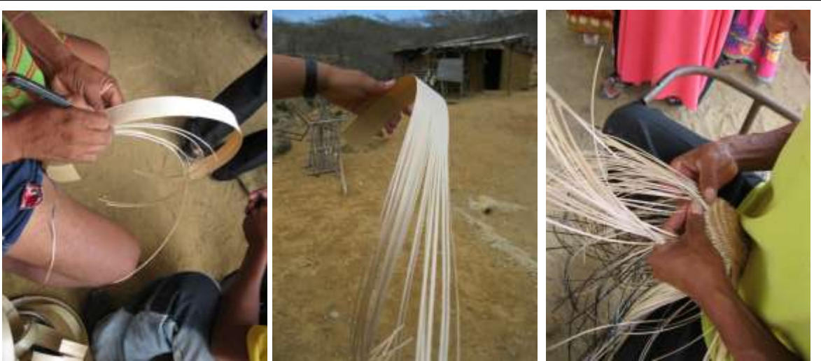
Obtención de las cintillas con cortes paralelos, mitad de la cinta cortada y comienzo de un tejido. Serranía de la Macuira, 13 de abril de 2016

La mayor problemática frente al aprovisionamiento de la materia prima, a la sostenibilidad de la actividad y a la de los mismos Wayuu, es la sequía.