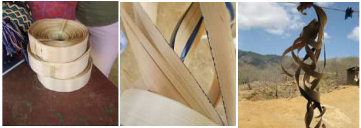
Rollo de cinta, alistado de la cinta, cintas pintadas ya secas Serranía de la Macuira, 13 de abril de 2016 – Fotografía: Marta Ramírez Cedavida – Artesanías de Colombia