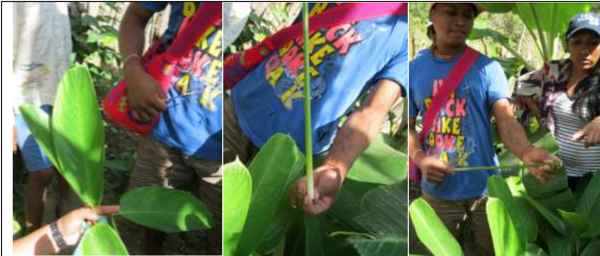
Selección de los ramos aptos con tres hojas y corte y dimensiones del tallo Serranía de la Macuira, 13 de abril de 2016

Materia prima 2: Cuerda fina y resistente de algodón o acrílico, de origen comercial, comprada o conseguida de sobrantes de otros tejidos, que se emplea para asegurar el entretejido de cintillas en el inicio de la base del sombrero.