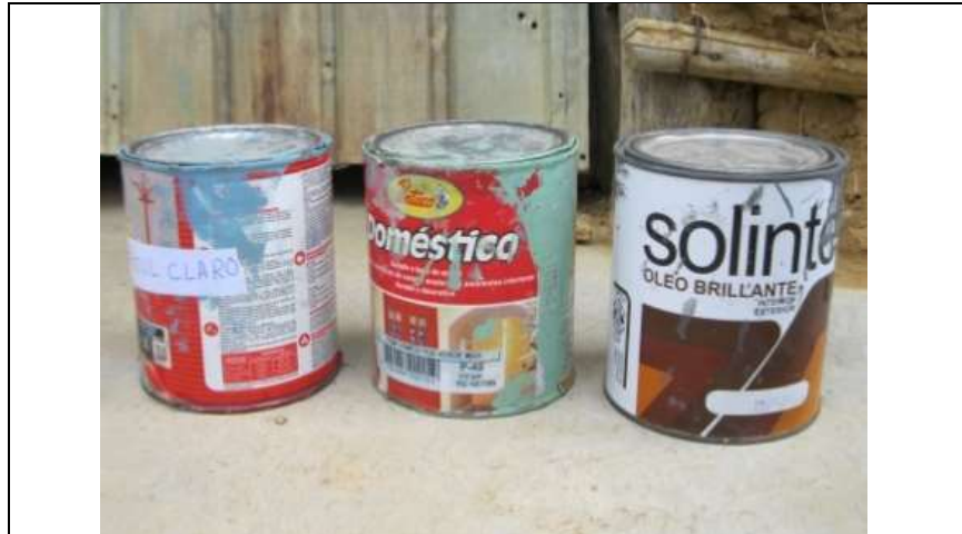
Pinturas de aceite Kashajiwoü, 12 de abril de 2016