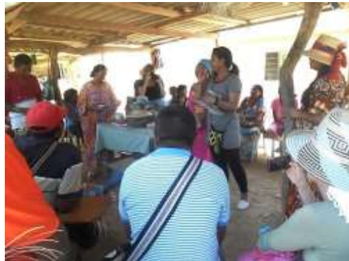
3. Elección de tareas, estímulo a lo tradicional y a la innovación Kashsjiwoü, 12 de abril de 2016