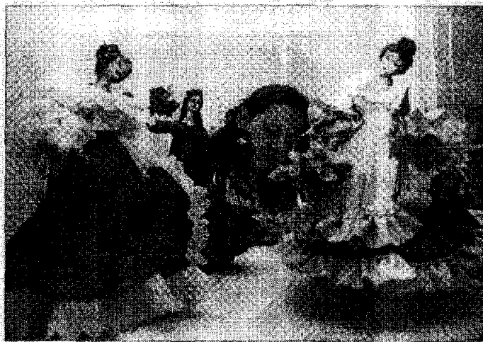
Eliécer Santanilla, La Crónica

Una amplia muestra de productos manuales elaborados en la región fue reunida para seleccionar los empresarios que se vincularán al programa Expopyme-Artesanías.