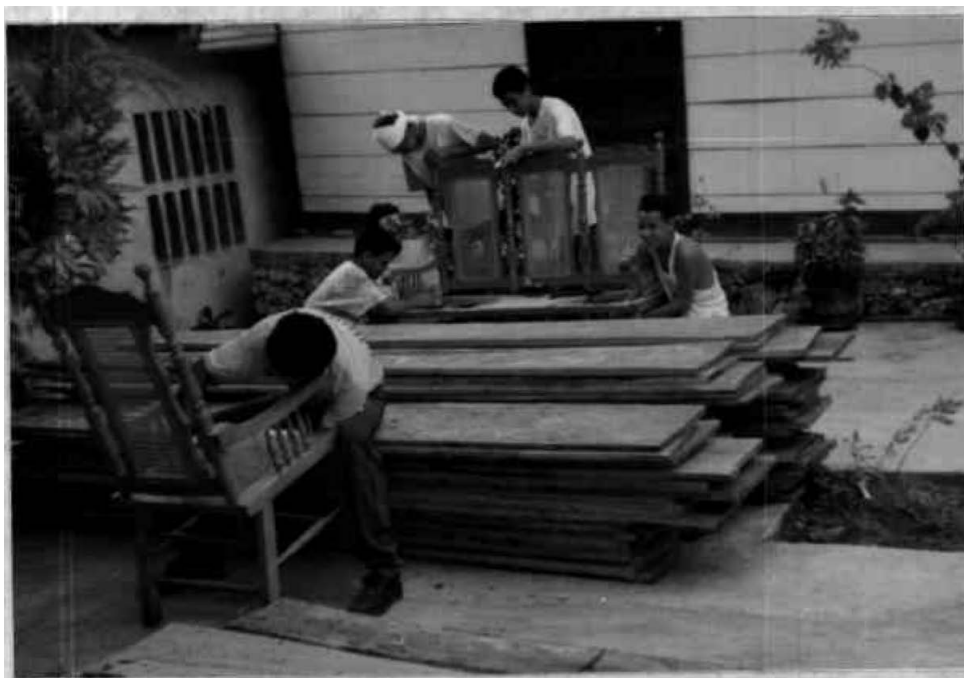
PROVISION DE MATERIA PRIMA- ACABADO DE MUESTRAS.