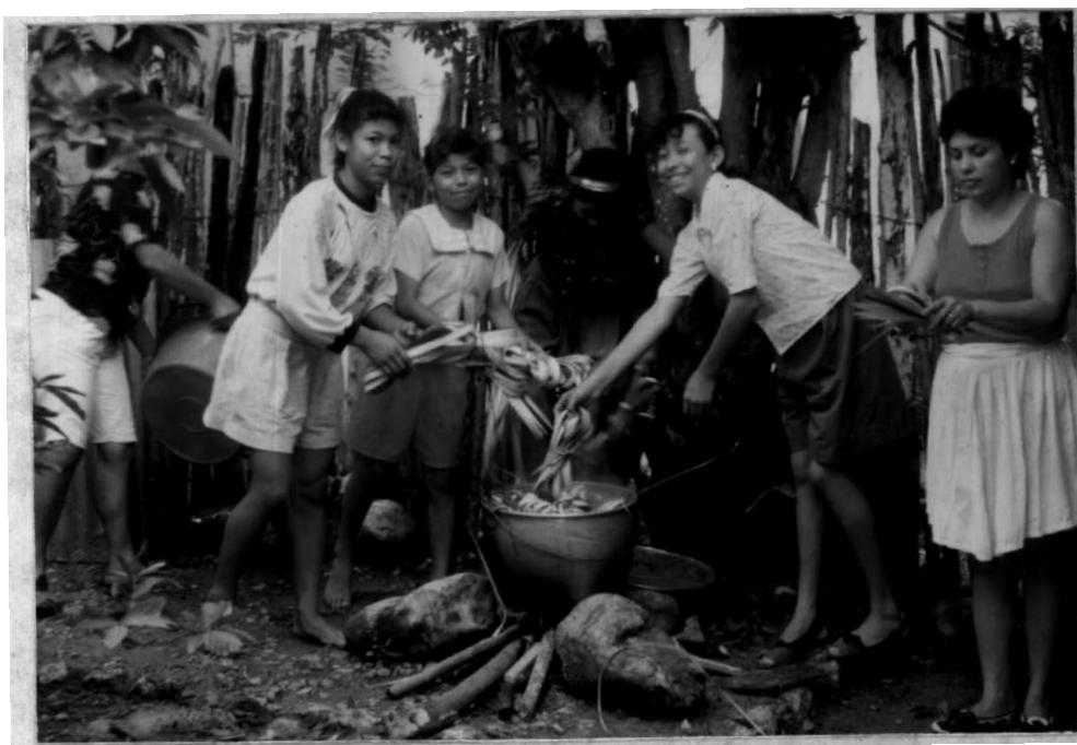
PROCESAMIENTO DE LA MATERIA PRIMA- (COHECION ).