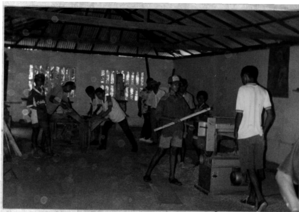
PROCESAMIENTO DE LA MATERIA PRIMA.