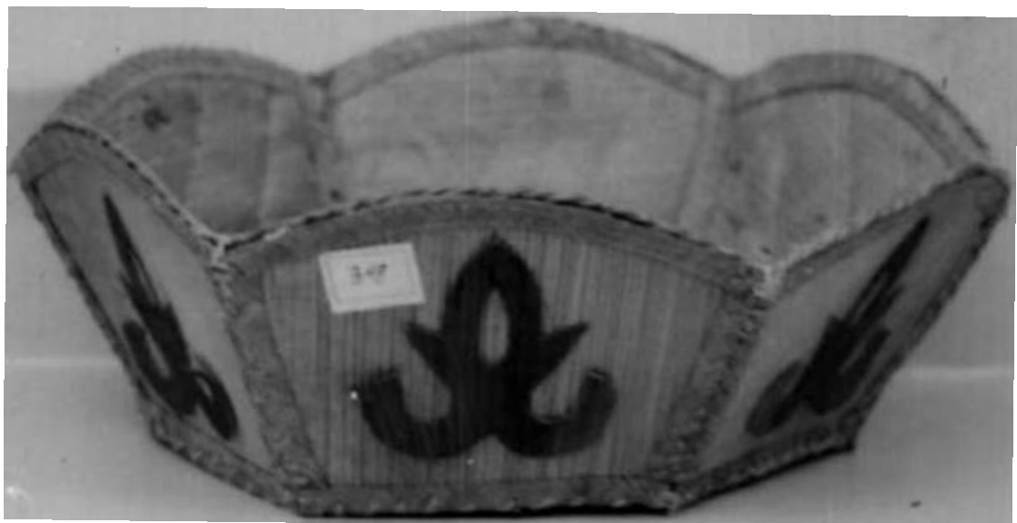
MUESTRA ELABORADA EN CEPA DE PLATANO.