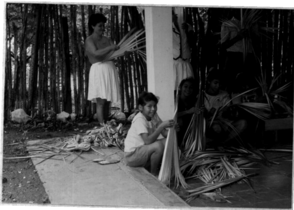
PROVISION DE MATERIA PRIMA- ( IRACA ).