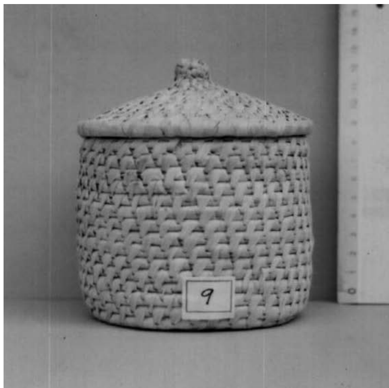
MUESTRA ELABORADA EN IRACA.