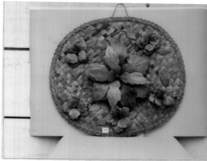
MUESTRA ELABORADA EN CEPA DE PLATANO.