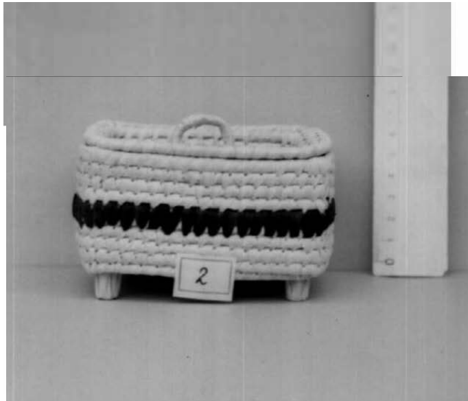
MUESTRA ELABORADA EN IRACA.