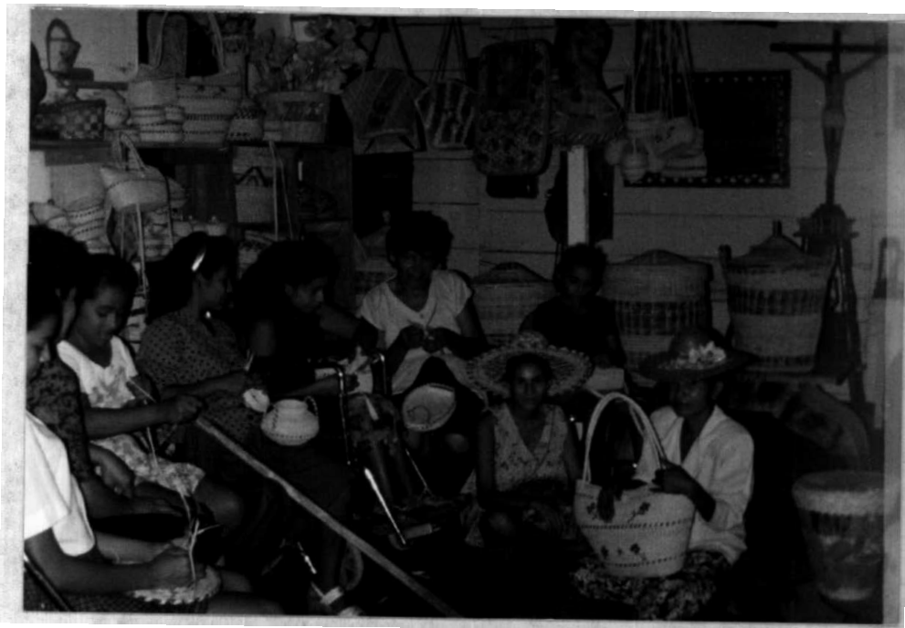
PROCEDIMIENTO DE ENSEÑANZA APRENDIZAJE LA ELABORACION DE PRODUCTOS.