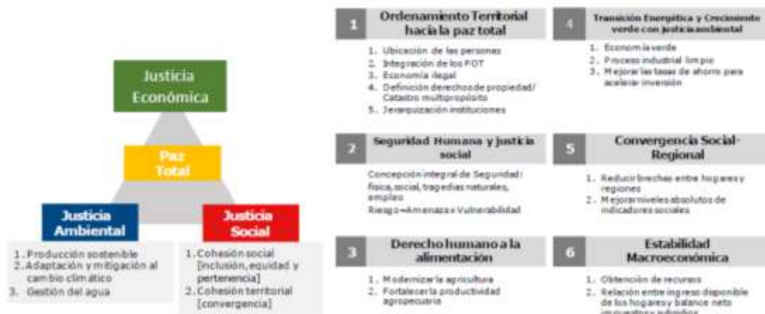
Gráfica No. 2. Apuestas PND

Contribuir a la convergencia social - regional