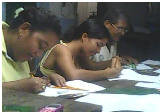
Lugar: Mompox Fecha : Agosto de 2009 Descripción: Dibujando sobre el papel