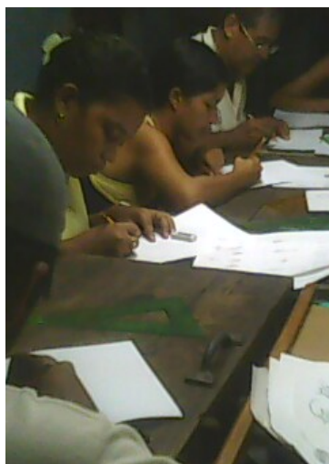
Lugar: Mompox Fecha : Agosto de 2009 Descripción: Proceso creativo