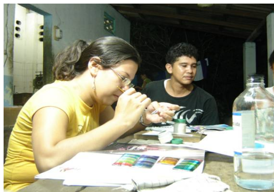
Lugar: Mompox Fecha : Agosto de 2009 Descripción: Proceso creativo