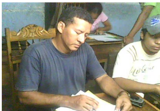
Lugar: Mompox Fecha : Agosto de 2009 Descripción: Dibujando sobre el papel