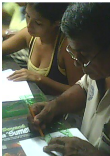
Lugar: Mompox Fecha : Agosto de 2009 Descripción: : Realizando los primeros módulos