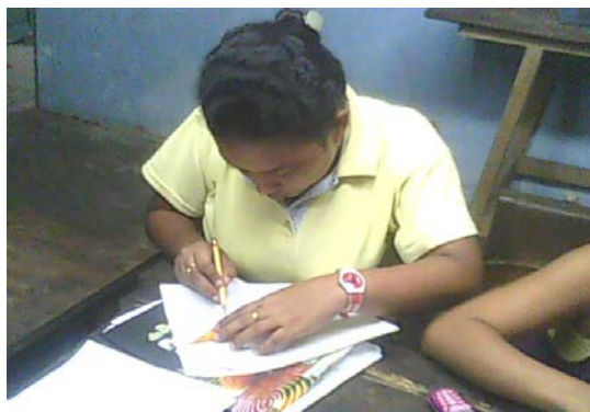
Lugar: Mompox Fecha : Agosto de 2009 Descripción: Proceso creativo