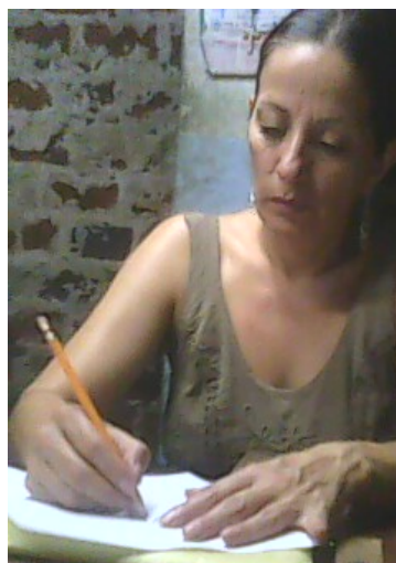
Lugar: Mompox Fecha : Agosto de 2009 Descripción: Proceso creativo

“Proyecto para el desarrollo de nuevos productos y el mejoramiento de la producción y la comercialización de 10 localidades joyeras artesanales, pertenecientes al eslabón de la joyería de la cadena productiva de la industria de la joyería, metales, piedras preciosas y bisutería en Colombia” Proyecto MN045-7