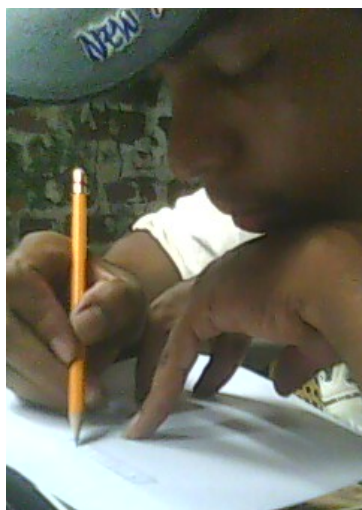
Lugar: Mompox Fecha : Agosto de 2009 Descripción: Proceso creativo