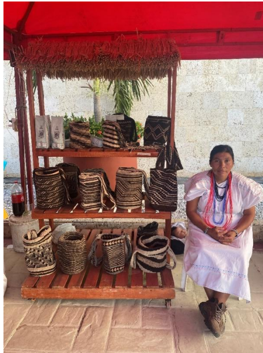
Ilustración 5 Stand del grupo ASOARHUACO