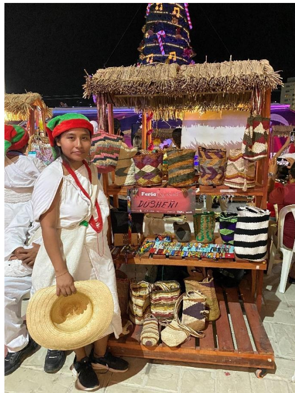
Ilustración 12 Stand Dusheñi - día 3