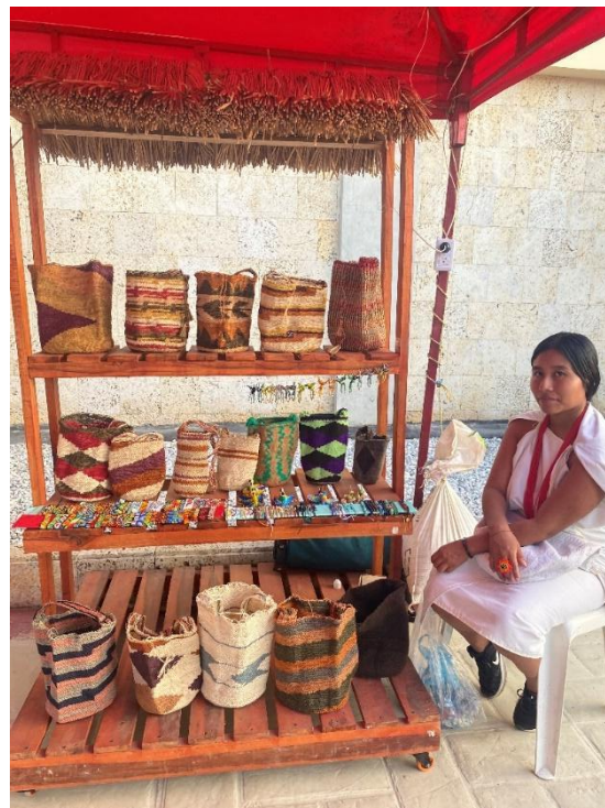
Ilustración 6 Stand grupo artesanal Dusheñi - Comunidad Wiwa