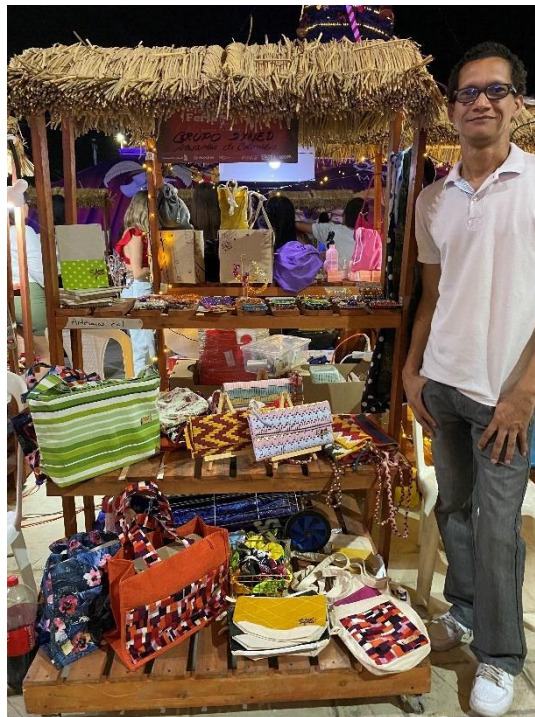
Ilustración 14 Stand Syned - día 3