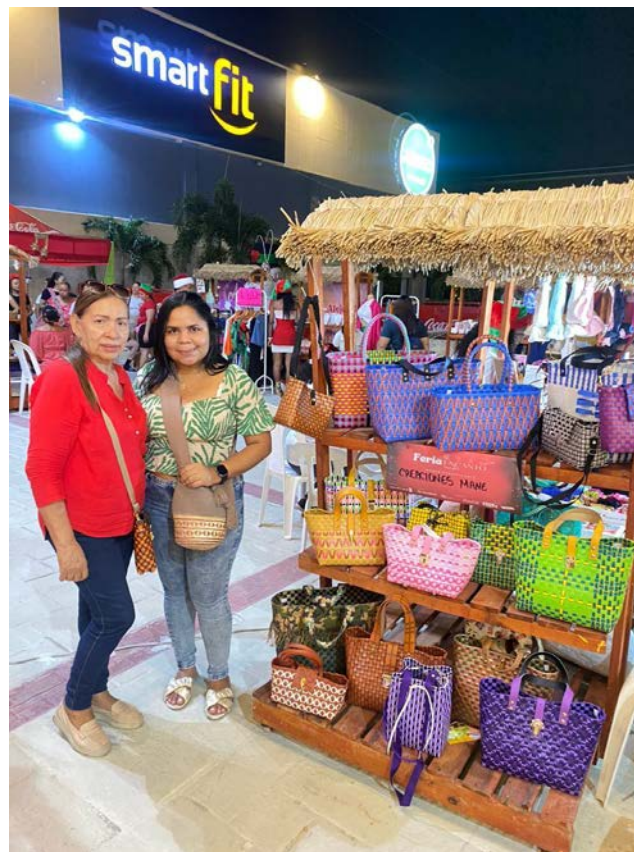
Ilustración 3 Visita de la gestora territorial a los stands

En paralelo, se contó con el valioso respaldo de la gestora territorial, quien contribuyó invitando a los grupos participantes y estuvo presente de manera activa durante toda la feria.