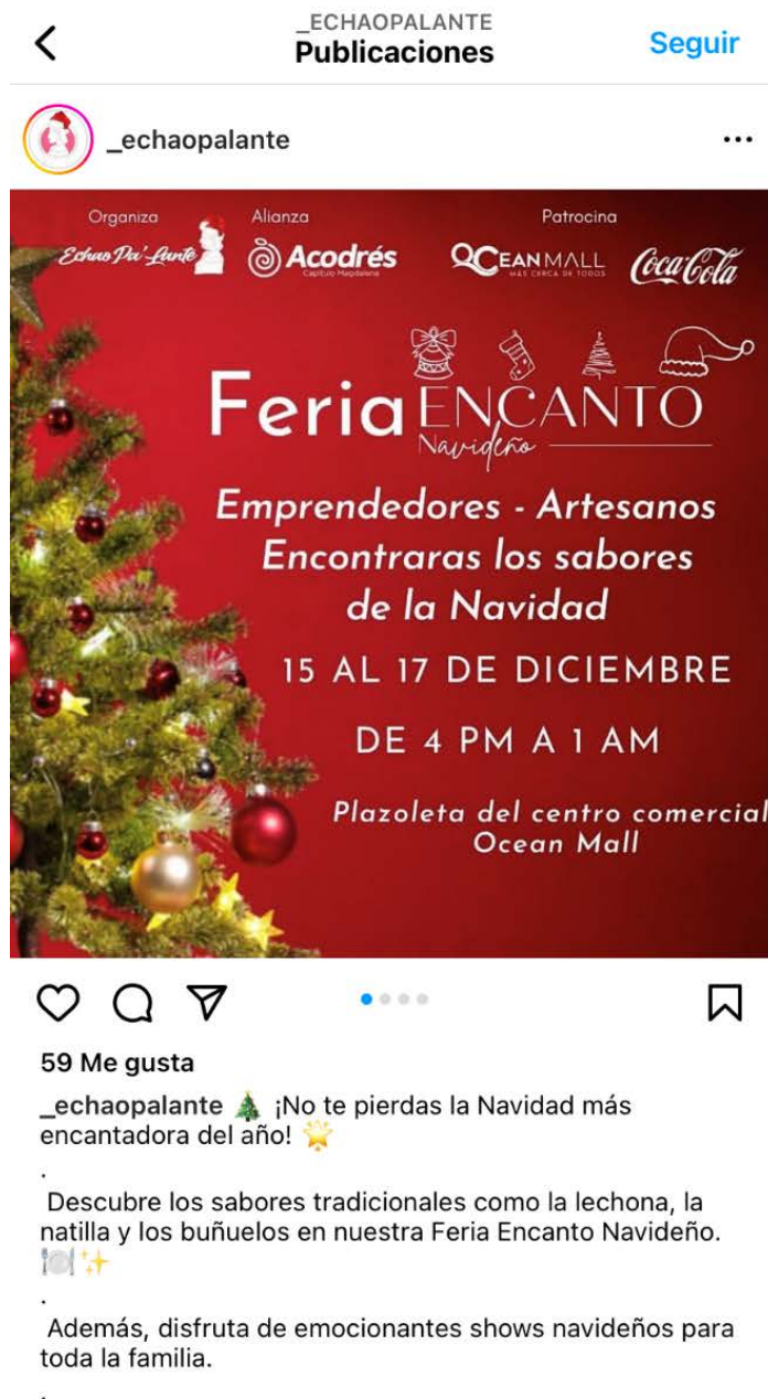
Ilustración 1 Promoción de la Feria en el Instagram de Echaopalante

En cuanto a la difusión y promoción de la feria, los organizadores promocionaron e hicieron cubrimiento del evento a través de sus cuentas oficiales en la red social Instagram.