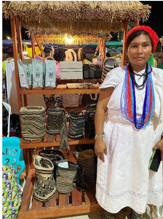
Ilustración 13 Stand Asoarhuaco - día 3