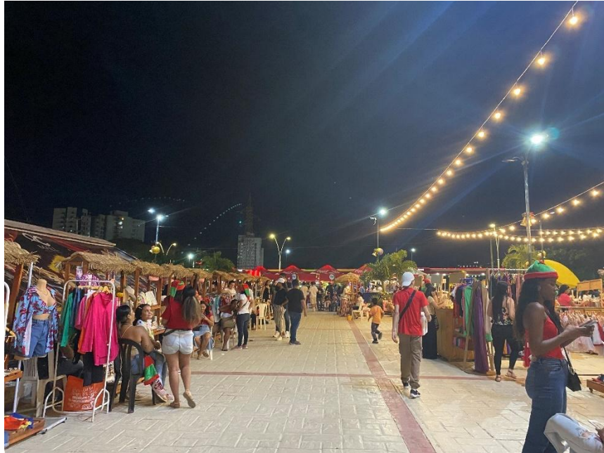
Ilustración 9 Vista general de la Feria