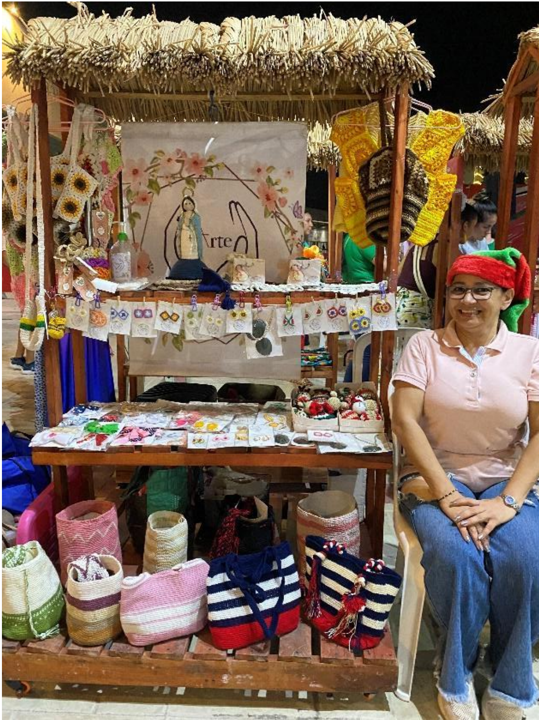
Ilustración 15 Stand Arte Manos - día 3