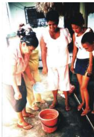
Barbotina para colada