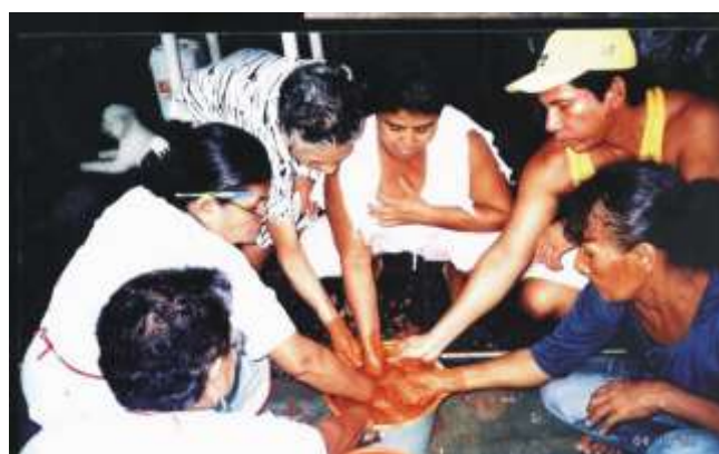
Reconocimiento de la barbotina después del silicato de sodio

Explicación y soluciones de problemas y accidentes que pueden presentarse como la filtración del yeso o fraguado precoz.