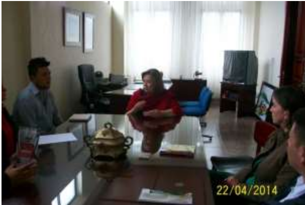
Alcaldía de Aguadas

Se desarrollaron temas para el desarrollo de propuestas de intervención por parte de Artesanías de Colombia con la Alcaldesa y funcionarios de la unidad de turismo del municipio.