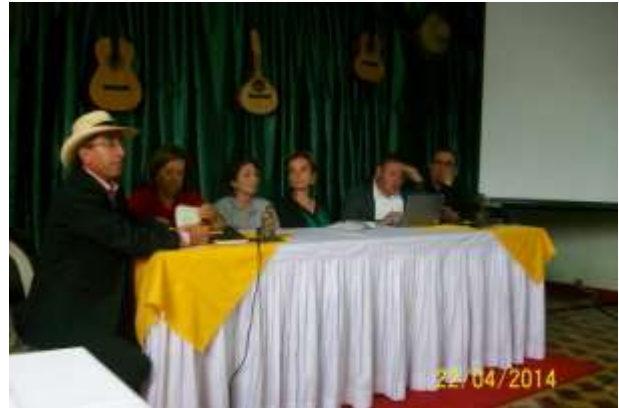
Casa de la Cultura Aguadas