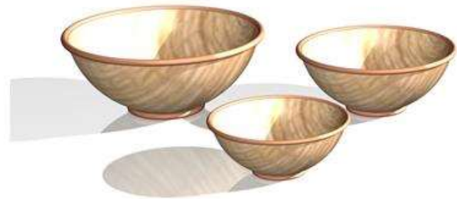
Contenedores en iraca Agudas Caldas