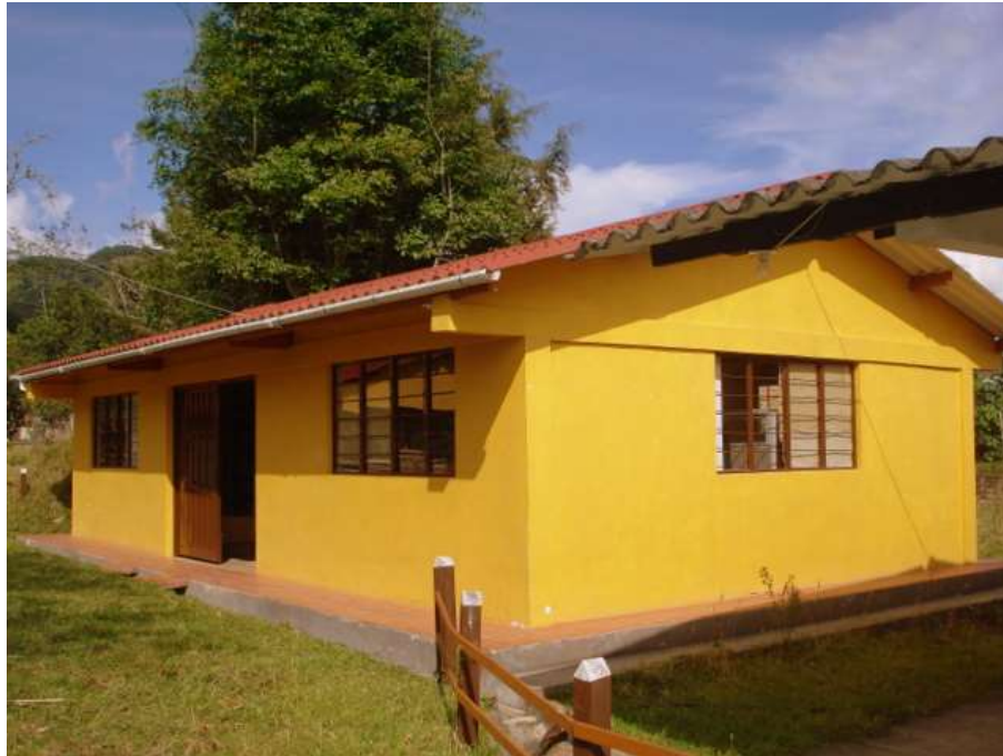
Foto 1. Local Laboratorio Putumayo – Artesanías de Colombia, Sibundoy Putumayo (Francisco Ayala)