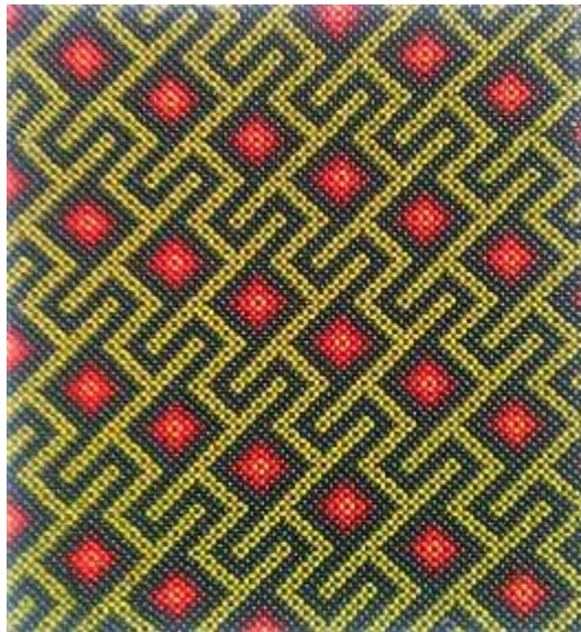
Foto 7 Muestras de tejido en chaquiras