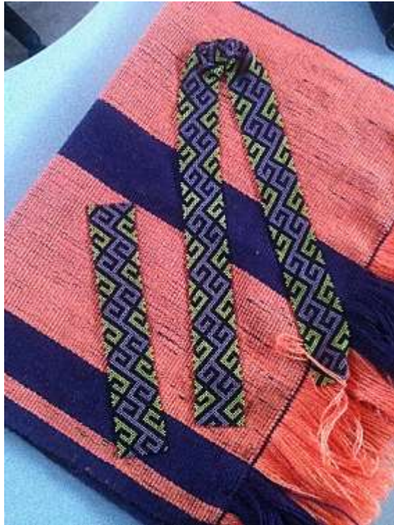
Foto 6 Muestras de tejido en telar de guanga y tejido en chaquiras