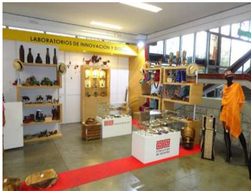
Foto 5. Stand Institucional Laboratorios de innovación y diseño

4.5.2 Capacitación conceptos básicos de medidas antropométricas para el diseño de mobiliario.