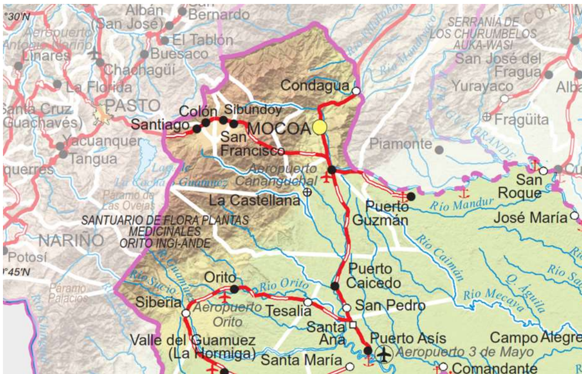
Mapa 1 Departamento de Putumayo – Región del Alto Putumayo Municipios de Santiago, Colón, Sibundoy y San Francisco.