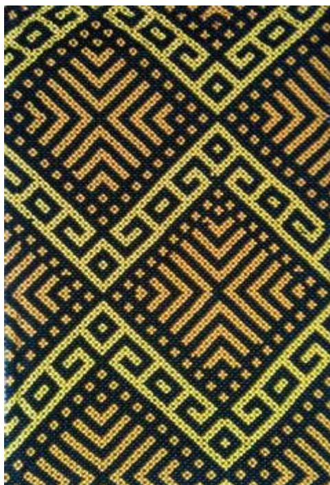
Foto 8 Muestras de tejido en chaquiras