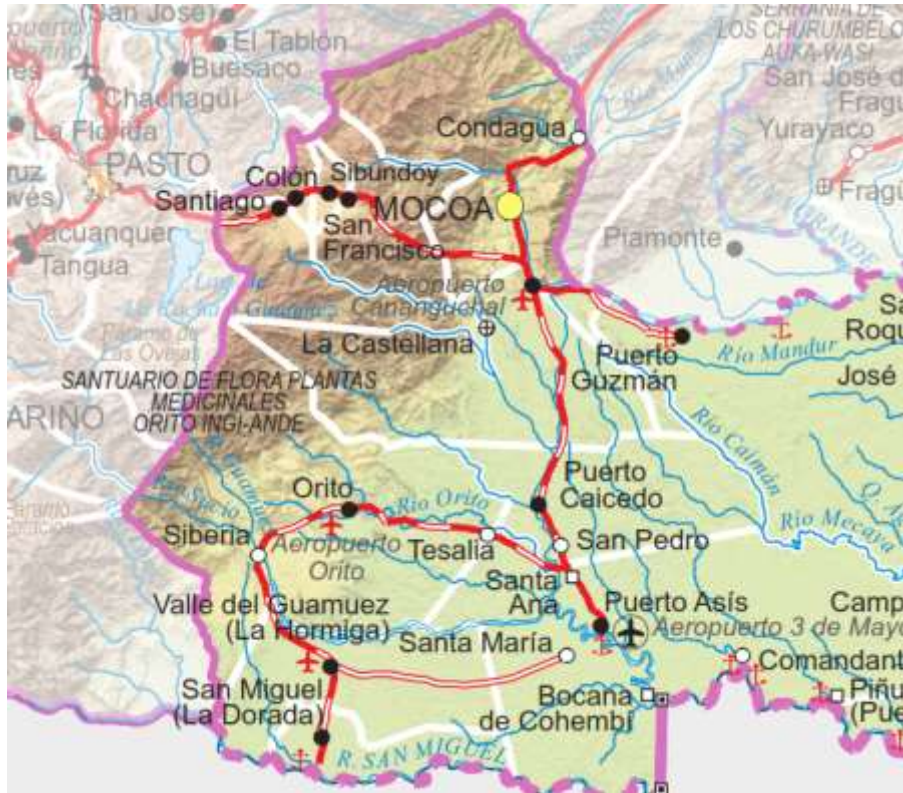
Mapa 3 Municipios de Mocoa, Puerto Asís, San Miguel y Orito – Departamento de Putumayo