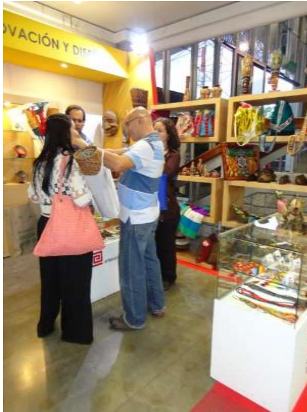
Foto 4. Stand Institucional Laboratorios de innovación y diseño