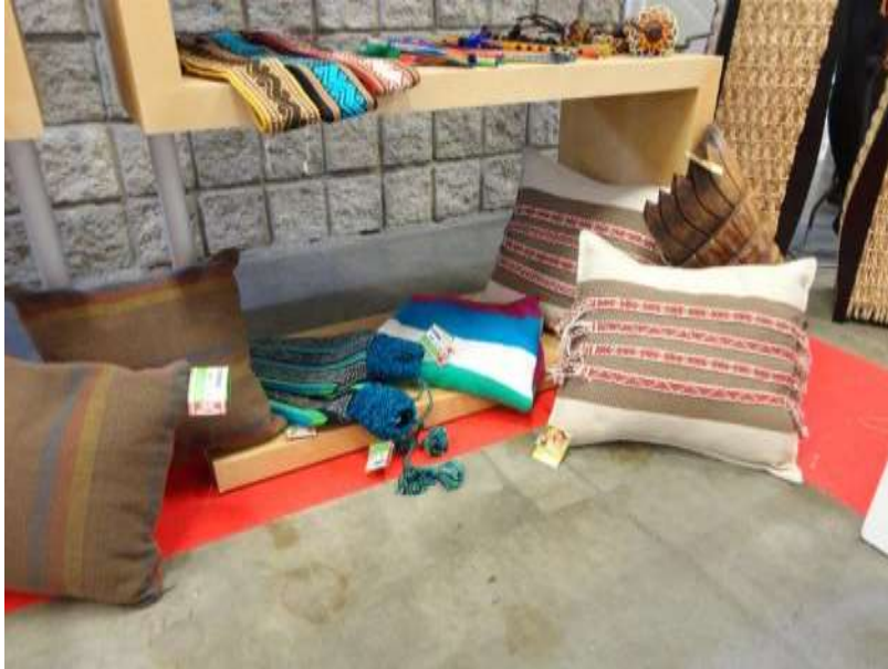
Foto 3. Productos artesanales stand Laboratorios de innovación y diseño

Las ventas producto de la comercialización del productos artesanales son de $1.574.500.00, con ventas en efectivo de $ 1.109.000.00 con tarjeta debido de $86.000.00 y $ 379.500 con tarjeta de crédito.