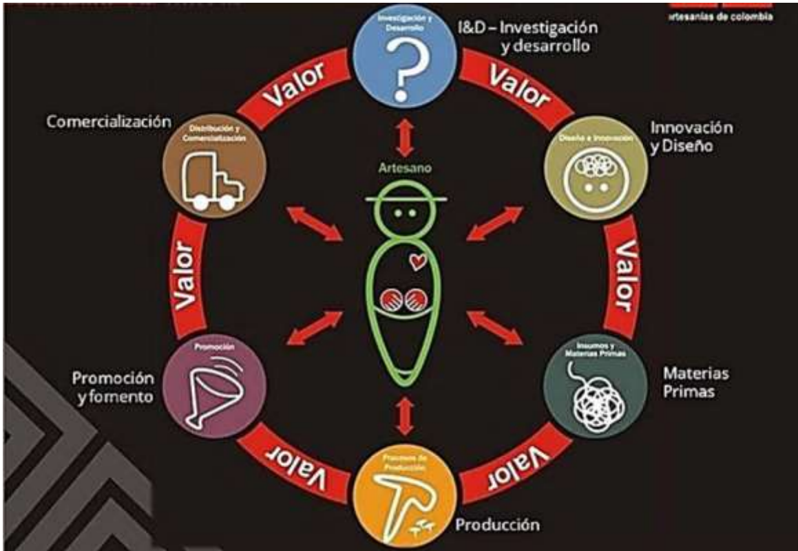
Gráfico 1 Cadena de Valor del sector Artesanal

El proyecto plantea las siguientes inversiones: