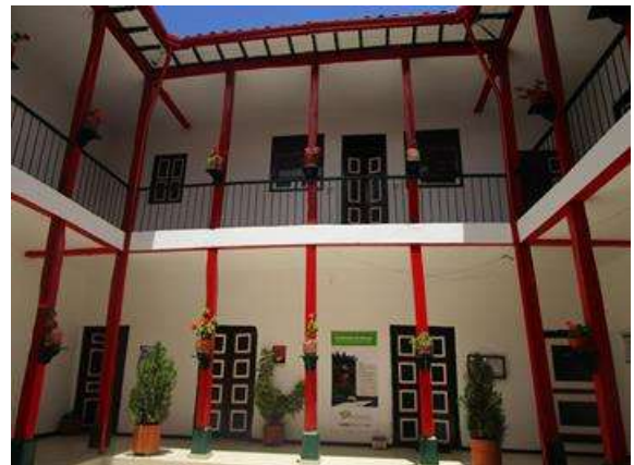
Foto e investigación: Roberto Alfonso S., Antropólogo Asesor. CedaVida. 2014.

Biblioteca de El Cocuy, ubicada en el centro urbano del Municipio. Allí se realizan actividades académicas, formativas, reuniones comunitarias y eventos culturales.