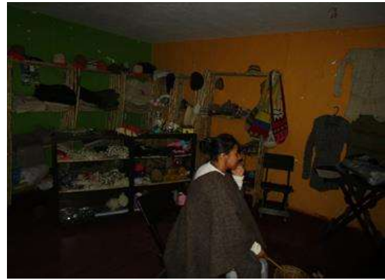
Foto e investigación: Roberto Alfonso S., Antropólogo Asesor. CedaVida. 2014.

Punto de Venta y sede de la Asociación El Mundo Mágico de la Lana. Como puede apreciarse, la sede no cuenta con ventanas hacia el exterior, por lo cual el espacio es demasiado oscuro para exhibir adecuadamente los productos.