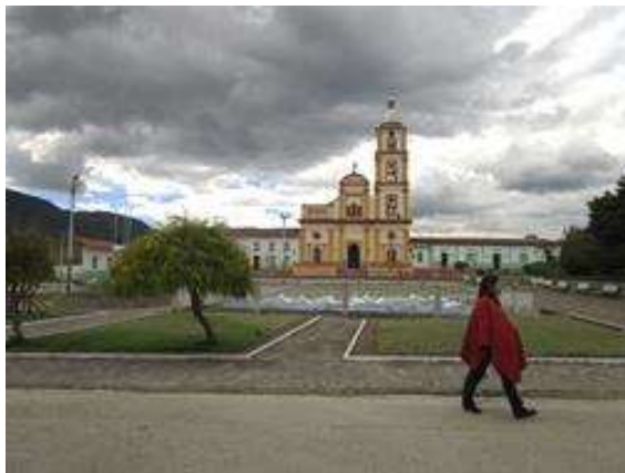
Imagen de la Iglesia de El Cocuy, uno de los referentes geográficos más importantes del Municipio, debido a su arquitectura, antigüedad y estado de conservación.

El Cocuy limita al norte con los municipios de Panqueba y Guicán, al oriente con el municipio de Tame (Arauca), al occidente con los municipios de La Uvita y San Mateo y por el sur con los municipios de La Salina y Chita.