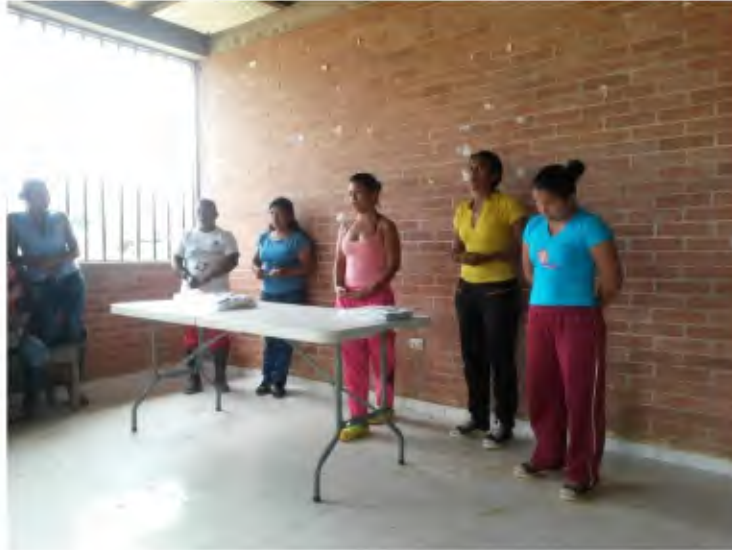
Fotografía 1. Dramatización de situación problema

Fuente: Andrea Bravo. Taller de proyecto de vida, noviembre de 2014