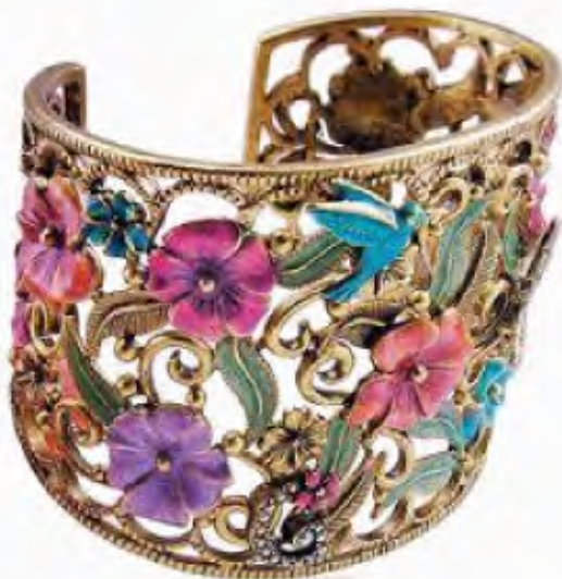
Brazalete elaborado en zamak y esmaltes en frio, autor anónimo

Adaptación del francés “Bijouteri” que corresponde a objetos de adorno elaborados en materiales no preciosos.