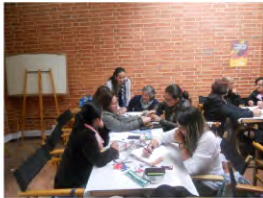
Imágenes taller de Bisutería. en la Plaza de los artesanos, el día 17 de Octubre de 2014

Los asistentes al taller colaboraron de manera activa en todo lo que se planteó para este día y se mostraron muy agradecidos con la información suministrada.