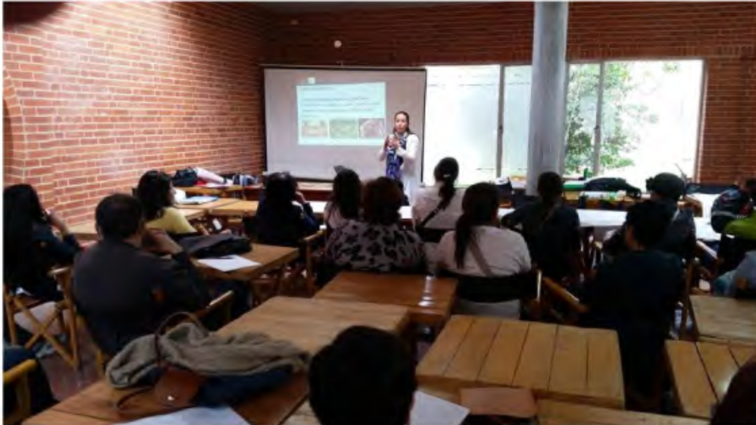
Imágenes taller de Bisutería.  en la Plaza de los artesanos, el día 17 de Octubre de 2014.

Esta presentación, aclara, qué es bisutería y los diferentes tipos de esta que existen en el sector de Bogotá. Se habla del sector como tal en Bogotá y tipo de piezas que se trabajan en la actualidad.