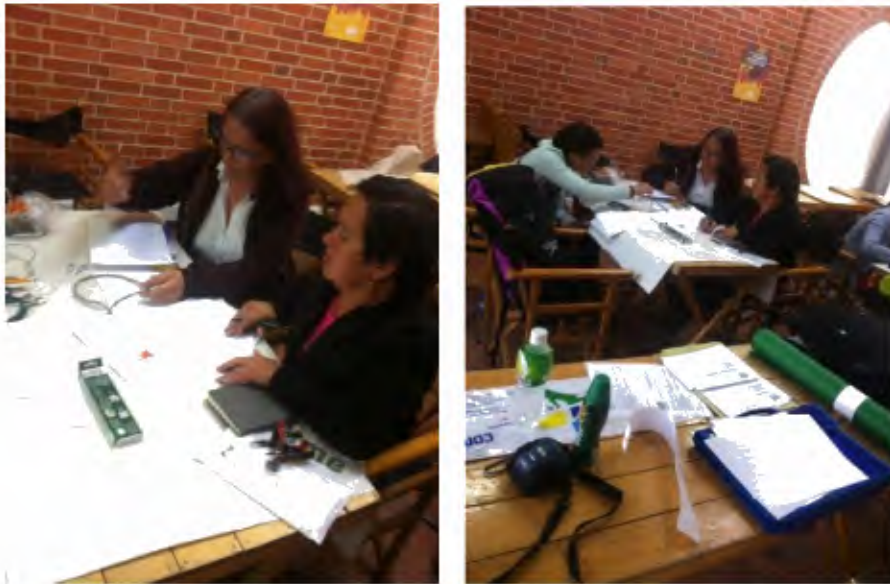
Imágenes taller de Bisutería. en la Plaza de los artesanos, el día 17 de Octubre de 2014.

Se deja planteada la posibilidad, de la entrega de cartillas con el material de apoyo del taller, posteriormente, ya que consideran que el tema es de gran aporte, para su trabajo y su desempeño en el mismo.