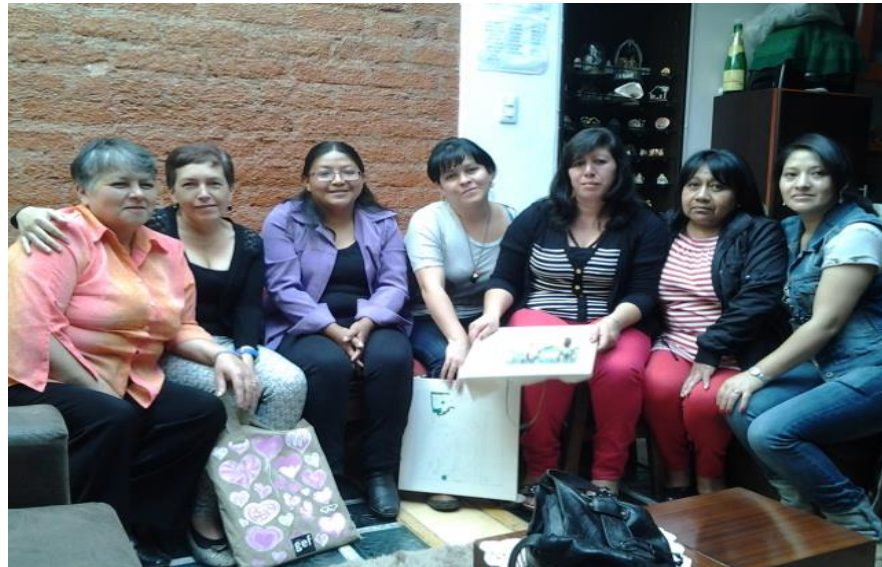
Grupo de artesanas Agujitas de Lucy Municipio de Pasto Fotografía Aida Ines Portilla Ceron Acesora