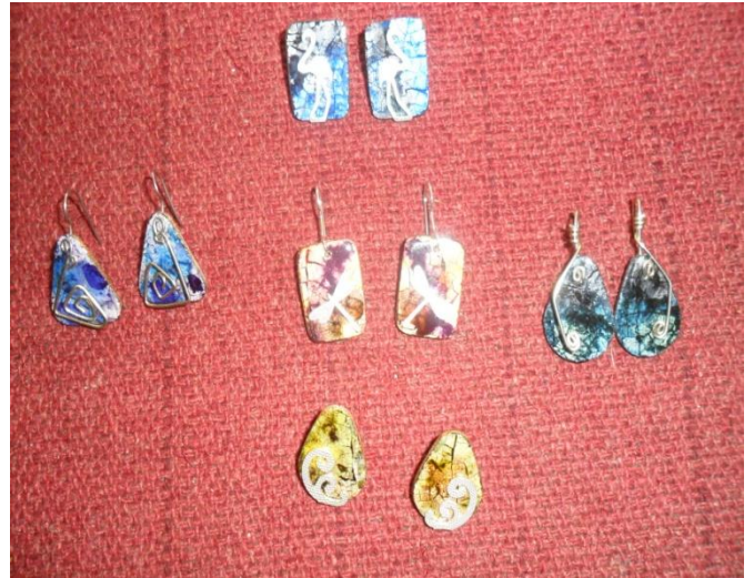
Artesanías de joyería elaborada en papel mache y plata Municipio de Pasto