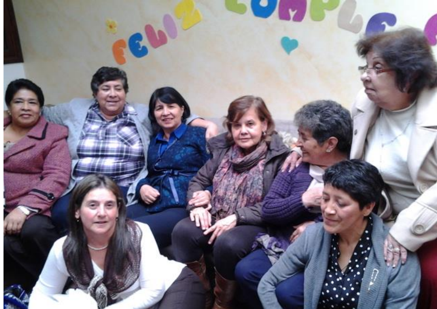
Grupo de artesanas Agujitas de Lucy Municipio de Pasto