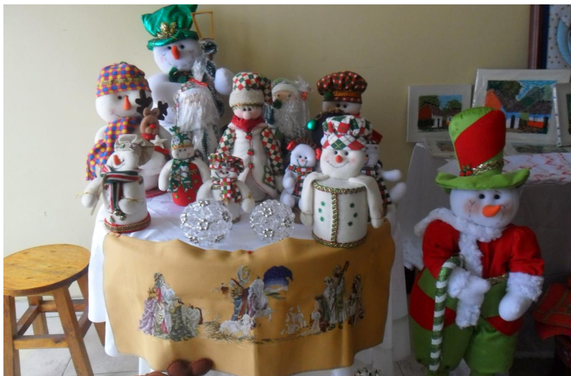
Articulos navideños elaborada por Agujitas de Lucy Municipio de Pasto