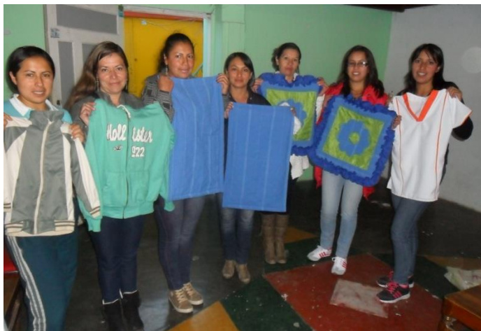
Municipio de Yacuanquer Fotografía Aida Ines Portilla Ceron Acesora

Chaleco elaborado en lana por las artesanías Municipio de Yacuanquer Fotografía Aida Ines Portilla Ceron Acesora