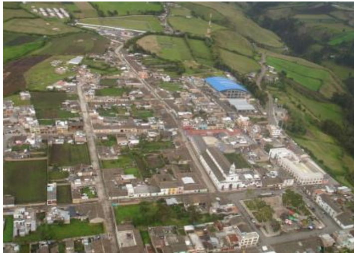
Panorámica municipio de Yacuanquer

Fundado por Lorenzo de Aldana a mediados del mes de Octubre de 1539 en el Valle de Huacanquer, hoy Yacuanquer "pueblo de historia, paz y gente amable, trabajadora y progresista" y el que fue el asiento fundacional de la Villa Viciosa de