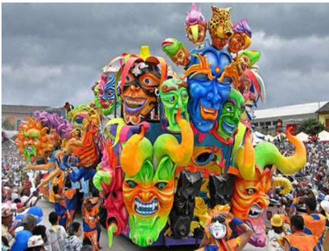
Los artesanos identificados dentro del proyecto, conformaron el equipo de Trabajo en la elaboración de la carroza. Técnica Papel Mache.