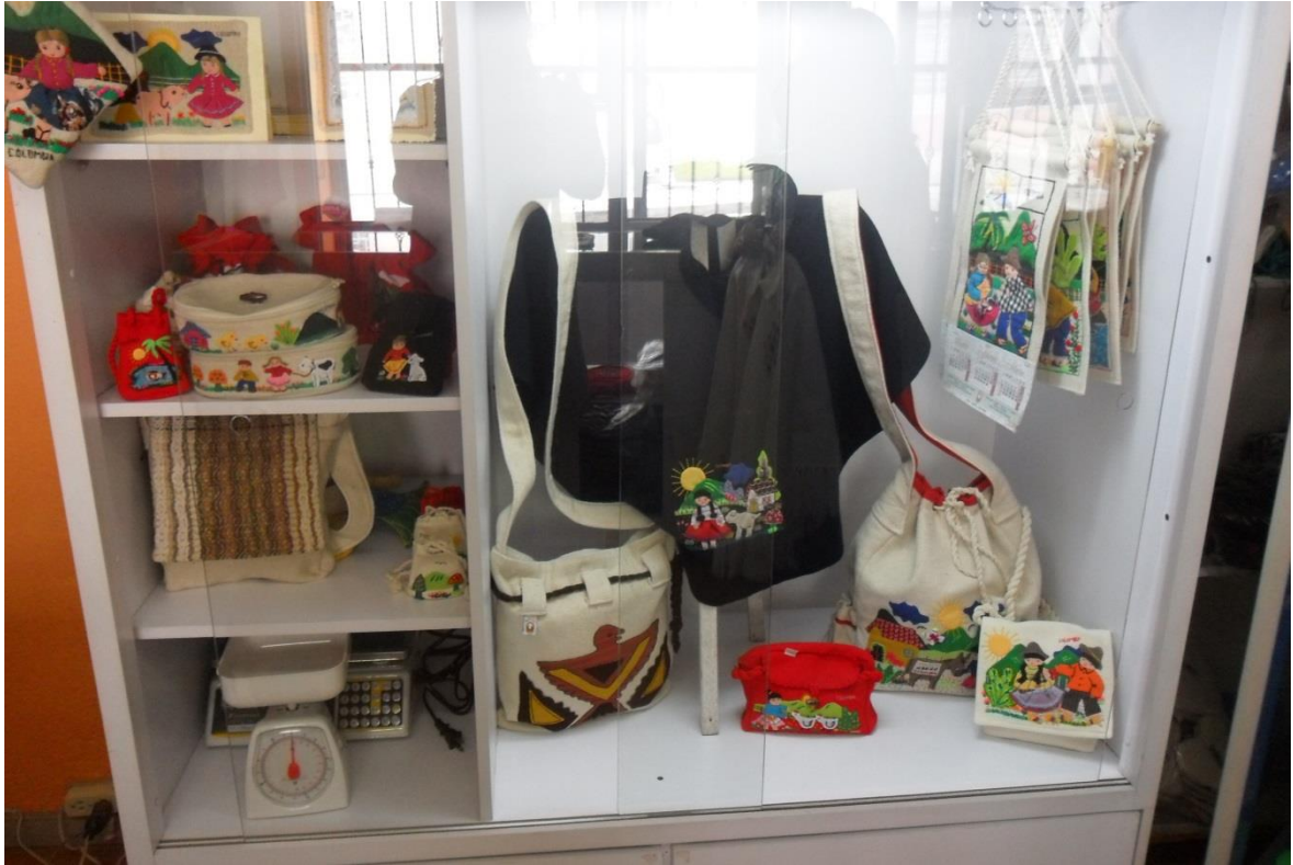
Artesanías elaborada en telar Cooperativa ECOTEMA Municipio de Pasto