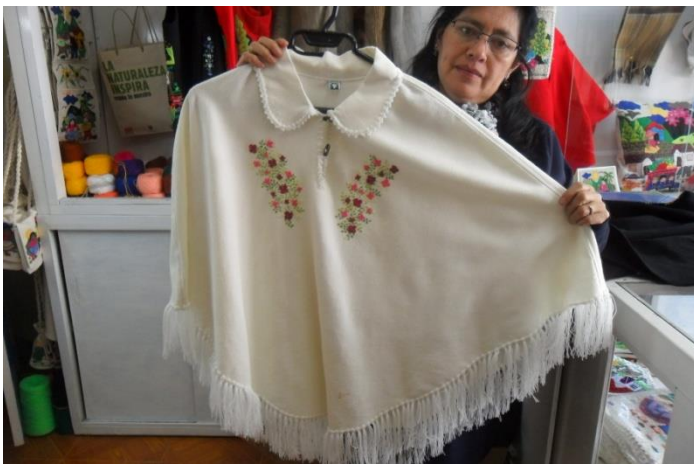
Artesanias elaborada telar y bordada Cooperativa ECOTEMA Municipio de Pasto