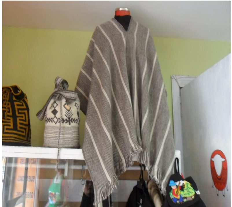
Artesanias elaborada en telar Cooperativa ECOTEMA Municipio de Pasto