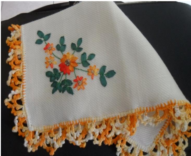
Artesanías elaborada por Agujitas de LucyCroche y Bordado en cintas Municipio de Pasto