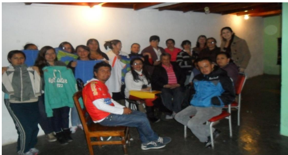
Grupo de Artesanas Municipio de Yacuanquer Fotografía: Aida Inés Portilla Cerón Asesora