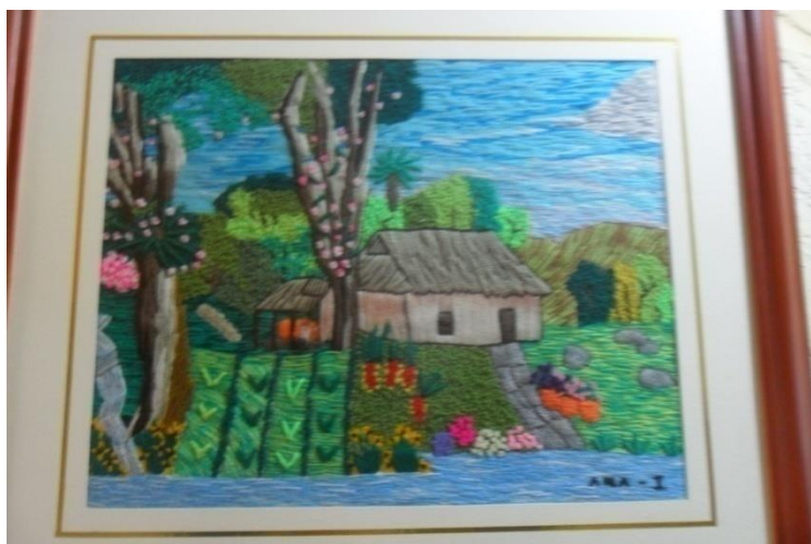
Cuadros artisticos elaborada por Agujitas de Lucy Municipio de Pasto