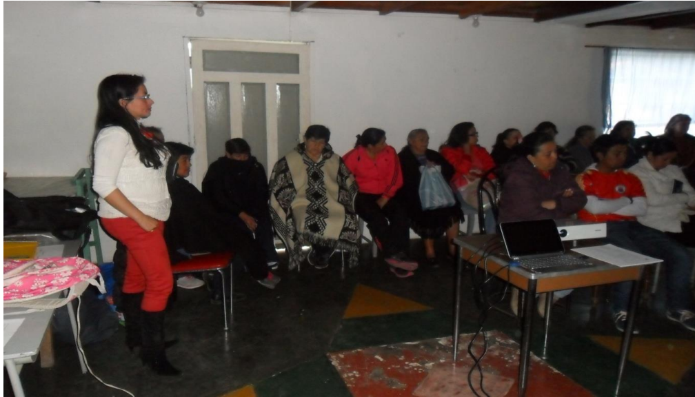
Grupo de Artesanas Municipio de Yacuanquer Actividad: Socialización del proyecto "Hilando redes humanas de vida" Fotografía: Aida Inés Portilla Cerón Asesora