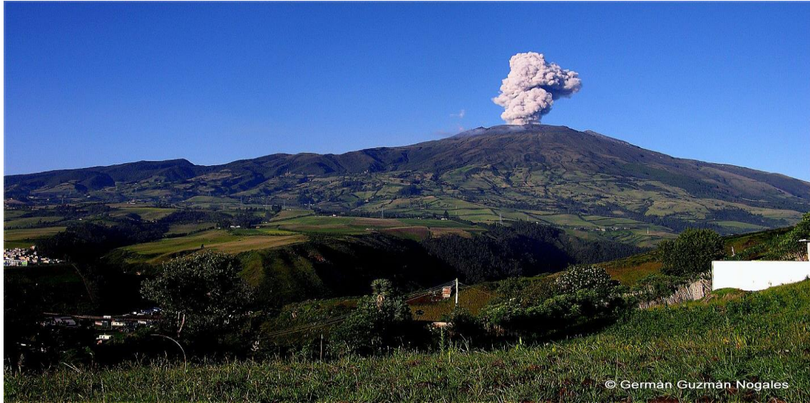
Municipio de San Juan de Pasto volcán Galeras