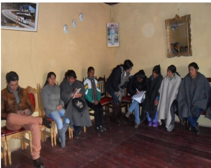
Grupo de Artesanas Asociación Mucumar sector urbano Municipio de Cumbal