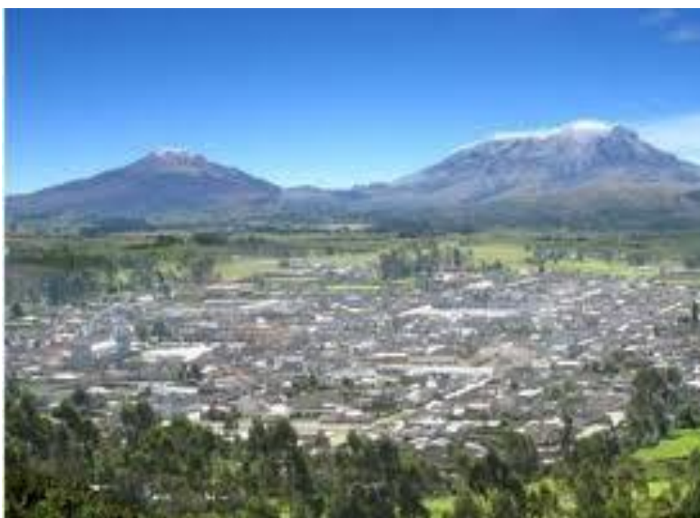
Municipio de Cumbal Volcánes: Chiles y Cumbal

Según distintas versiones históricas, Cumbal fue fundada en el año 1529 por el Cacique CUMBE “fonema que hace referencia a que el nombre de Cumbal es de origen Maya, pues su nombre surge del nombre del Sacerdote indígena CHILLAN CAMBAL proveniente de la Península de Yucatán”