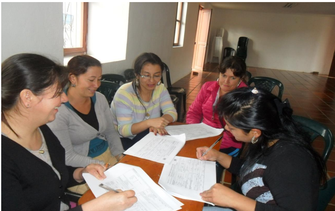
Grupo de Artesanas Municipio de Nariño Fotografía: Aida Inés Portilla Cerón Asesora