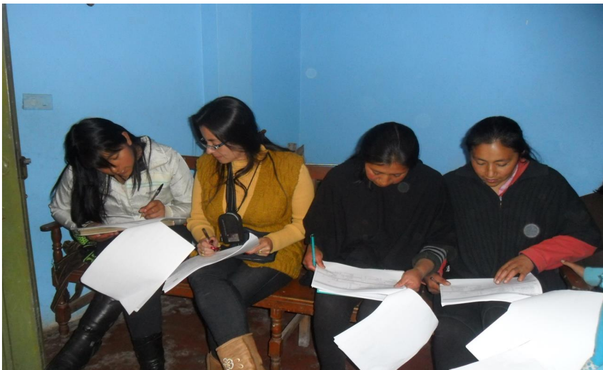
Grupo de Artesanas Resguardo Indígena de Panan – Municipio de Cumbal Fotografía: Aida Inés Portilla Cerón Asesora

Dentro de las mujeres encuestadas consideran los problemas más relevantes del sector al cual pertenecen la falta de apoyo institucional, la informalidad de los negocios los problemas de mercadeo y falta de innovación.