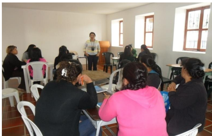
Grupo de Artesanas Municipio de Nariño