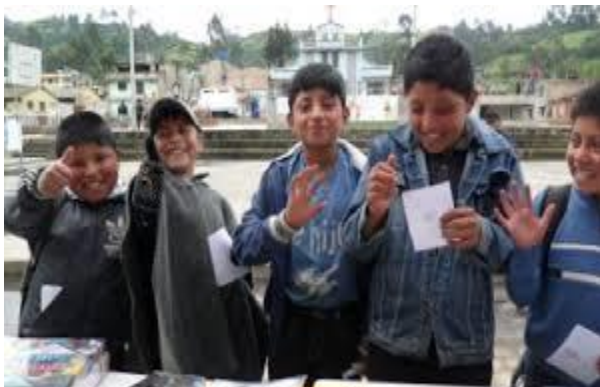
Municipio de Cumbal – Resguardo Indígena de Panam