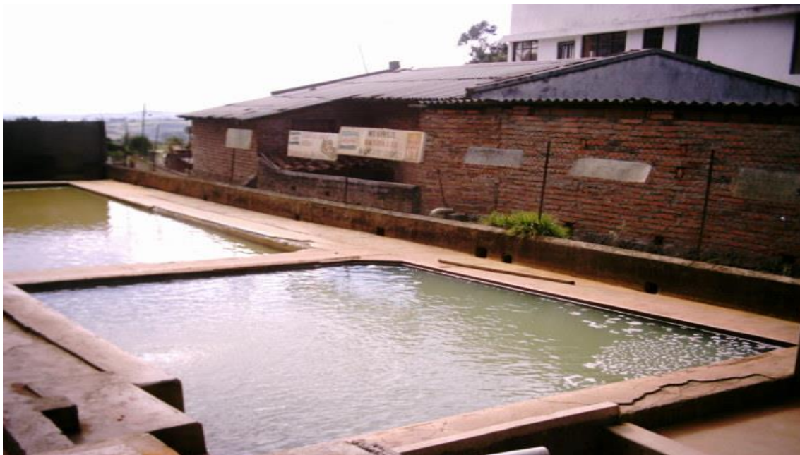
Municipio de Cumbal – Aguas Termales Corregimiento de chiles Fotografía: Aida Inés Portilla Cerón Asesora