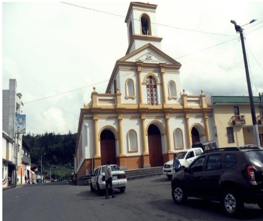
Municipio de Nariño – Iglesia cabecera municipal