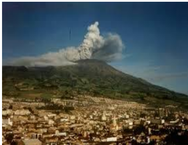
Municipio de San Juan de Pasto Panorámica de la ciudad – volcán Galeras