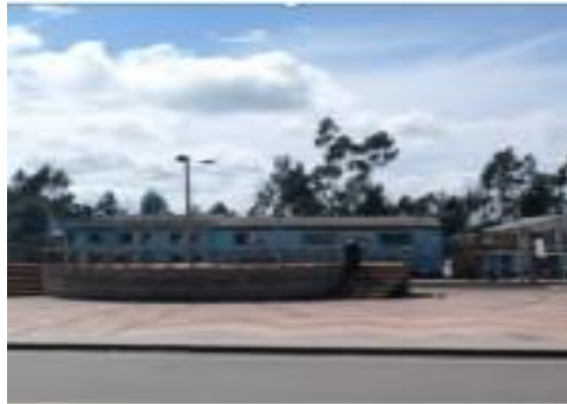
Municipio de Cumbal – Resguardo Indígena de Panam Parque principal de la localidad

Cumbal, Panam, Chiles y Mayasquer son los cuatro resguardos que actualmente pertenecen al Municipio de Cumbal, Nariño. Según las fuentes orales consultadas hasta el momento, limita hacia el norte con la Cabecera Municipal, con línea divisoria en el Río Blanco. Hacia el sur limita con el Resguardo de Chiles con línea divisoria en la quebrada Honda y el río Nazate o Capote. Hacia el oriente con el Municipio de Cuaspud (Carlosama) con línea divisoria en el camino que sale a Cumbal, desde el río Carchi hasta el punto denominado “Piedra de Cuatro Aljuegos”. Hacia el occidente, el resguardo de Panan limita con la vereda Cohetial, teniendo como línea divisoria un punto geográfico ubicado en el páramo llamado Vista de Mayasquer. Esta pequeña introducción geográfica se hace necesaria cuando se reconoce que la historia del resguardo se enmarca en la lucha por la tierra. En efecto, las conversaciones que se han entablado con los habitantes del resguardo, dejan ver un fuerte sentido de pertenencia a las tierras que, a sangre y fuego, han recuperado a lo largo de estos años. De ahí que sea importante la ubicación geográfica de esta comunidad indígena.