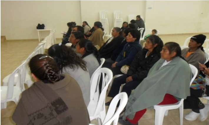
Grupo de Artesanas Municipio de Córdoba Fotografía: Aida Inés Portilla Cerón Asesora