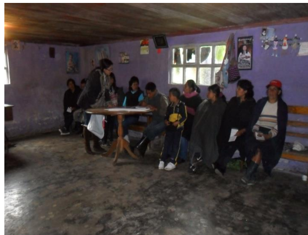
Grupo de Artesanas Asociación de Espino Puenguelan sector rural Municipio de Cumbal