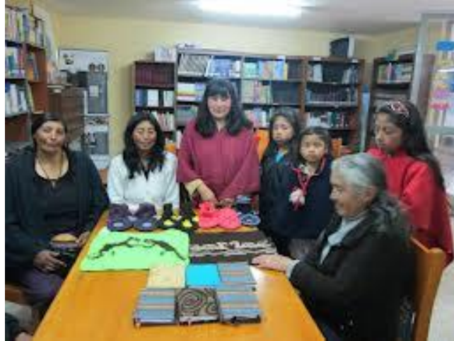
Municipio de Cumbal – Artesanas del Resguardo Indígena de Panam Fotografía: Aida Inés Portilla Cerón Asesora