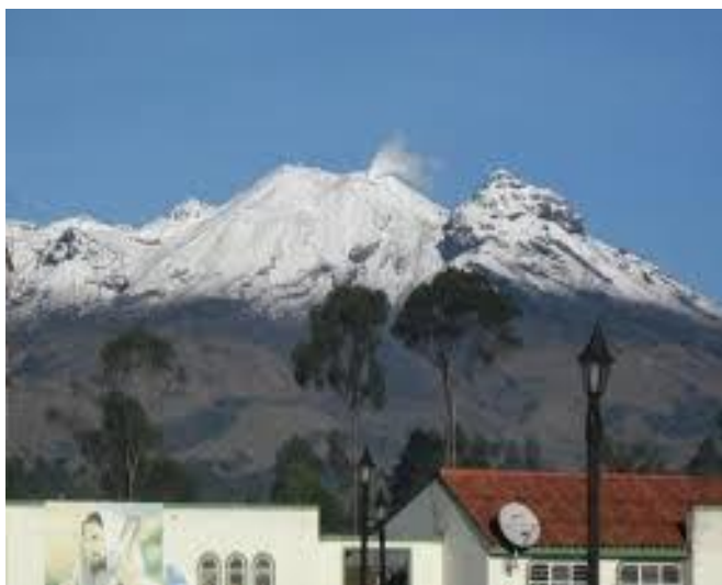
Municipio de Cumbal – Corregimiento de chiles Al pie del volcán Chiles

Este es un corregimiento en cual está situado al sur occidente de Nariño y Cumbal, a una distancia de 20 km del sector urbano, situado en la bella altiplanicie de su nombre, al pie del nevado de chiles. Limita con la frontera con el Ecuador, es rico y muy visitado por las personas que saben de esta riqueza natural la cual es: Las Aguas Termales, se dice que estas son medicinales ya que nacen de la tierra misma, esto lo hace un centro de atracción y turismo, también posee un hermoso volcán el cual es llamado volcán chiles,