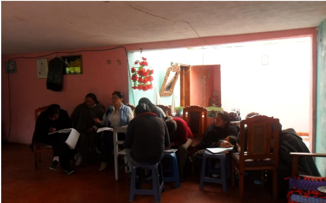
Grupo de Artesanas Corregimiento de Chiles, Vereda de Nazate – Municipio de Cumbal Fotografía: Aida Inés Portilla Cerón Asesora

Con respecto a las materias primas más utilizados para el desarrollo de su labor están hilo y lana, En promedio consideran que el 35% de la materia prima que utilizan es natural y un 65% industrial, estas las adquieren en el vecino país del Ecuador; considerando la cercanía y el precio son más cómodos.