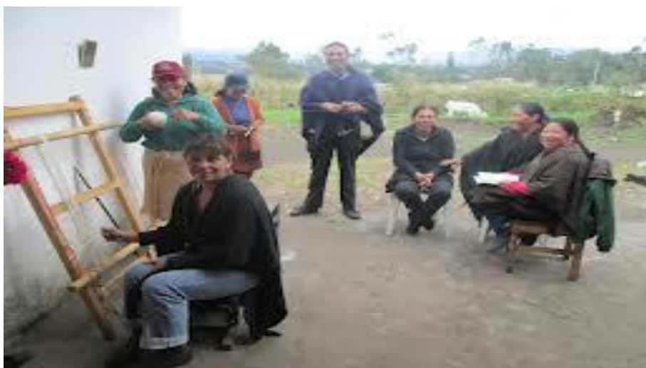
Municipio de Cumbal – Artesanas del Resguardo Indígena de Panam

El Resguardo de Panam hace parte del Nudo de Huaca o Nudo Montañoso de los Pastos, nombre genérico con el que normalmente se conoce la población indígena que habitó el sur del país, descendientes, dicen, de los aztecas o de los chibchas. Sea cual sea su origen, es evidente que los habitantes del Resguardo de Panam comparten varias características con otras comunidades andinas: la minga o el trabajo comunitario, la chagra, la música de zampoñas, entre otras. De allí que su organización política comparta los mismos principios de reciprocidad, retribución y comunidad tan propios del mundo andino. Esto no significa que tales principios sean garantía de una comunidad política armónica que no se ve afectada por las prácticas clientelistas y las lógicas de corrupción tan propias de nuestro sistema político. Hago mención de esto porque tales son las causas de la “crisis” actual en la organización sociopolítica del resguardo.