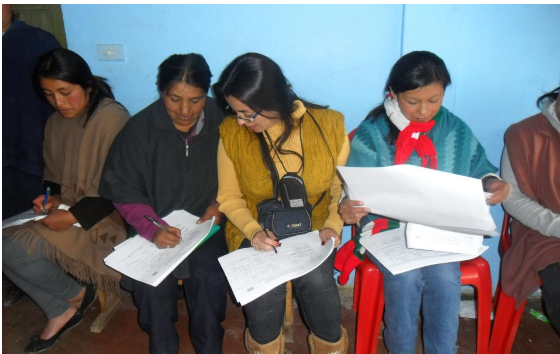
Grupo de Artesanas Resguardo Indígena de Panam – Municipio de Cumbal

Se convoca al grupo de artesanas de esta localidad teniendo en cuenta una solicitud verbal realizada al Enlace Regional del laboratorio de Diseño e Innovación, Artesanías de Colombia de Nariño