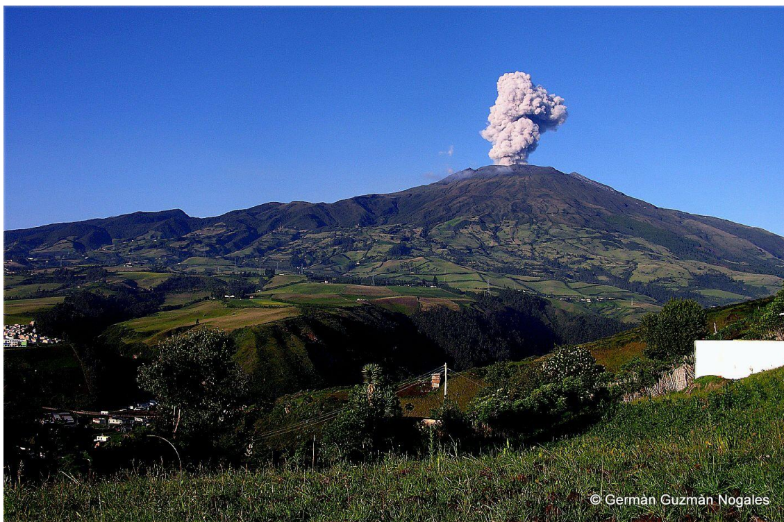
Municipio de San Juan de Pasto

La población total del municipio (Urbana y rural) estimada para 2012 según datos de proyección del DANE es de 434.540 habitantes.