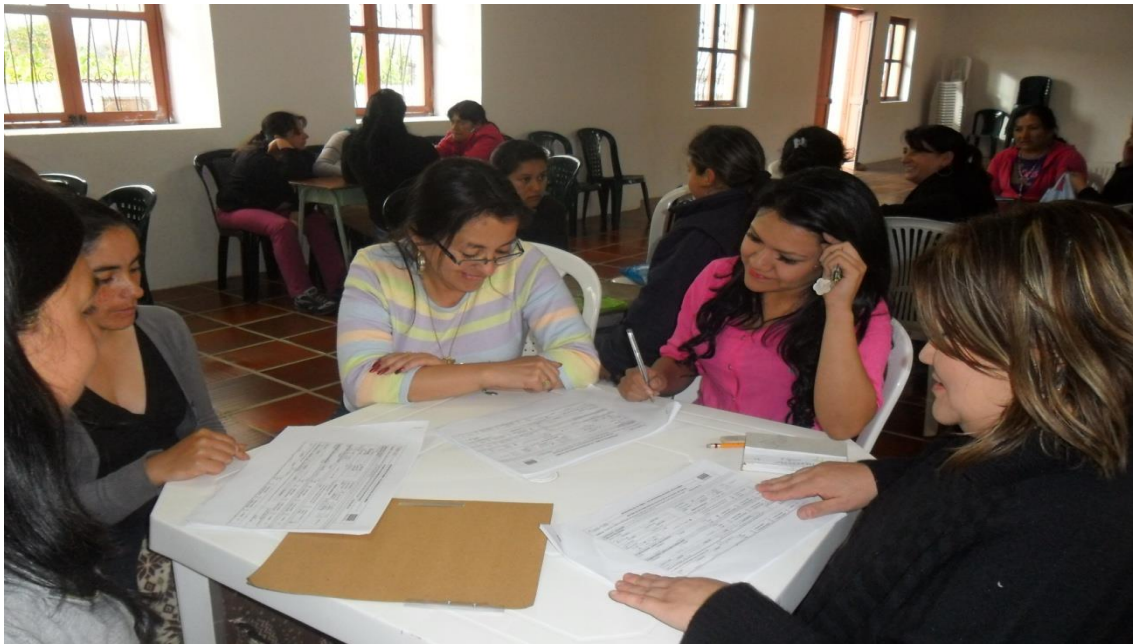
Grupo de Artesanas Municipio de Nariño Fotografía: Aida Inés Portilla Cerón Asesora

En cuanto a las herramientas de trabajo utilizada algunas de las artesanas cuentan con agujetas, agujones, agujas, máquinas de coser, etc. Las cuales están bastante obsoletas y desgastadas, debido a que no tienen los recursos económicos para comprar nuevas.