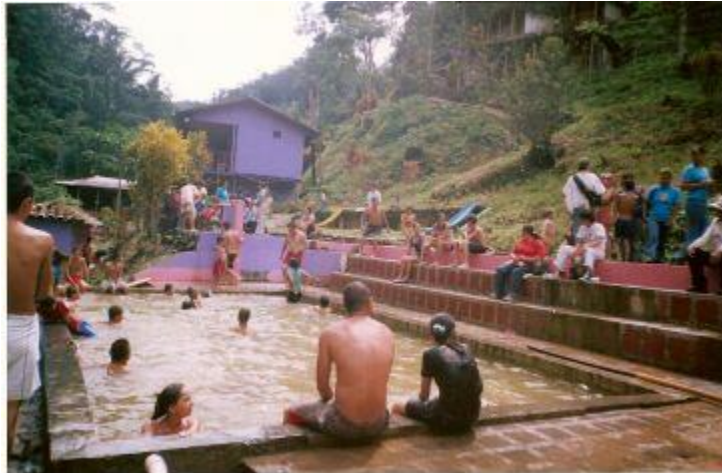
Municipio de Cumbal – Aguas Termales Corregimiento de chiles Fotografía: Aida Inés Portilla Cerón Asesora

rico en vegetación y no común mente como los demás. Está dividido pos 7 veredas: La Calera, Cristo Rey, San Fernando, Nazate, Chiles, Centro, San Francisco.