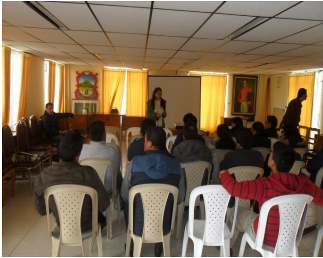
Grupo de Artesanas - Municipio de Potosí Fotografía: Aida Inés Portilla Cerón Asesora