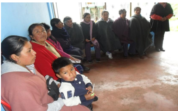
Grupo de Artesanas Resguardo Indígena de Panam – Municipio de Cumbal