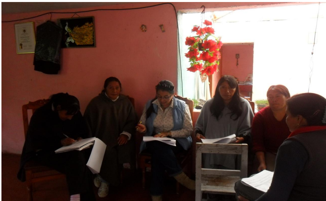
Grupo de Artesanas Corregimiento de Chiles, Vereda de Nazate – Municipio de Cumbal Fotografía: Aida Inés Portilla Cerón Asesora

Se atiende la solicitud realizada por el grupo de artesanas del corregimiento de chiles, donde se aplica el diagnóstico que permitió conocer una amplia información sobre el grupo de artesanas. A continuación se encuentran datos generales como: