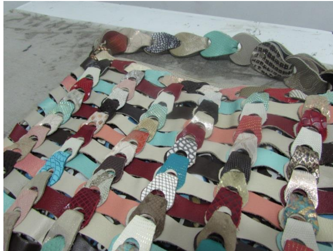
Fig. 4. [Fotografía de Herney Villota]. (Belén, Nariño 2014). Gobernación de Nariño, Artesanías de Colombia Fundación Emssanar, Bolso de cuero dama retazos del interior del país. Proceso del cuero. Belén, Nariño.

En la marroquinería los residuos son utilizados en lo más pequeño de los productos carteras o llaveros pero en otros casos los sobrantes se los envían desde el centro del país.