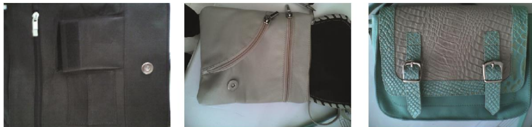
Fig. 25, 26, 27. [Fotografía de Herney Villota]. (Belén, Nariño 2014). Fundación Emssanar, bolso caballero y bolsos dama de cuero. Belén, Nariño.