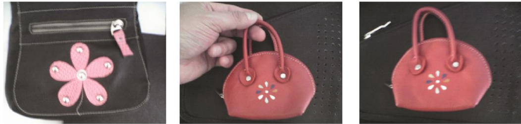
Fig. 19, 20, 21. [Fotografía de Herney Villota]. (Belén, Nariño 2014). Fundación Emssanar, manos libres, monedero de cuero. Belén, Nariño.