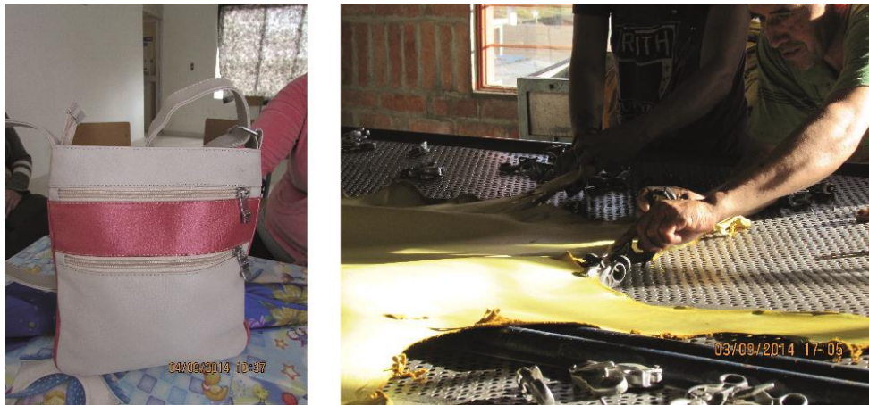
Fig. 1, 2. (Belén, Nariño 2014). Gobernación de Nariño, Artesanías de Colombia Fundación Emssanar, Bolso de cuero dama. Proceso del cuero. Belén, Nariño.

En el municipio de Belén sus productos son de buena calidad su oficio lo aprenden desde muy jóvenes y la mayor parte del municipio vive de este trabajo. Todos son independientes y sus talleres son en casa, la mayor parte son productos que son dirigidos a accesorios de moda como lo son bolsos, correas, carteras pequeñas, billeteras y calzado. En otros casos talabartería,