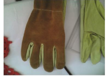
Fig. 31, 32, 33. [Fotografía de Herney Villota]. (Belén, Nariño 2014). Fundación Emssanar, guantes de carnaza. Belén, Nariño.