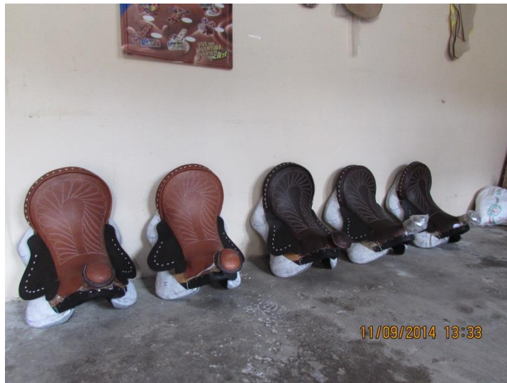
Fig. 6. [Fotografía de Herney Villota]. (Belén, Nariño 2014). Gobernación de Nariño, Artesanías de Colombia Fundación Emssanar, oficio de talabartería. Proceso del cuero. Belén, Nariño.

Su oficio es la marroquinería su materia prima es el cuero de vaca y otros bovinos sus técnicas son el corte, envivado, desbaste y pegar, tienen una gran problema con los herrajes pierden su brillo, y todos solo usan un tipo de broches y manijas, muy poco manejan los cueros sintéticos y las telas para el forro son muy limitados ya que en el mercado no encuentran una variedad solo usan ceda china y en otros casos telas para forros nada de estampados. También están empleando el oficio de la decoración del cuero en algunos productos pintan figuras representativas (mariposas, flores, figuras religiosas y paisajes) y también se manifiesta el repujado. Se encuentra mucha copia de otros mercados, la usencia del proceso de diseño es muy notable, no es muy claro el tema de Líneas y colección. Su usabilidad es buena su producto es bien adaptado antropométricamente. Las artesanas también realizan productos en serie como lo son las monederos y carteras pequeñas, su conocimiento de los costos variables y fijos son poco entendidos.