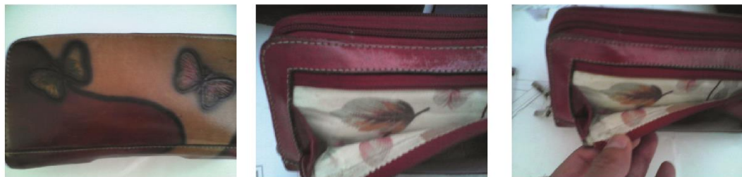
Fig. 22, 23, 24. (Belén, Nariño 2014). Fundación Emssanar, manos libres de cuero. Belén, Nariño.