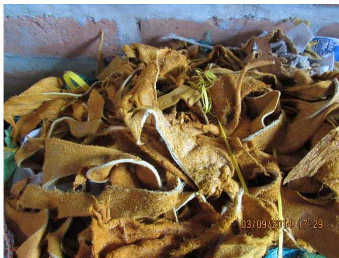
Fig. 3. [Fotografía de Herney Villota]. (Belén, Nariño 2014). Gobernación de Nariño, Artesanías de Colombia Fundación Emssanar, residuos del cuero, utilizado para la realización de productos industriales. Proceso del cuero. Belén, Nariño.

Un 65% de la población trabajan en el oficio de la marroquinería un 12% por ciento trabaja en las curtiembres un 5% en calzado, 8% en talabartería, 3% en prendas de vestir aunque el cuero utilizado no es de buena calidad para las prendas un 2% realiza sombreros y el 5% en el manejo del cuero para la industria (guantes y petos) los residuos de los sobrantes en algunos oficios no son utilizados como los son los residuos del cuero para la industria.