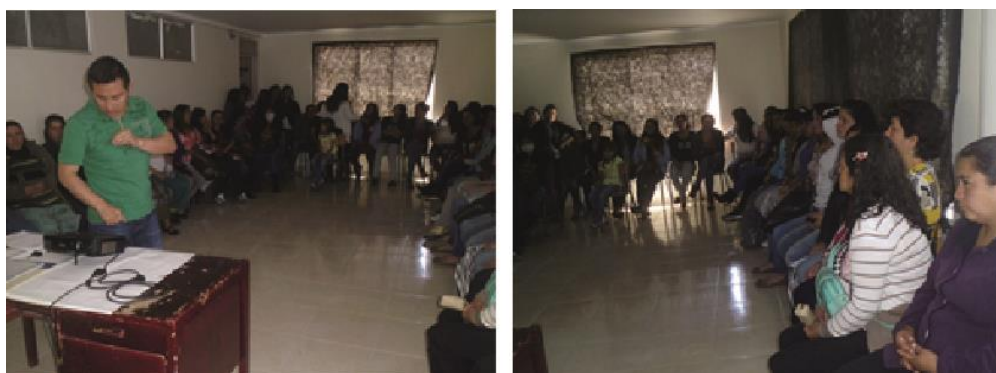
Fig. 14, 15. (Belén, Nariño 2014). Fundación Emssanar, grupo de artesanías. Belén, Nariño.