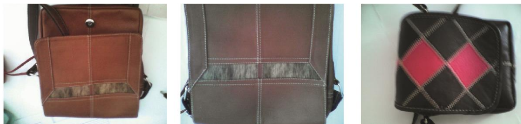
Fig. 28, 29, 30. (Belén, Nariño 2014). Fundación Emssanar, Bolsos dama bolso dama de cuero. Belén, Nariño.