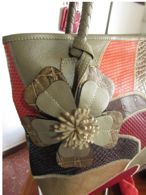
Fig. 5. (Belén, Nariño 2014). Gobernación de Nariño, Artesanías de Colombia Fundación Emssanar, Bolso de cuero dama. Proceso del cuero. Belén, Nariño.

Reutilizan también los retazos de cuero, pero también esos retazos los obtienen de otras ciudades por medio de familiares (Bogotá, Bucaramanga)