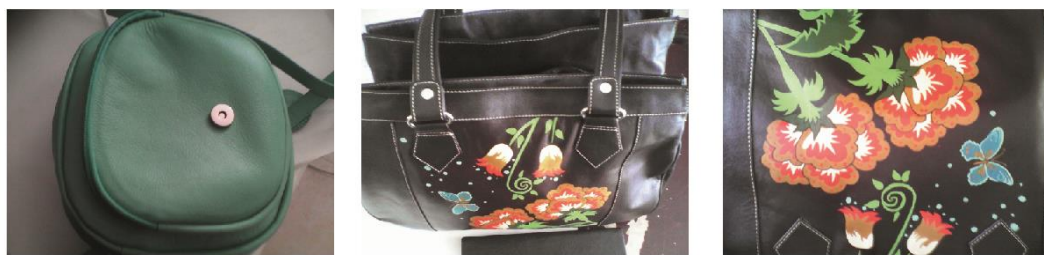
Fig. 16, 17, 18. (Belén, Nariño 2014). Fundación Emssanar, Bolso dama, Bolso dama de cuero pintado. Belén, Nariño.