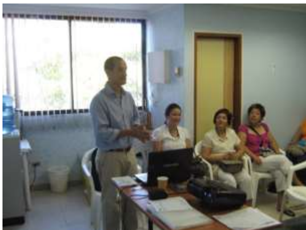
Fotografía: Omar D Martínez Artesanías de Colombia S.A Sociabilización de Expoartesanías 2010 San Andrés Islas enero 2011

Con los beneficiarios de la cooperativa se abordaron temas de producción, diversificación, precio y calidad del producto artesanal con relación a los competidores directos de la feria. Con ellos determinamos que una de las mayores falencias fueron los precios, teniendo en cuenta que la participación de ellos en Expoartesanías 2010 fue costada en su totalidad, no solo a nivel del stand y transporte, sino también con la dotación de insumos para la elaboración de los productos que elaboraron; aunque el nivel de calidad fue muy bueno en la mayoría de los oficios artesanales, habían casos como las bandejas enchapadas en coco, cuyos precios competían con otros tipos de enchape en cacho y diversidad de maderas, que en calidad los superaban, ya que los artesanos que las elaboraron llevan años en ejercicio de su oficio artesanal. Con esto se determinó la importancia de sacar costos en la fase de producción para ser mas competitivos a nivel de comercialización, y tener en cuenta los precios de la competencia.