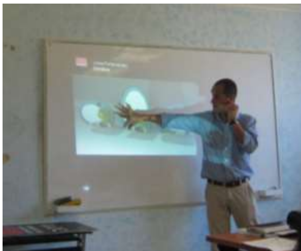
Fotografía: Omar D Martínez Artesanías de Colombia S.A Sociabilización propuestas de diseño San Andrés Islas enero 2011