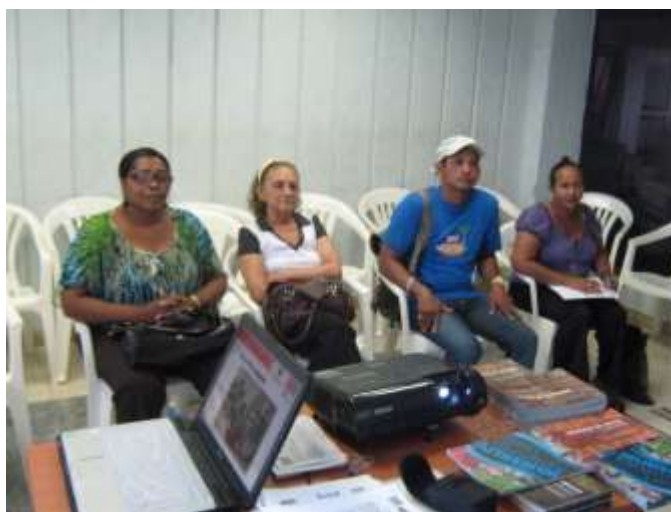
Fotografía: Omar D Martínez Artesanías de Colombia S.A Sociabilización Expoartesánias 2010 San Andrés Islas enero 2011

Con el grupo de beneficiarios de la asociación se analizó la producción, diversificación, precio y calidad del producto artesanal, se tuvieron en cuenta los productos que elabora la competencia y en que se puede mejorar, se llegó a la conclusión de que es necesario planificar mas la producción, no solo a nivel de cantidad y calidad, sino para el desarrollo y elaboración de nuevas propuestas que permitan tener una mayor cobertura de mercado. Se abordó el tema de presentación de los productos en una feria, como hacerlo, como ,llevar el inventario de los mismos, la correcta forma de empacarlos para evitar deterioros en el transporte de los productos; se tuvieron en cuenta aspectos de atención al público presentación y dispocición.