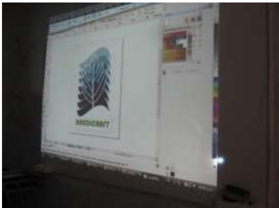
Fotografía: Omar D Martínez Artesanías de Colombia S.A Sociabilización propuestas de diseño San Andrés Islas enero 2011

Dentro del desarrollo del taller se presentaron las propuestas para la imagen gráfica del grupo Handicraft, se socializaron y se hicieron observaciones para mejora de las mismas, estas está en el anexo 1 de imagen grafica.