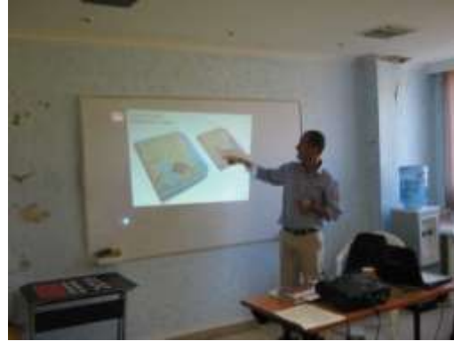
Fotografía: Omar D Martínez Artesanías de Colombia S.A Sociabilización propuestas de diseño San Andrés Islas enero 2011

Aprovechando la coyuntura de los proyectos se hizo entrega del material didáctico a cada uno de los beneficiarios asistentes, que consistía en las memorias de oficio de las diferentes técnicas artesanales que se enseñaron y fortalecieron dentro del marco de los proyectos, se entregaron 4 cartillas por artesano, las restantes se dejaron en manos del representante legal de la cooperativa. Se entregó a la Señora Rosalee la cartilla para el manejo sostenible del Wildpine.