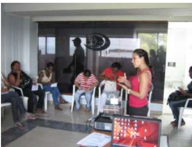
Sociabilización propuestas de diseño San Andrés Islas enero 2011

Con este grupo de beneficiarias se hizo énfasis en la parte productiva y en la estandarización de medidas, con la finalidad de que todas las beneficiarias desarrollen patrones de productos similares; uno de los mayores fuertes que tuvo el producto desarrollado en wildpine fue el uso del color en la fibra vegetal, esto según las beneficiarias que participaron en la feria constituyó una novedad para los compradores, en el taller se recalcó la parte de teoría del color, para que ellas puedan sacar productos con mayor contraste y gamas.