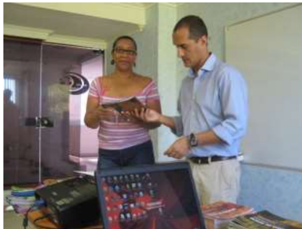
Fotografía: Omar D Martínez Artesanías de Colombia S.A Entrega de cartillas San Andrés Islas enero 2011

Aprovechando la coyuntura de los proyectos se hizo entrega del material didáctico a cada uno de los beneficiarios asistentes, que consistía en las memorias de oficio de las diferentes técnicas artesanales que se enseñaron y fortalecieron dentro del marco de los proyectos, se entregaron 4 cartillas por artesano, las restantes se dejaron en manos del representante legal de la cooperativa. Se entregó a la Señora Rosalee la cartilla para el manejo sostenible del Wildpine.