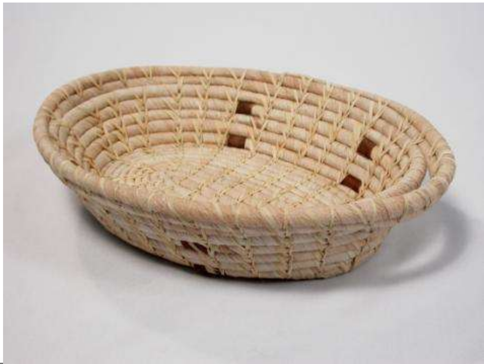
Calceta de plátano