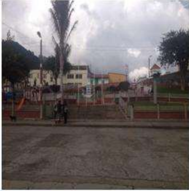
Foto capacitación Tomada por: Gloria Duque Marulanda, Caldas- marzo 14-15 de 2013 Artesanías de Colombia S.A.