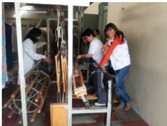
Foto capacitación patronaje y telar horizontal Tomada por: Gloria Duque Salamina, Caldas- febrero 13- 14 de 2013 Artesanías de Colombia S.A.

Realizamos asistencia técnica y capacitaciones en tejido plano y patronaje a san Vicente de paúl, en las cuales se enseñó a diseñar tejidos en planos y a plasmarlos en el telar, por otro lado se capacitó en patronaje y en tallaje de las ruanas para lograr así estandarizarlas por tallas S-M-L.