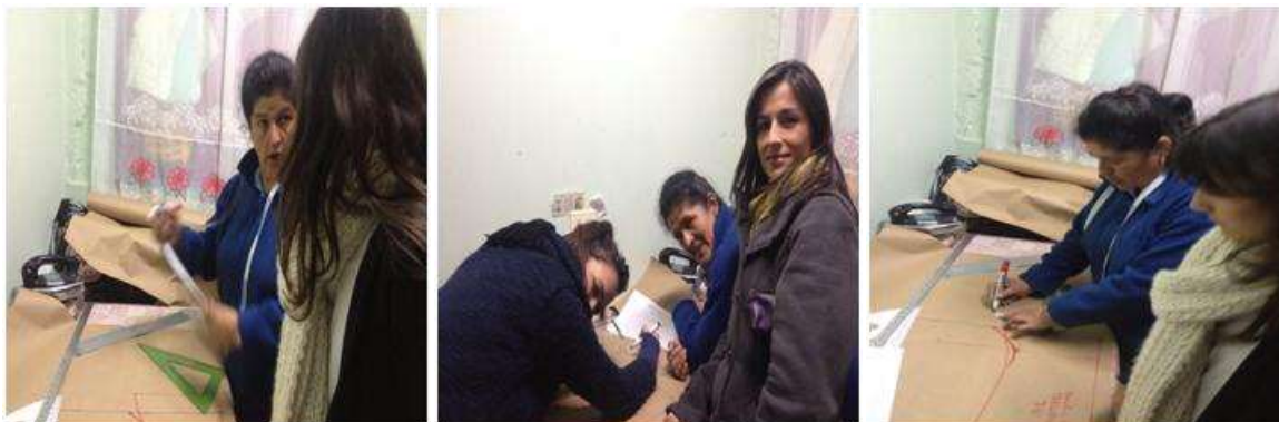
Foto capacitación en patronaje

Caldas- marzo 14-15 de 2013 Artesanías de Colombia S.A.