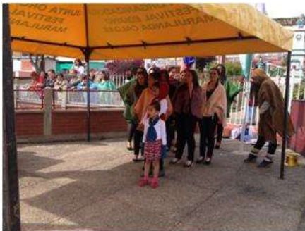
Foto Pasarela Tomada por: Gloria Duque Marulanda, Caldas- marzo 23 de 2013 Artesanías de Colombia S.A.