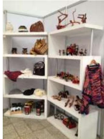
Fotos Stand Expo equinos Manizales, Caldas, Marzo22;24 de 2013 Artesanías de Colombia S.A.