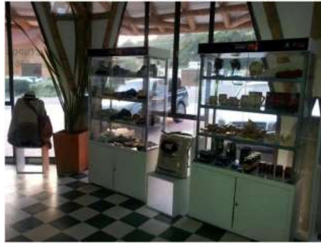
Foto arreglo vitrinas Manizales, Caldas- marzo de 2013