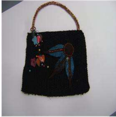
Foto asistencia técnica Tomada por: Gloria Duque Aranzazu, Caldas- febrero 9 de 2013 Artesanías de Colombia S.A.

Capacitación de experto marroquino, en la cual se dictaron los parámetros necesarios, tanto de manera teórica como práctica, para la implementación del tejido de fique y el cuero, para la elaboración de bolsos y complementos marroquinos.