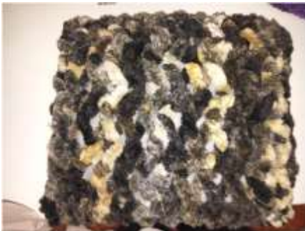
Foto asesoría puntual Tomada por: Gloria Duque Manizales, Caldas- marzo 7 de 2013 ,Artesanías de Colombia S.A.