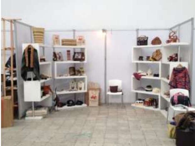
Fotos Stand Expo equinos Manizales, Caldas, Marzo22;24 de 2013 Artesanías de Colombia S.A.