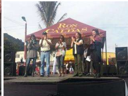
Foto Pasarela Tomada por: Gloria Duque Marulanda, Caldas- marzo 23 de 2013 Artesanías de Colombia S.A.