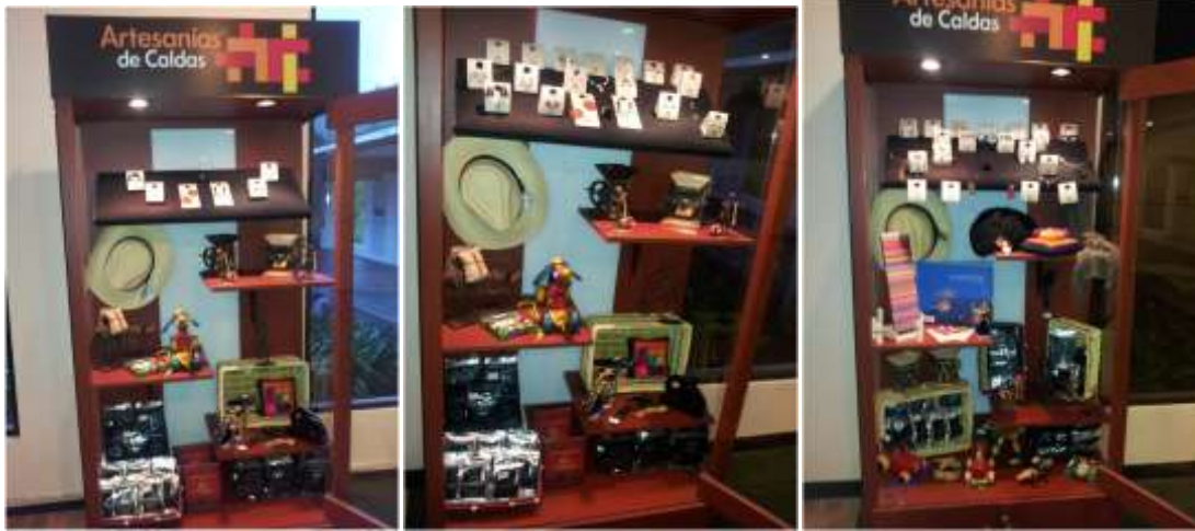
Foto arreglo vitrinas Manizales, Caldas- marzo de 2013