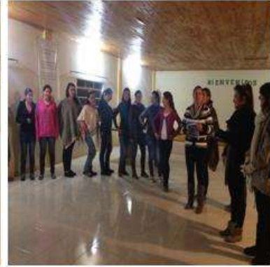
Foto capacitación Tomada por: Gloria Duque Marulanda, Caldas- marzo 14-15 de 2013 Artesanías de Colombia S.A.