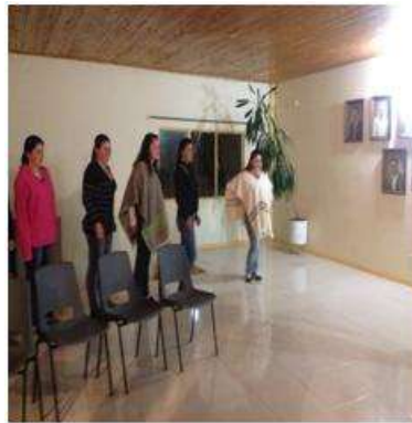
Foto capacitación Tomada por: Gloria Duque Marulanda, Caldas- marzo 14-15 de 2013 Artesanías de Colombia S.A.

Se hizo parte de la logística en la celebración de los 75 Años de la Cooperativa ovina.