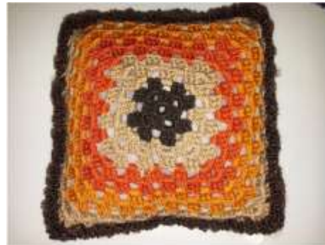
Foto asesoría puntual Tomada por: Gloria Duque Manizales, Caldas- marzo 7 de 2013 ,Artesanías de Colombia S.A.