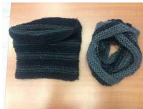
Foto asesoría puntual Tomada por: Alejandra Martínez Manizales, Caldas- marzo 19 de 2013 ,Artesanías de Colombia S.A.