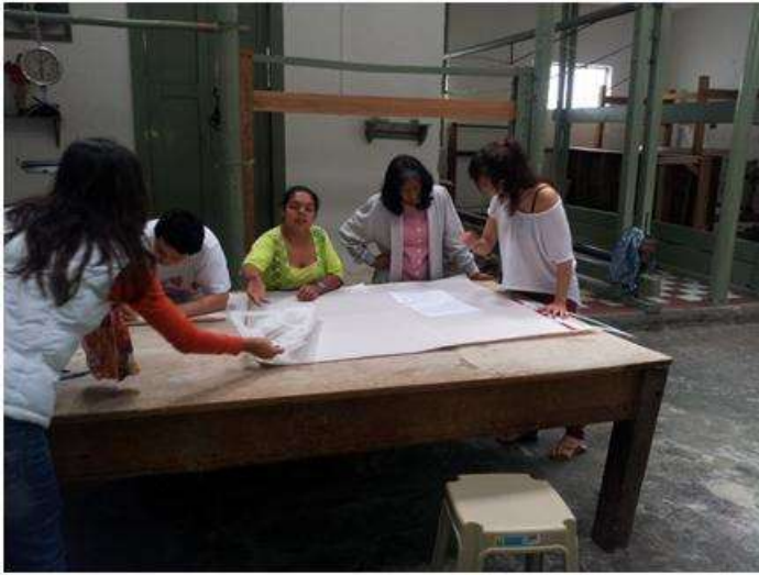
Foto capacitación patronaje y telar horizontal Tomada por: Gloria Duque Salamina, Caldas- febrero 13- 14 de 2013 Artesanías de Colombia S.A.