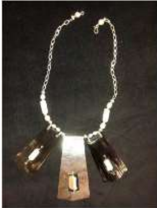
Foto asesoría puntual Tomada por: Gloria Duque Manizales, Caldas- febrero 6 de 2013 ,Artesanías de Colombia S.A.