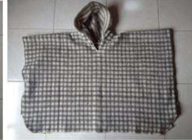
Foto Asistencia técnica Tomada por: Gloria Duque Marulanda, Caldas- marzo 23 de 2013 Artesanías de Colombia S.A.