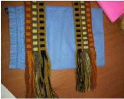
Foto asesoría puntual Tomada por: Gloria Duque Manizales, Caldas- febrero 28 de 2013 ,Artesanías de Colombia S.A.