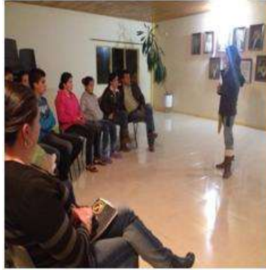
Foto capacitación Tomada por: Gloria Duque Marulanda, Caldas- marzo 14-15 de 2013 Artesanías de Colombia S.A.