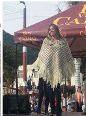
Foto Pasarela Tomada por: Gloria Duque Marulanda, Caldas- marzo 23 de 2013 Artesanías de Colombia S.A.