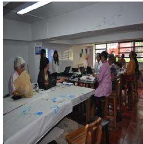
Foto talleres marzo Manizales, Caldas- marzo 5 de 2013 ,Artesanías de Colombia S.A.