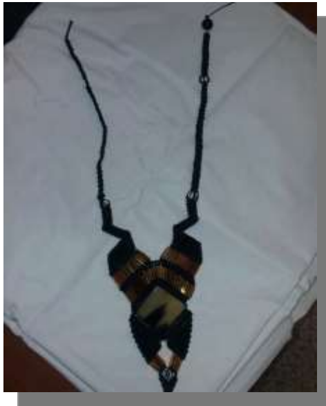
Foto asesoría puntual Manizales, Caldas- febrero 5 de 2013 ,Artesanías de Colombia S.A.

La técnica macramé, es la que este artesano fusiona con cacho y bisutería. Se le hace la sugerencia de hacer exploración de diferentes calibres de hilo y texturas un poco más suave, a la vez se planteó la modulación de las formas que viene trabajando.