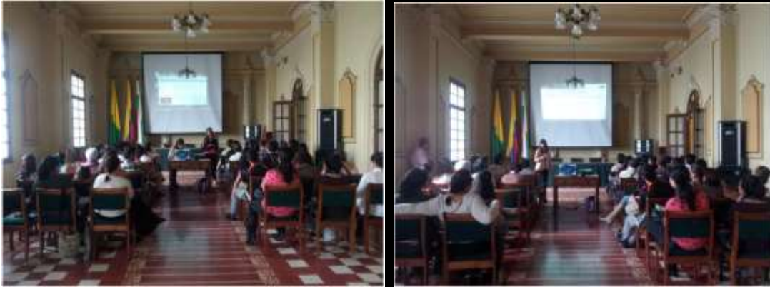
Foto CAPACITACIÓN TENDENCIAS Manizales, Caldas- FEBRERO DE 2013 ,Artesanías de Colombia S.A.