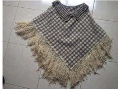
Foto Asistencia técnica Tomada por: Gloria Duque Marulanda, Caldas- marzo 23 de 2013 Artesanías de Colombia S.A.