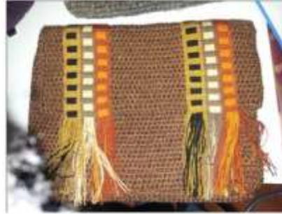
Foto asesoría puntual Tomada por: Gloria Duque Manizales, Caldas- febrero 28 de 2013 ,Artesanías de Colombia S.A.