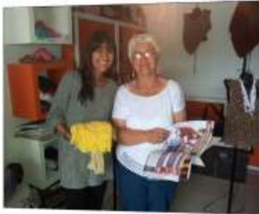
Foto asesoría puntual Tomada por: Gloria Duque Manizales, Caldas- marzo 11 de 2013 ,Artesanías de Colombia S.A.