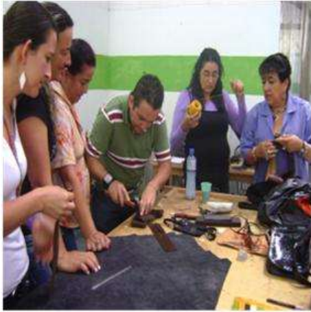
Foto asistencia técnica Tomada por: Gloria Duque Aranzazu, Caldas- febrero 9 de 2013 Artesanías de Colombia S.A.

Piedrahita, dicto una charla en la cual se dejaron claras las bases para el oficio y se despejaron las dudas de los artesanos de Aránzazu.