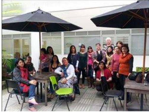
Foto taller TENDENCIAS Tomada por: Gloria Duque Manizales, Caldas- febrero 7 de 2013 ,Artesanías de Colombia S.A.

Se realizó taller en donde se puso en práctica los temas tratados en la charla de tendencias, como fue el manejo de gamas cromáticas, texturas y actitudes, entre otras.