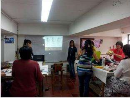
Foto taller TENDENCIAS Tomada por: Gloria Duque Manizales, Caldas- febrero 7 de 2013 ,Artesanías de Colombia S.A.