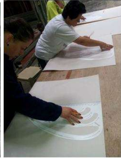
Foto capacitación patronaje y telar horizontal Tomada por: Gloria Duque Salamina, Caldas- febrero 13- 14 de 2013 Artesanías de Colombia S.A.

También se capacitó en tendencias de moda otoño-invierno 2013-2014 y en el conocimiento y manejo de las ruanas, ponchos y bufandas, elaboradas en San Vicente, en las diferentes tipologías de cuerpos existentes.