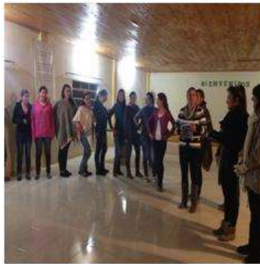
Foto capacitación Tomada por: Gloria Duque Marulanda, Caldas- marzo 14-15 de 2013 Artesanías de Colombia S.A.