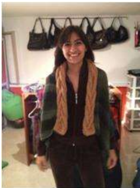
Foto asesoría puntual Tomada por: Gloria Duque Manizales, Caldas- marzo 11 de 2013 ,Artesanías de Colombia S.A.