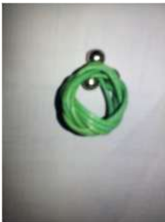
Foto asesoría puntual Manizales, Caldas- febrero 21 de 2013 ,Artesanías de Colombia S.A.