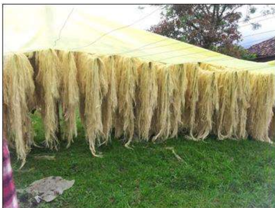
Foto asistencia técnica Tomada por: Gloria Duque Salamina, Caldas- febrero 13- 14 de 2013 ,Artesanías de Colombia S.A.