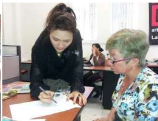
Foto asesoría puntual Tomada por: Alejandra Martínez Manizales, Caldas- febrero 18 de 2013 ,Artesanías de Colombia S.A.