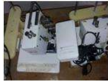
Foto asistencia técnica Tomada por: Gloria Duque Aranzazu, Caldas- febrero 9 de 2013 ,Artesanías de Colombia S.A.

Diagnóstico del estado de la maquinaria del taller, donde se encontraron: