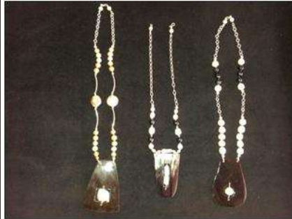
Foto asesoría puntual Manizales, Caldas- febrero 6 de 2013 ,Artesanías de Colombia S.A.