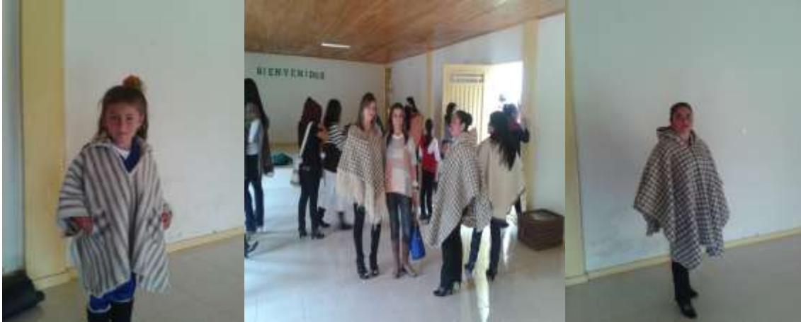
Foto Pasarela Tomada por: Gloria Duque Marulanda, Caldas- marzo 23 de 2013 Artesanías de Colombia S.A.

Los productos diseñados fueron vendidos casi en su totalidad en la exposición artesanal que se hizo posterior a la pasarela, demostrando así su aceptación y la posibilidad de una fácil comercialización.