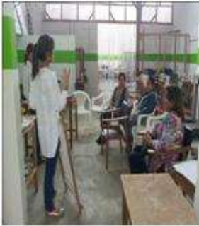
Foto taller tendencias y manejo de telar Tomada por: Gloria Duque Aranzazu, Caldas- febrero 9 de 2013 ,Artesanías de Colombia S.A.