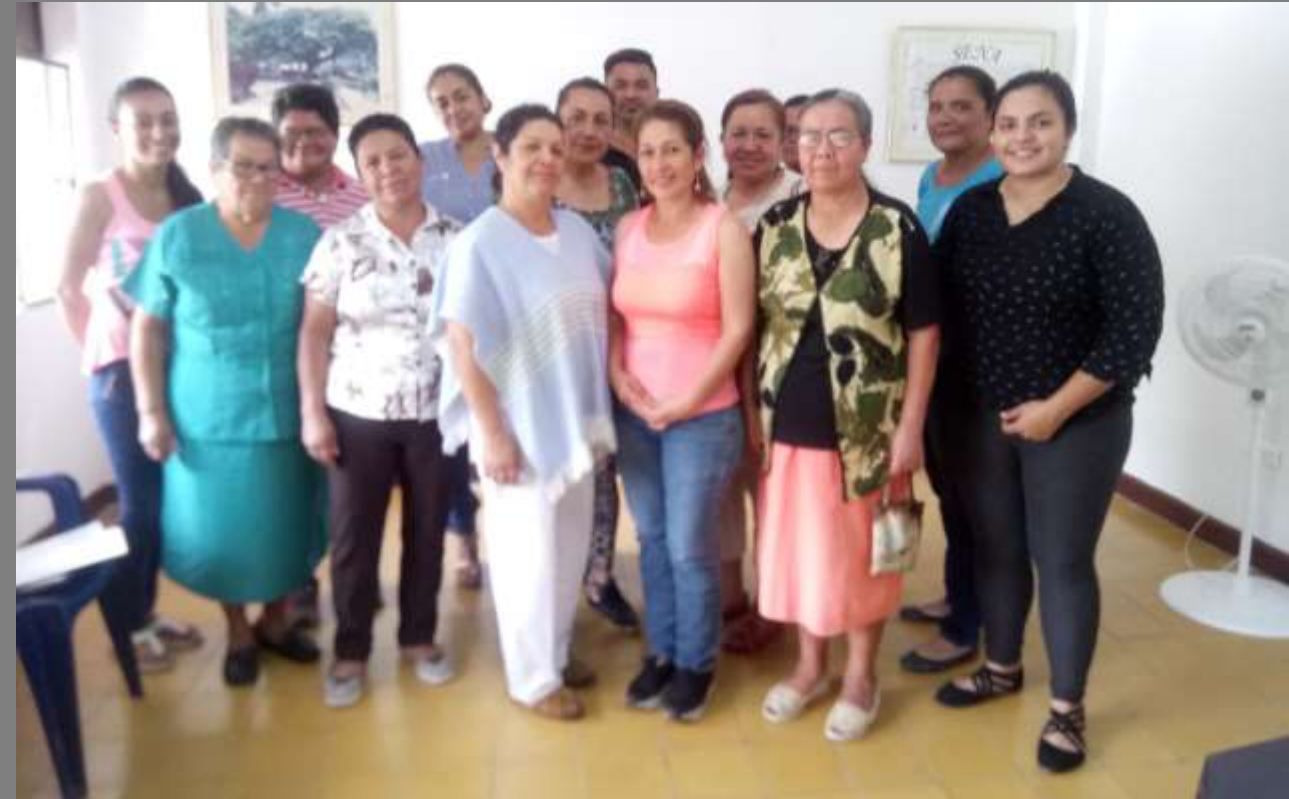
PLANO GENERAL DE LA COMUNIDAD/MANUALIDADES

Foto tomada por Alexandra Savelli Bochalema, Norte de Santander