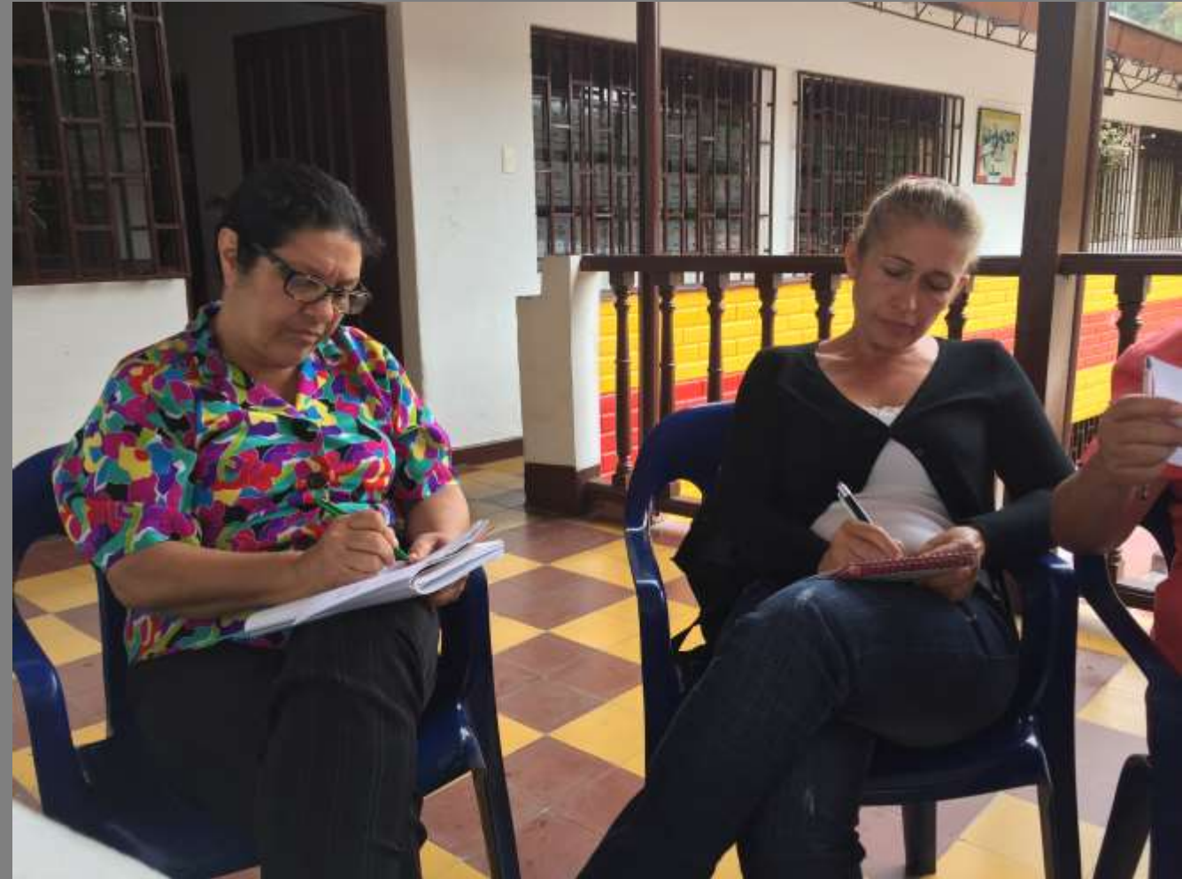
Bochalema, Norte de Santander

Como a actividad a desarrollar por las artesanas de la comunidad en el lapso de tiempo hasta el taller siguiente, deben a partir de los referentes, elaborar sus propias paletas de colores con sus respectivas armonías