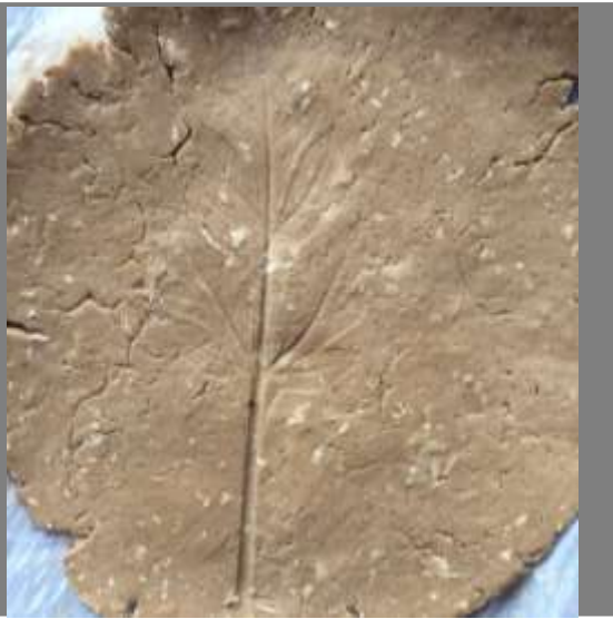
Muestra de textura

Fotos tomadas por Alexandra Savelli Bochalema, Norte de Santander