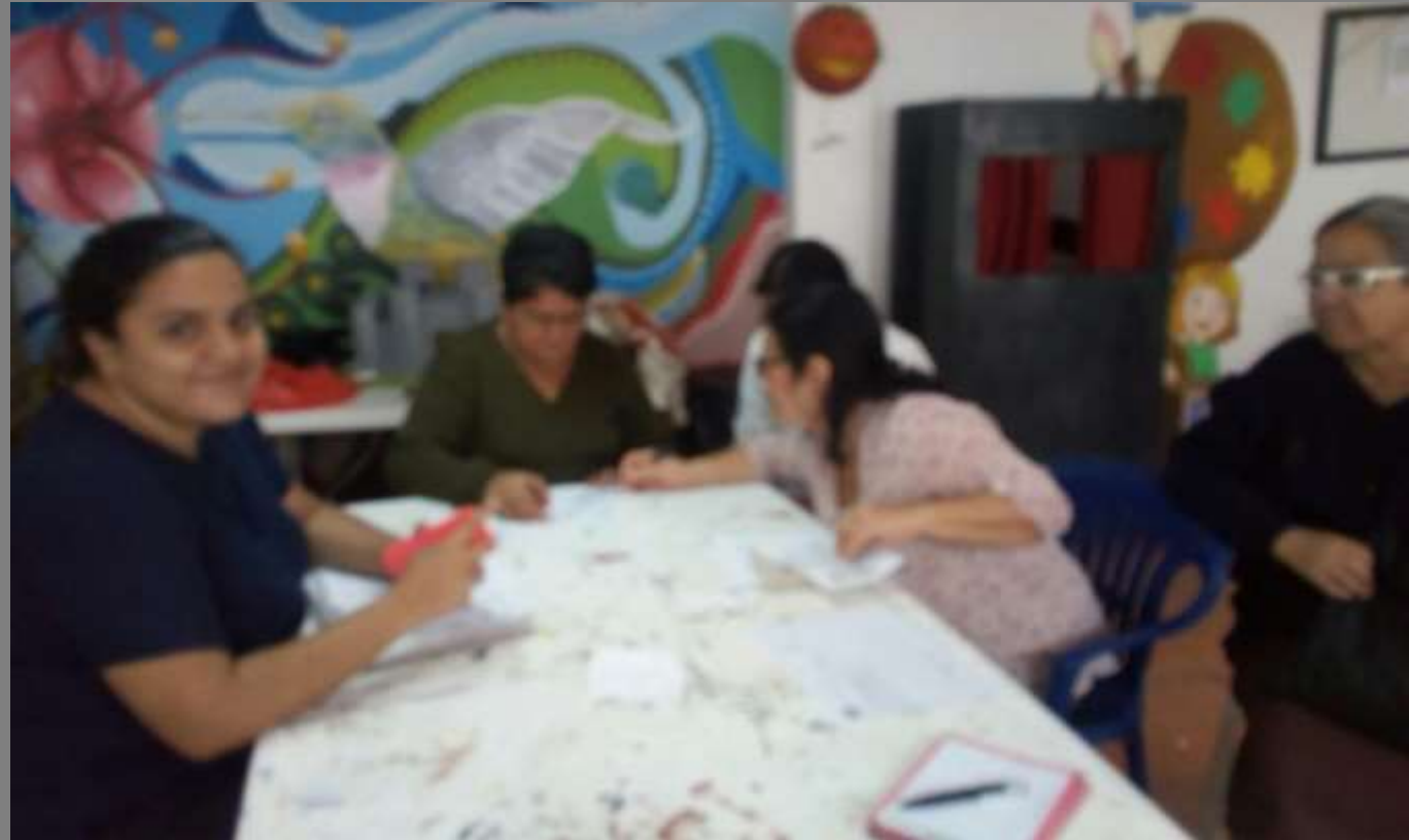
Foto tomada por participante de la actividad Bochalema, Norte de Santander

Por motivos de fuertes lluvias ese día, no se pudo realizar el recorrido para identificar elementos del entorno para extraer sus texturas, por lo tanto, con los artesanos se llegó a un acuerdo de realizar un ejercicio de copiar con la macilla las texturas que identificaran en el municipio y revisarlas en el siguiente encuentro como una asistencia técnica.