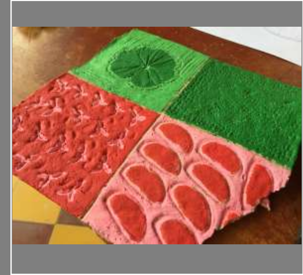
Muestra de texturas