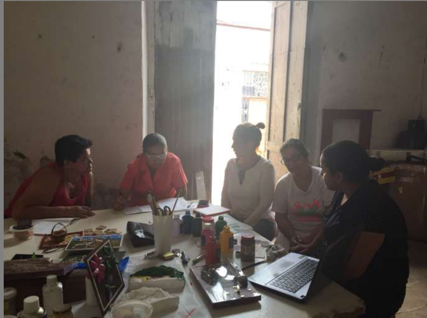
Foto tomada por participante de la actividad Bochalema, Norte de Santander

Las artesanas, por medio de bocetos, hicieron sus propuestas de línea de producto .