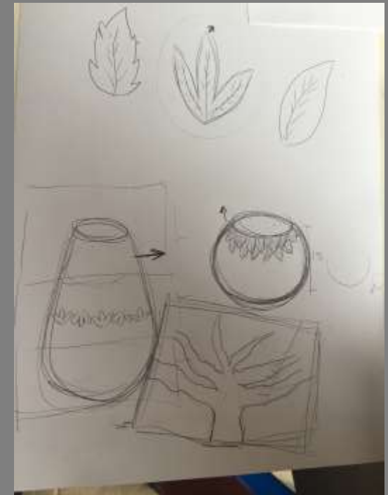
Norte de Santander