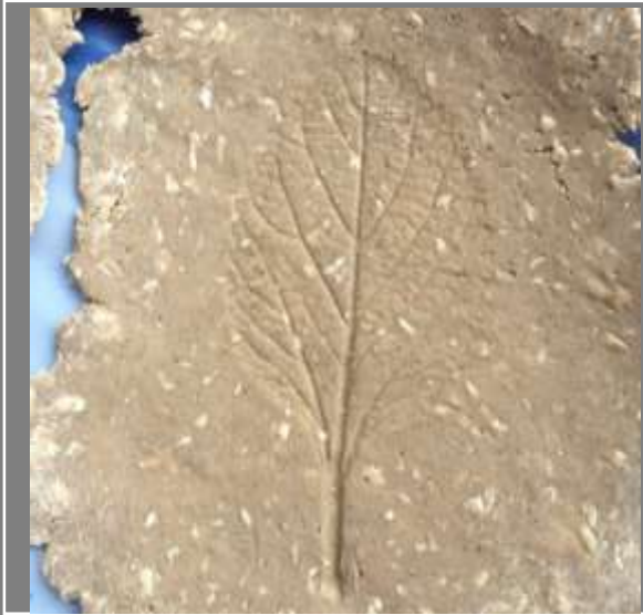
Muestra de textura