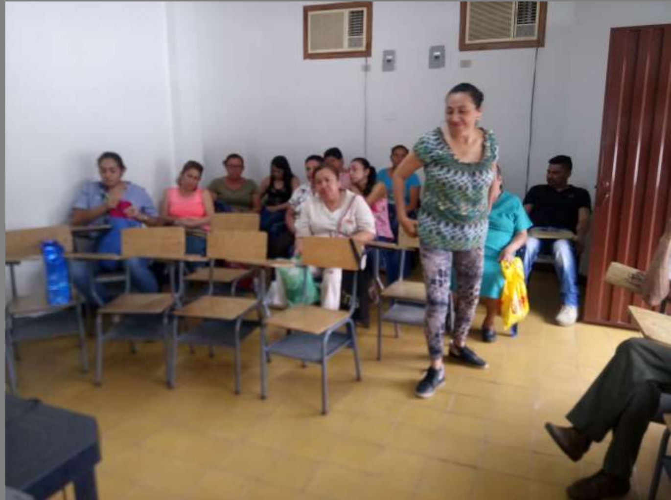
BOchalema, Norte de Santander

Con esta comunidad también se realizó el levantamiento de línea base en una segunda sesión.