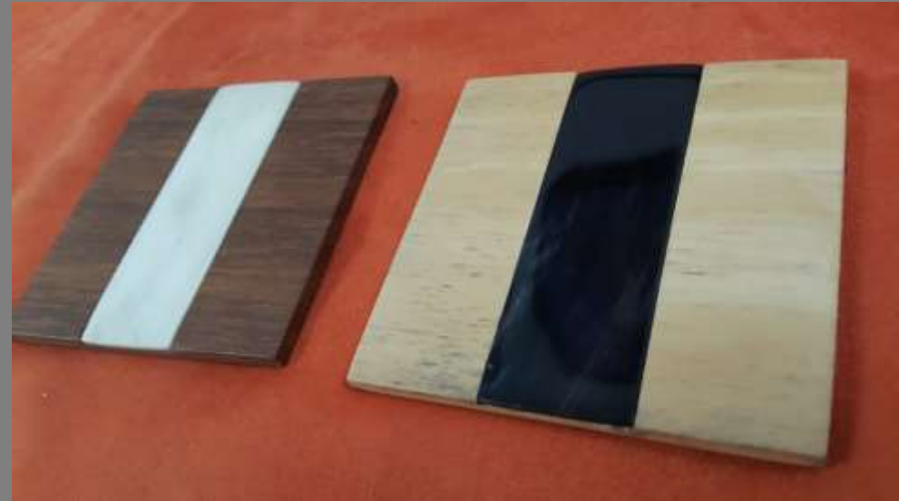
Bochalema, Norte de Santander