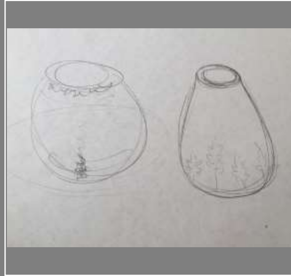
Boceto aplicación de texturas